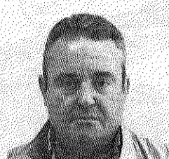
SANTIAGO NAVARRO MESEGUER SECRETARIO GENERAL DE CC OO EN LA REGIÓN

Las movilizaciones mantenidas en el tiempo, que se han llevado a cabo desde el año 2013 en defensa de las pensiones, la huelga y movilizaciones multitudinarias que se llevaron a cabo el pasado 8 de marzo (por la igualdad, contra las brechas de género en el empleo, las violencias machistas y las desigualdades en la protección social) han permitido iniciar un pro-