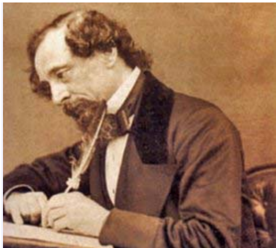
Bicentenario del nacimiento de Charles Dickens