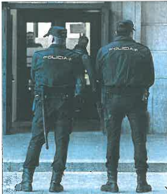
Dos agentes de policía en los juzgados de Sevilla.

El protocolo hace especial hincapié en buscar la colaboración tanto de la familia y el entorno del agente como de sus propios compañeros y jefes, tanto para detectar las conductas