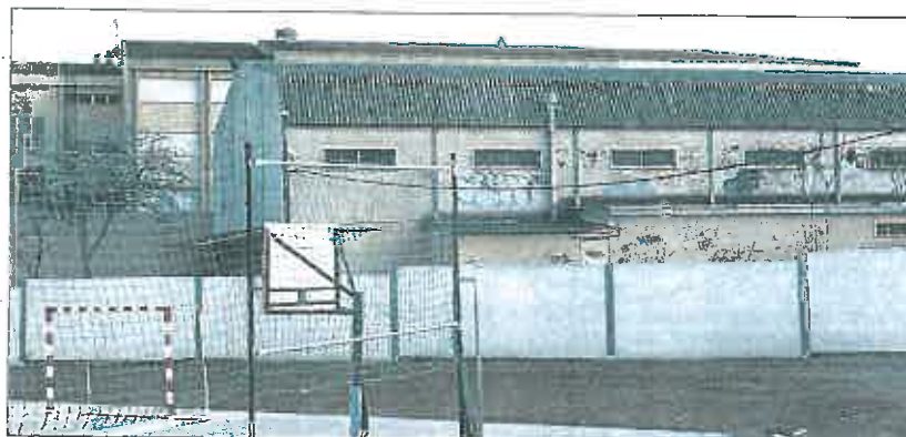
Instalaciones del Instituto Juan Sebastián Elcano, en la carretera de Tentagorra.