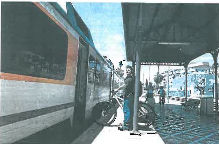
Un viajero sube con su bicicleta a un tren de Cercanías, en la estación de Murcia.