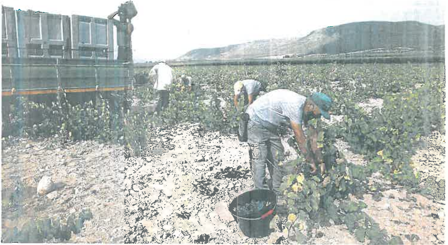
Un grupo de jornaleros trabaja en la vendimia de una de las viñas de Bodegas Juan Gil, en Jumilla, el pasado viernes. MARTÍNEZ BUESO