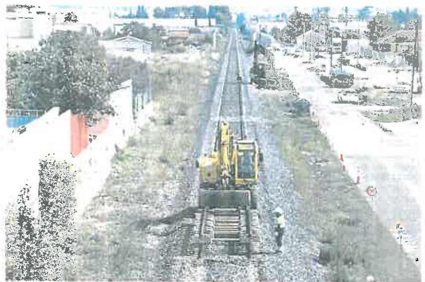
Una máquina desmonta la vía entre Noduermas y Sangonera, en la línea Murcia-Lorca-Aguilas. (MURCIA)

El tramo Noduermas Sangonera, adjudicado a una UTE, empezó a ser desmantelado el mismo viernes, informó la Plataforma Pro Sotera:amiento, coincidiendo