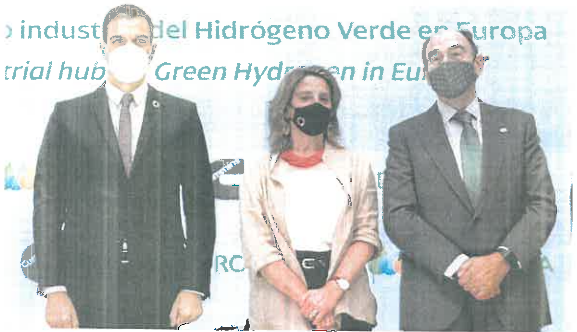
El jefe del Ejecutivo, Pedro Sánchez; la ministra Teresa Ribera y el presidente de Iberdrola, Ignacio Galán, el pasado mes de mayo.

El BOE publicó ayer la aplicación del fallo del Supremo que obliga al Estado a devolver dinero al sector por una ley de 2013