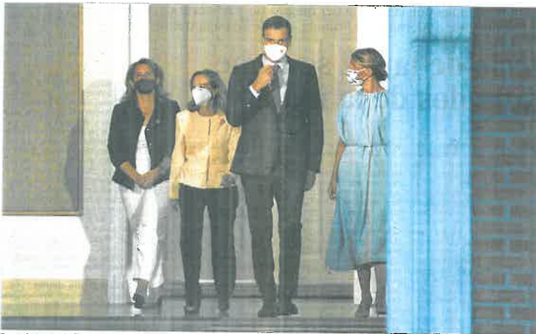
Desde la izquierda, Teresa Ribera, Nadia Calviño, Pedro Sánchez y Yolanda Díaz, el pasado julio en La Moncloa.

El Gobierno tiene ya comprometido el 41% de los 24.000 millones en fondos europeos previstos para este año