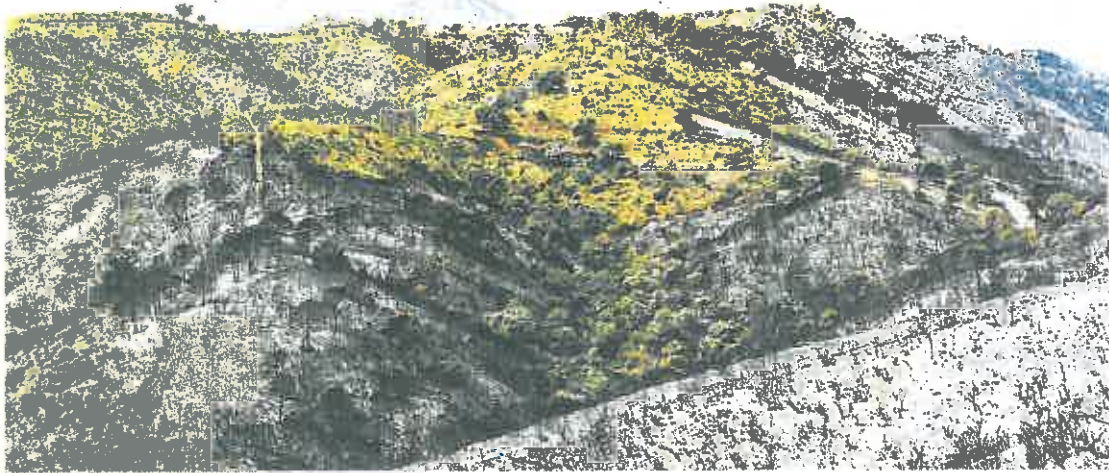
Parajes calcinados por el incendio en Sierra Bermeja.

► Este tipo de fuegos están vinculados al cambio climático y destacan por su virulencia y peligrosidad