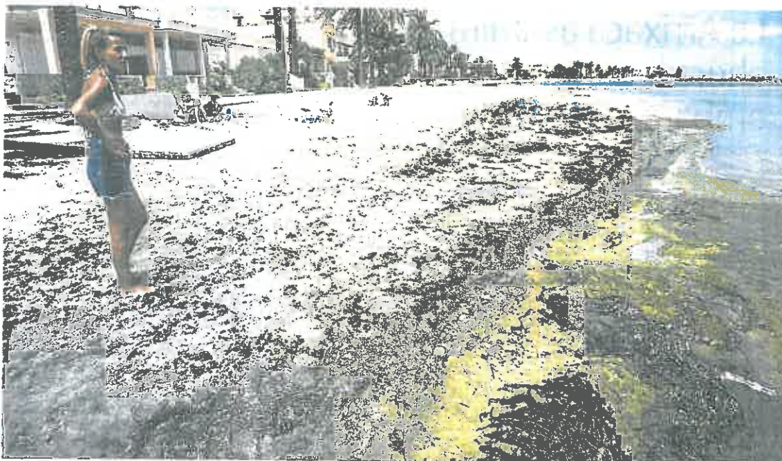
Una vecina contempla el Mar Menor desde la orilla de la playa de Los Urrutias llena de lodo seco, el pasado mes de julio.