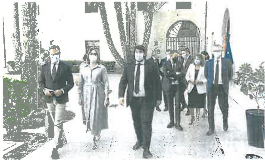
Los integrantes del Consejo de Gobierno, reunidos en San Esteban el pasado 22 de julio.