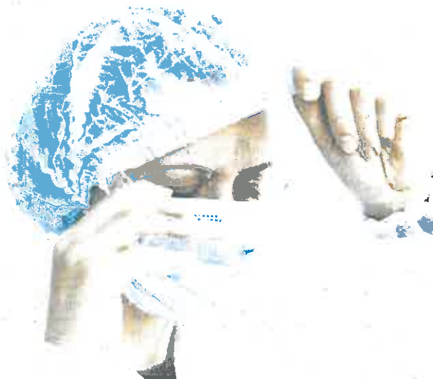
El reconocimiento de la baja por covid conlleva más protección ante posibles secuelas

391 trabajadores del sector sanitario fueron atacados en la Región durante el año 2020, según el SMS