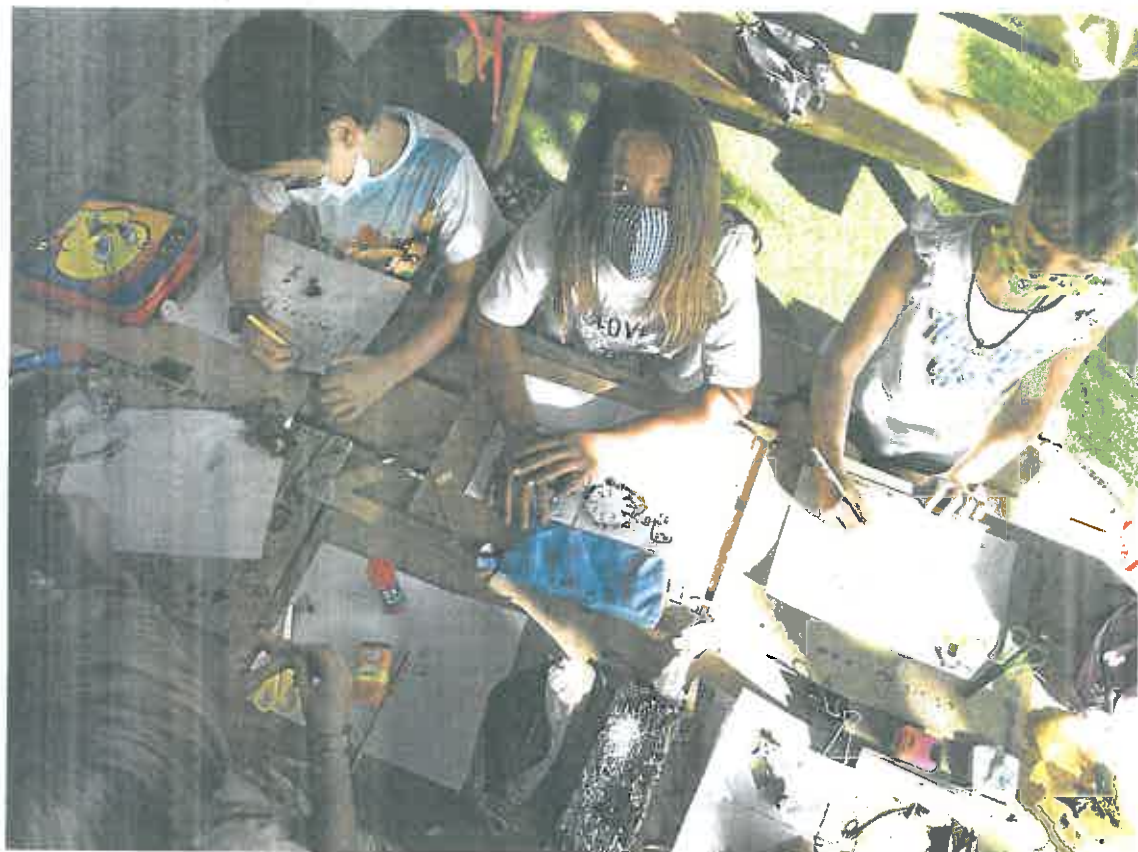
Alumnos del colegio Puente de Doñana, en la pedanía murciana de La Albatalla, ayer en clase en el patio del centro.

A la sombra de las moreras, los alumnos del colegio Puente de Doñana, en la pedanía murciana de La Albatalla, disfrutaron de buena parte de sus clases el curso pasado en el exterior del centro. Satisfechos con los resultados de la iniciativa, este año repite, pero han querido darle una vuelta de tuerca al programa y perfeccionarlo. El traslado de toda la actividad lectiva al aire libre buscaba minimizar el riesgo de contagio entre los escolares, que pasaron buena parte del año académico con sus pupitres y gradas en el patio. «Pero ya tenemos experiencia, y la aplicación será más pedagógica. Ahora sabemos que hay contenidos que conviene impartir en el aula, y otros se acomodan mejor al exterior», explica el director del colegio, que ya llevaba años inmerso en programas centrados en la educación en la naturaleza y está adherido a la comunidad nacional Escuela a Cielo Abierto. Los escolares, que viven motivados las horas de clase que pasan a la sombra de los pinos, un paraíso en su nuevo mundo de mascarillas, distancias de seguridad y juegos li-