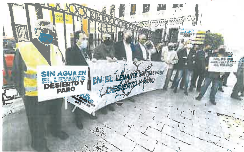
Protesta de los regantes en mayo frente a Delegación del Gobierno

Rechazo al envío de 12 hm 3 : «La ministra desoye la propuesta de sus propios técnicos», lamenta el Scrats