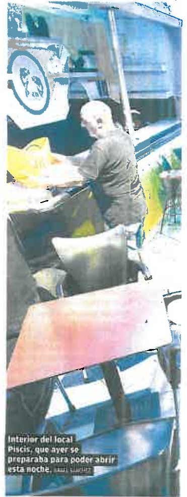
Interior del local Pisco, que ayer se preparaba para poder abrir esta noche.

Sobre la subida de las tarifas eléctricas opinó que es «un escándalo. Me alegro de que el Consejo de Ministros empiece a darse cuenta», aunque señaló que «poner en marcha una freidora para freír unas croquetas o poner el secador de una peluquería vale el doble que el año pasado». Añadió que también lastra los costes energéticos de las empresas agrarias, que representan el 40%.