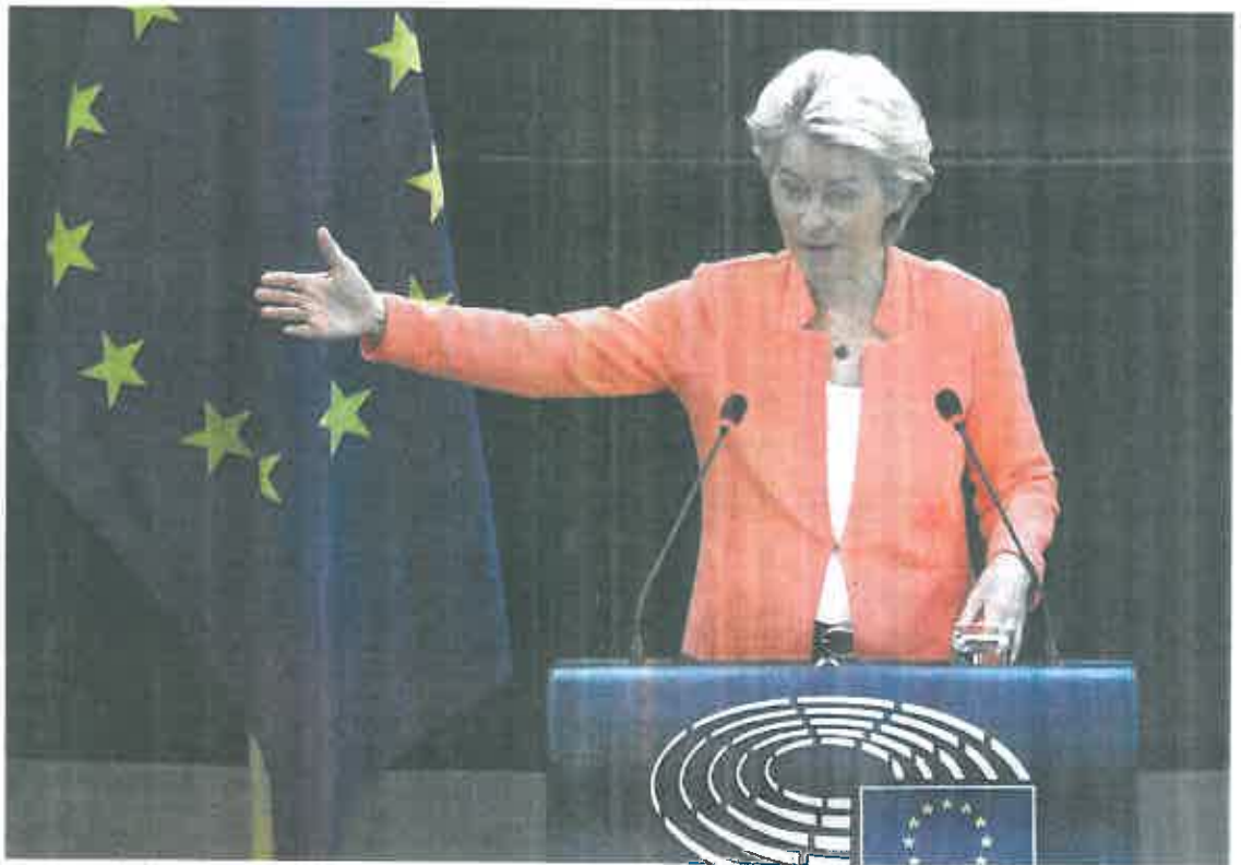
La presidenta de la Comisión Europea, Ursula von der Leyen, durante el discurso sobre el estado de la UE, ayer en Estrasburgo.

Probablemente, el anuncio más novedoso de su discurso es la intención de crear un 'Erasmus laboral' para reactivar el empleo joven en el continente. La iniciativa, denominada ALMA, sigue la