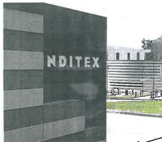
Sede de Inditex en Arteixo, en La Coruña, s. c.

Asimismo, los resultados más recientes invitan a ser optimistas sobre el segundo semestre. Entre el 1 de agosto y el 9 de septiembre las ventas del grupo crecieron un 22% respecto al año pasado y un 9% frente a 2019. Prácticamente la totalidad de sus tiendas están abiertas, por lo que las ventas en ellas están volviendo a la normalidad.