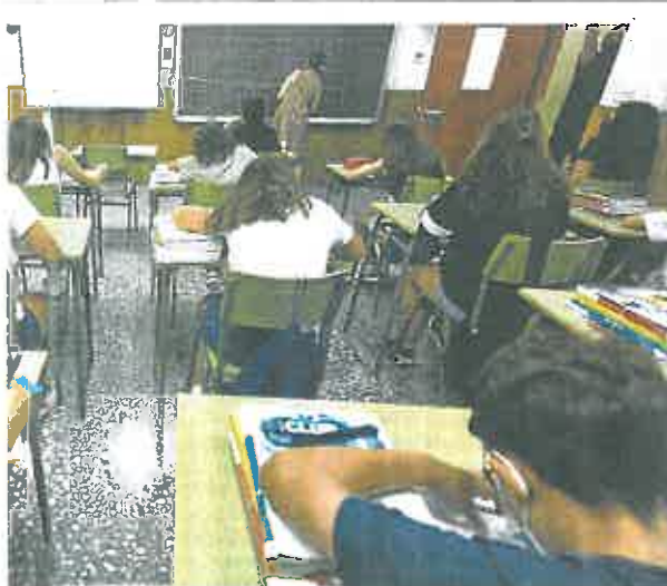
IES Alfonso X El Sabio, ayer, en su primer día de clase.

La tasa de positividad se sitúa en torno al 3,7%, mientras que la incidencia acumulada es del 100,7 por cada 100.000 habitantes en los últimos 14 días y del 39,3 por cada 100.000 habitantes en los últimos siete días. Salud realizó durante la última jornada en la que hay datos 2.390 pruebas para la detección del SARS-CoV2, entre PCR y antígenos.