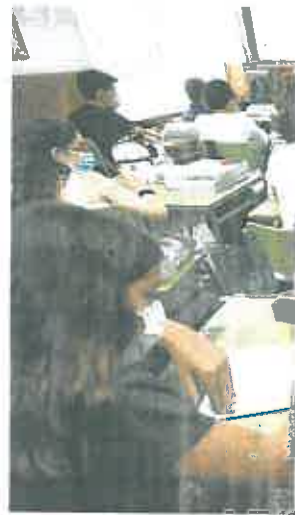
Alumnos de Secundaria en un aula de

El sindicato ha realizado visitas a varios centros y denuncia que «no se cumple en muchos centros porque las ratas siguen siendo las mismas, y físicamente no caben los pupitres de 25 y 30 alumnos en un aula». Los profesores que aún no se han incorporado a las aulas porque cubren vacantes que fueron asignadas ayer lo harán, aseguraron desde la Consejería de Educación, entre hoy y mañana. Los alumnos de ESO y Bachillerato recuperan este año la presencialidad plena, con clases en el aula todos los días, después de año y medio con restricciones.