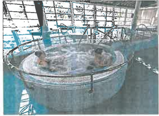
Clients in the balneario de Archena.

de octubre, noviembre y diciembre. En principio, el programa de Termalismo está ofertado para 58.000 pensionistas, aunque hasta la fecha solo 11.000 lo han pedido. Para el sector, "la situación es especialmente preocupante, puesto que, como el resto del sector turístico, los balnearios han sido uno de los más castigados económicamente por la pandemia". Asimismo, subrayan el impacto que puede tener en sus más de 7.000 empleados, muchos de ellos en ERTE, y en las comarcas de la España rural en las que están ubicados los 110 balnearios. Además, los establecimientos afirman que han reservado ya sus habitaciones para los beneficiarios del programa, lo que les deja sin posibilidad de ofrecérselas a otros clientes durante el periodo contemplado, ya que, "en respuesta a la invitación rea-