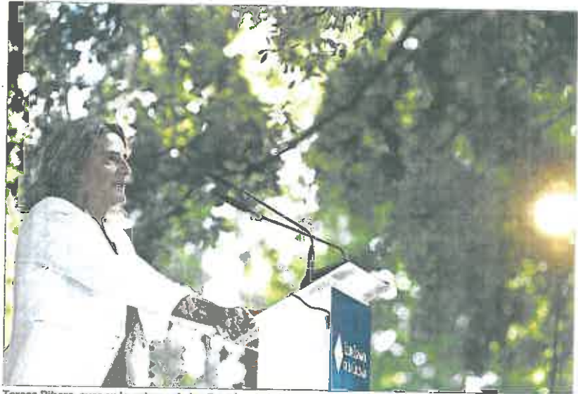
Teresa Ribera, ayer en la entrega de los Premios de la Energía que organiza Enerclub, en Madrid.

"Creemos que si las reglas del juego se establecen en las leyes europeas, los remedios también deberían hacerlo. La Comisión debe apuntar a aumentar la certeza a los consumidores, los titulares y los Gobiernos por igual, con el diseño de un conjunto flexible de pautas con las que proporcione diferentes opcio-