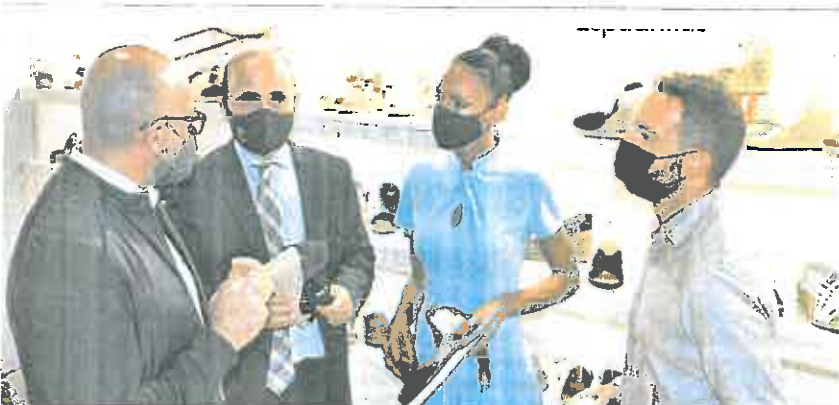
La consejera de Empresa, junto al director del Info (2i), en un expositor en la feria del calzado de Milán, ayer. CARM

bajadores, además de no incluir «ningún gesto de preocupación o ayuda», sin citar otros apoyos públicos y facilidades dadas a los empresarios. Tampoco faltó la crítica a la Administración autonómica por su «política de dejar hacer» ante la realidad que se arrastra de una «enorme pérdida de poder adquisitivo». Y es que «el salario de 850 euros de un camarero es 115 euros menos que el vigente SMI».