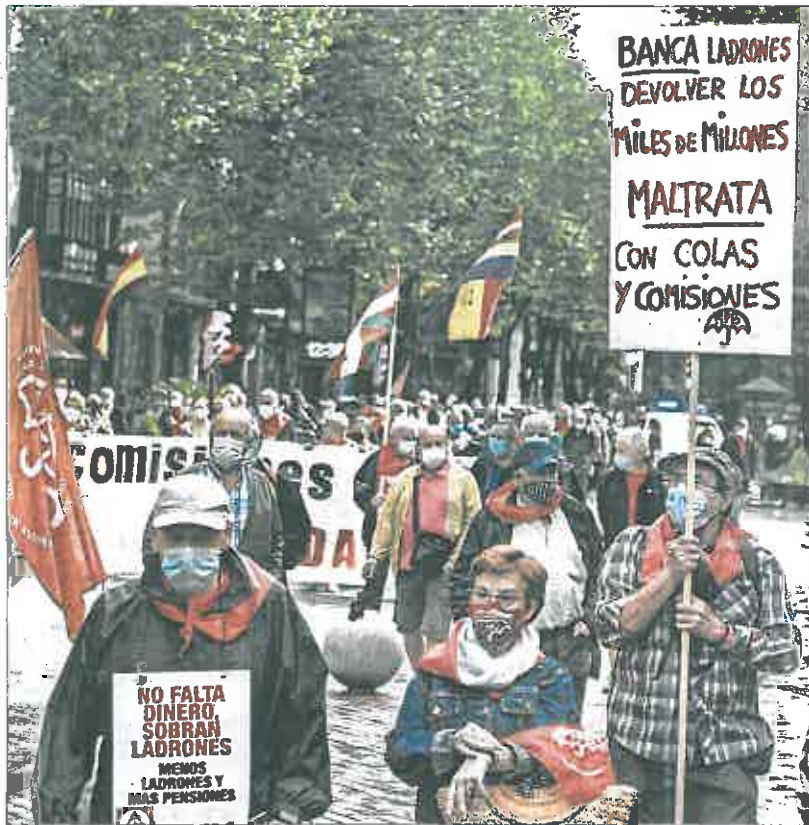
Manifestación de pensionistas ayer en Bilbao.

En todo caso, con estas inyecciones se pretende reforzar el sistema y ganar margen para poder hacer frente a la jubilación del baby boom.