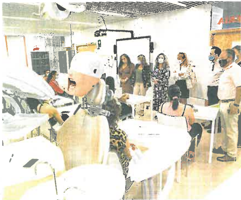
Una de las aulas del Centro Integrado de FP de Lorca, ayer, en el inicio del curso.