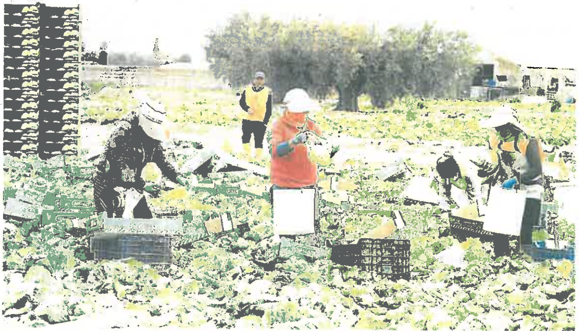
Trabajadores del campo recogen las lechugas en cajas en los meses de invierno.