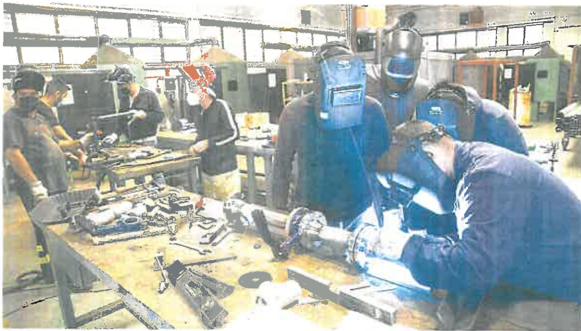
Varios alumnos, durante una clase del curso de fabricación y montaje de tuberías dirigido a desempleados.