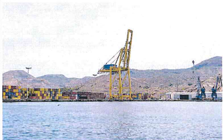
El Puerto de Cartagena está a la cola, solo por detrás de Ceuta, en descargas de pescado fresco. IVÁN UROQUIZAR

Migúlez destacó que «es imprescindible un análisis económico de las repercusiones de estas medidas, algo de lo que carece este plan que nos imponen a golpe de decreto». Mientras tanto, «desde el Gobierno regional continuamos apostando por medidas realistas y por buscar alternativas para reducir el elevado precio de la electricidad, con energías como la térmica y la nuclear, que ayudarían en el proceso de transito al pleno uso de las renovables».