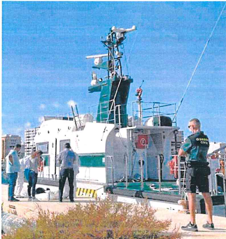
Un equipo de salvamento de la Guardia Civil, con uno de los cadáveres encontrados.

Los primeros hallazgos se produjeron el domingo, cuando agentes de la Policía Local y de la Guardia Civil, junto con efectivos de Salvamento Marítimo y socorristas del 112, rescataron los cuerpos sin vida de dos hombres y