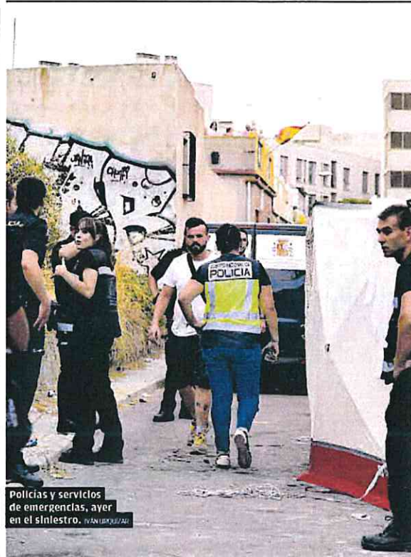
Policías y servicios de emergencias, ayer en el siniestro.

Al comienzo del mes de agosto, desde el Sindicato Médico pedían al Servicio Murciano de Salud (SMS) la presencia de guardias de seguridad en todos los centros de salud, tal y como adelantó La Opinión. Los facultativos consideraban que sería una medida que evitaría los episodios violentos. Las agresiones aumentaron en la Región un 25% el pasado año, una cifra que los representantes de los médicos consideran «alarmante».