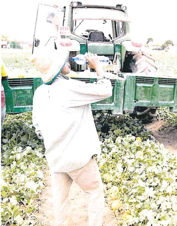
Un trabajador del Campo de Cartagena bebe agua durante su jornada laboral.