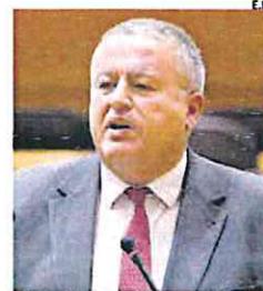
El senador Francisco Bernabé.

Bernabé ha lamentado que «la permanente mentira del PSOE»