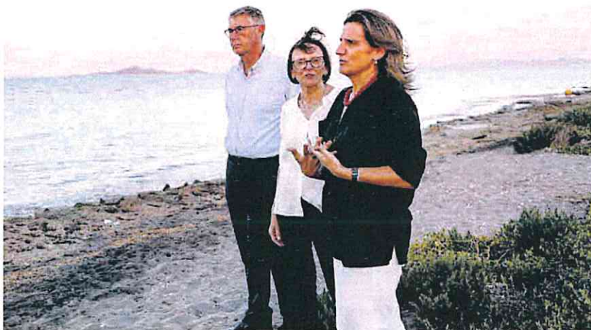
durante su última visita al Mar Menor, el pasado julio.