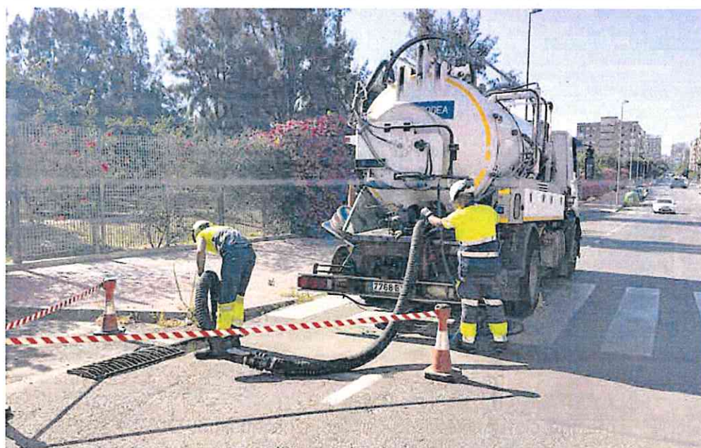
Operarios de Hidrogea revisan y limpian los imbornales de Cartagena para que drene el agua en caso de lluvias torrenciales.

El Ayuntamiento de Murcia también se ha dirigido a la CHS (Confederación Hidrográfica del Segura) para solicitarle el mantenimiento de determinadas zonas que son de su competencia, como es el cauce del río en el tramo no urbano y las ramblas. La propia CHS informaba hace unos días a La Opinión de que está previsto que esta misma semana se desplacen las máquinas a la zona del Reguerón, concretamente al tramo que hay entre las pedanías de La Alberca y Santo Ángel.