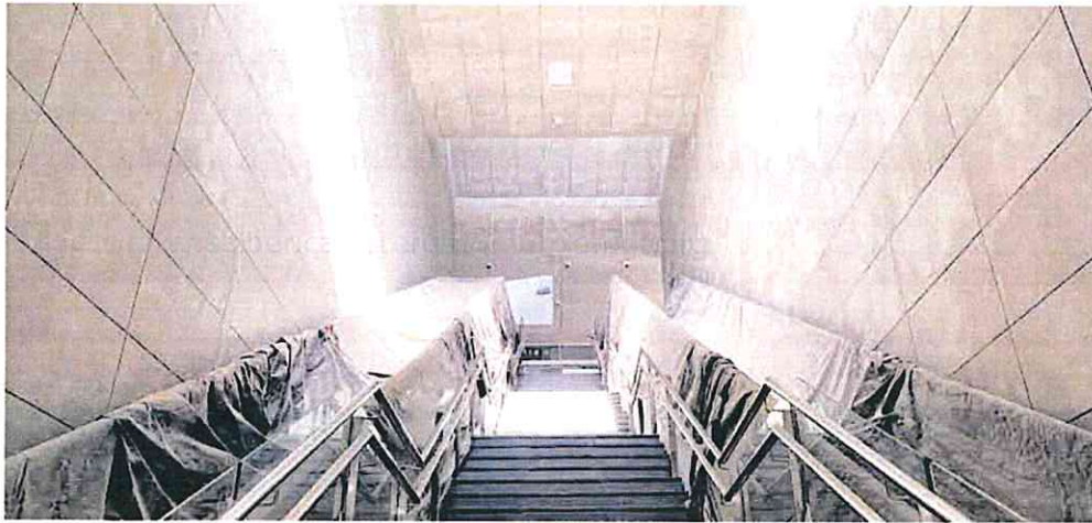
Escaleras que darán acceso a la futura estación soterrada del AVE en El Carmen.