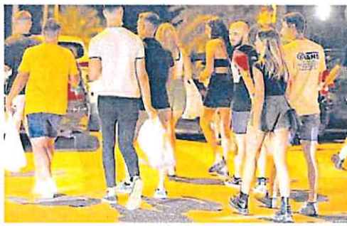
Jóvenes en un botellón de Cabo de Palos.

Asimismo recordó que hay quejas de las asociaciones de vecinos, veraneantes, visitantes, comerciantes y hosteleros «durante todo el verano» ante las que la alcaldesa de Cartagena, Noelia Arroyo, «continúa sin arbitrar medidas de control y prevención de este tipo de concentraciones cada vez más masivas», por lo que acusó al equipo de gobierno municipal de incumplir «sistemáticamente y de manera continuada» la normativa vigente