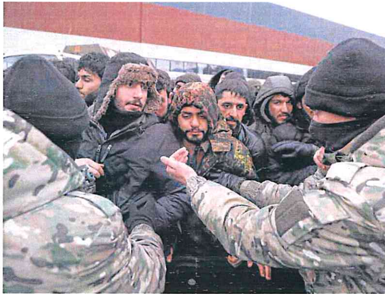
Migrantes retenidos por las fuerzas de seguridad en la frontera entre Polonia y Bielorrusia.

El organismo, además, alerta de que la presión es «muy alta» en el Mediterráneo occidental,