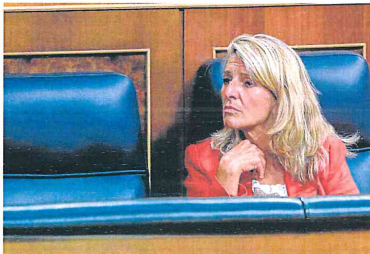
La vicepresidenta segunda y ministra de Trabajo, Yolanda Díaz, este pasado jueves.

En este sentido, consideró que este nuevo impuesto temporal (para 2022 y 2023) establece con «arbitrariedad» estas nuevas imposiciones «a dedo» y sienta dos precedentes «muy preocupantes», que permitirían a cualquier mayoría de gobierno «asignar a dedo a sectores específicos cargas o exacciones de cuantía muy significativa».