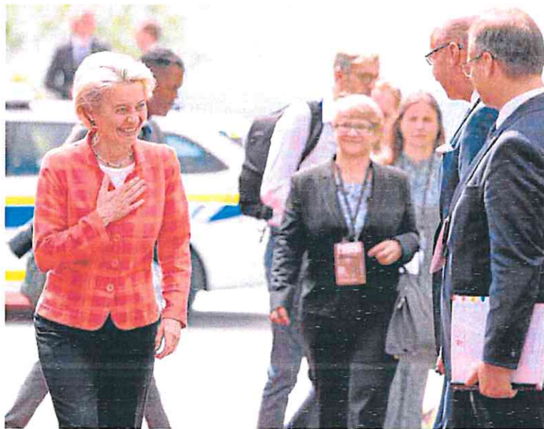
La presidenta de la Comisión Europea, Ursula von der Leyen, ayer en Eslovenia.

Solo cuando arrecia el temporal, Europa es capaz de mover sus rudas estructuras para atajar un problema de dimensiones millonarias para empresas y consumidores. Lo hizo hace una década, cuando el euro estuvo a punto de caer; y también con la pandemia, ante el vértigo de convertirse en el territorio más afectado por la propagación del virus. Ahora, la presidenta del Ejecutivo comunitario, Ursula von der Leyen, ha recordado lo que buena parte de los países, incluido España, vienen insistiendo desde que Rusia inició la invasión de Ucrania: que el actual sistema de formación de precios horarios y diarios «fue desarrollado para di-