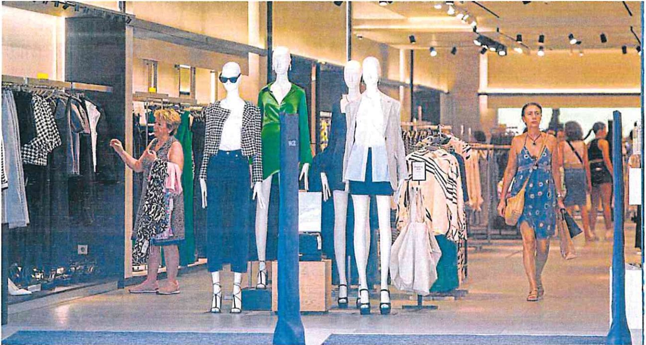
Una tienda de ropa del centro de Murcia, ayer a mediodía, sin puertas de cierre automáticas como prevé la normativa del Gobierno central.