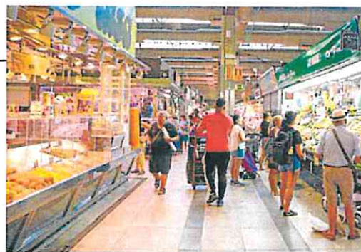
Vecinos haciendo la compra en un mercado de Madrid.

Por sectores, las ventas de alimentos cayeron un 3,3% en julio en comparación con hace un