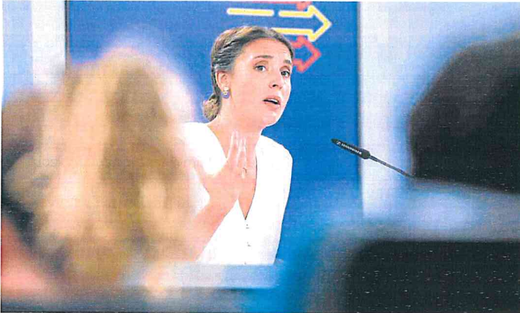
Irene Montero explica, ayer, en la rueda de prensa tras el Consejo de Ministros, los detalles del proyecto de nueva ley del aborto.