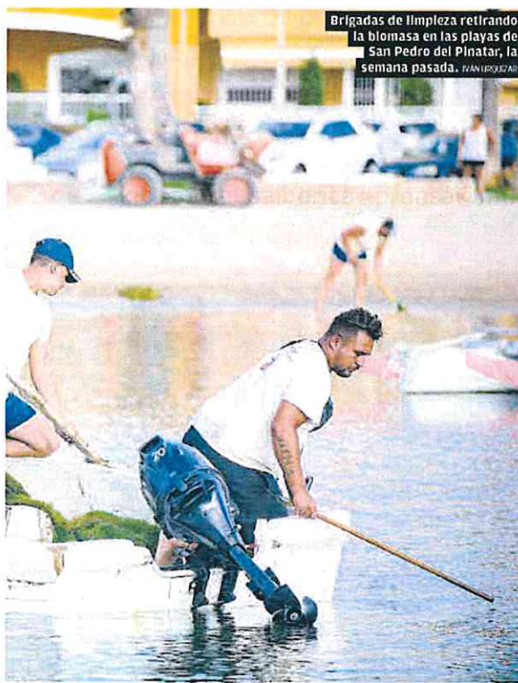
Brigadas de limpieza retirando la biomasa en las playas de San Pedro del Pinatar, la semana pasada. IVAN RODRIGUEZ