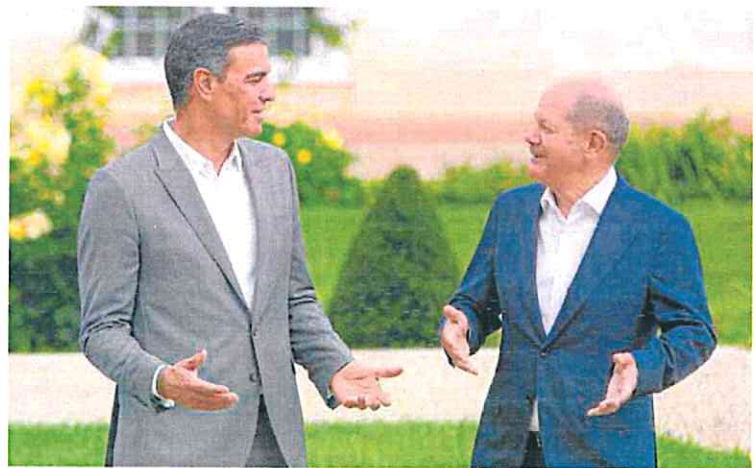
El presidente del Gobierno, Pedro Sánchez, y el canciller alemán, Olaf Scholz, ayer en Berlín.

Pero, ¿qué relación tiene el precio del gas con la luz? Cada día más en toda Europa. En el caso de España, el 42% de la producción eléctrica procede de los ciclo combinado, que usan gas para generar luz. Se trata de un porcentaje muy elevado y muy poco habitual ante la escasa producción renovable en estas jornadas.