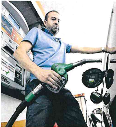
Un conductor reposta en una gasolinera.