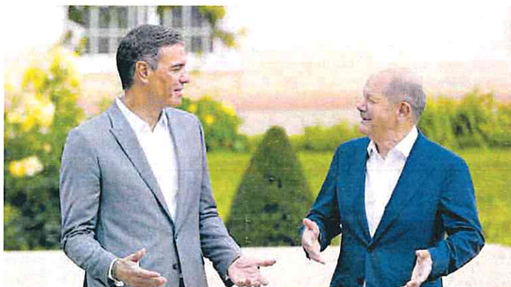
El presidente del Gobierno, Pedro Sánchez, y el canciller alemán Olaf Scholz.

«Desde el momento en que el presidente del Gobierno español y el canciller alemán lo piden, desde que los amigos lo piden, examinamos la demanda de nuestros amigos, de nuestros socios», señaló. «España y Alemania —reiteró Le Maire— son socios muy próximos de Francia». Así se expresó después de que Sánchez y