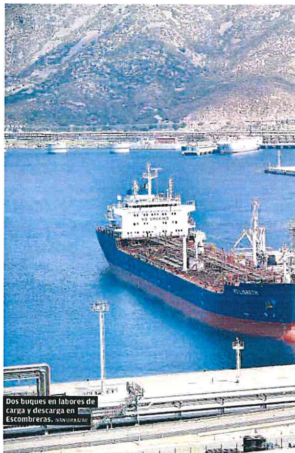
Dos buques en labores de carga y descarga en Escombreras. WAN ORAZO

En julio, el tráfico de graneles líquidos en el Puerto de Cartagena ha mantenido el tipo, puesto que se situó en 2.587.783 toneladas, de un total de 3.095.556 toneladas, frente a las 1.818.647 (de un total de 2.348.361) que hubo en 2021, según datos facilitados por Puertos del Estado. La cantidad de este tipo de mercancía que ha pasado por la ciudad portuaria de enero a julio es de 16.964.337 toneladas (de un total de 21.501.646 toneladas), frente a las 13.873.779 (de un total de 17.913.676 toneladas) del año anterior, un 22,28% más.