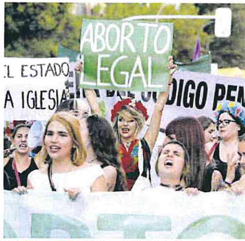
Manifestación en el Día de Despenalización del Aborto.

En el anteproyecto inicial aprobado en mayo, que no mencionaba el término violencia obstétrica porque genera rechazo en algunos sectores médicos aunque otros se abren a su utilización para atajar las malas prácticas, exceptuaba la petición de consentimiento informado en los casos en los que «la vida de la madre o el bebé esté en riesgo». Pero se ha eliminado esta excepción «en coherencia con la ley de autonomía del paciente» y porque «ha sido una cuestión observada por entidades sociales y mejora el texto respetando aún más la voluntad de la mujer», según explican fuentes del Ministerio dirigido por Irene Montero.