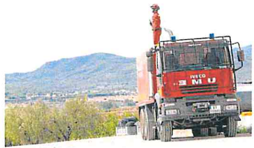
Un camión de la UME, en un incendio en Bullas en 2020.

Al parecer, los datos que debía recibir la Dirección General de Protección Civil del Ministerio de Interior por parte de la Dirección de Emergencias de la Comunidad Autónoma «eran erróneos» en un primer momento, según fuentes del Ministerio. Un documento en el que se incluye información relativa a las hectáreas afectadas, la dirección del viento o la previsión meteorológica, y con el que se justifica – o no – la intervención de la UME, «que es un medio extraordinario de último recurso cuando se dan las circunstancias oportunas», recuerdan las