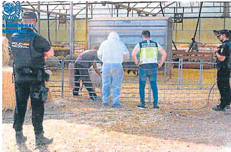
La Policía examina las instalaciones de una de las fincas ganaderas implicadas en la operación.

Los detenidos han sido puestos a disposición del juzgado en funciones de guardia, el cual decretó su puesta en libertad a la espera de la celebración del juicio oral.