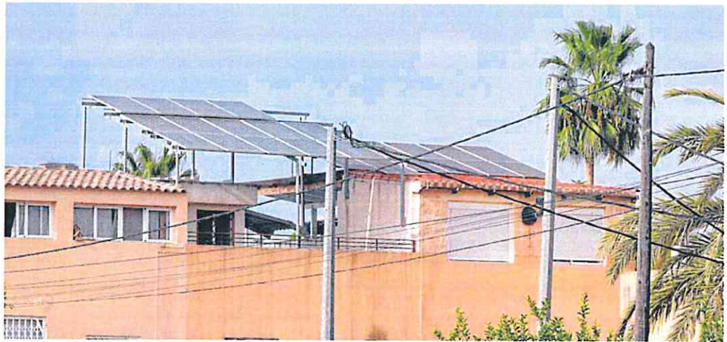
Placas solares en el tejado de un edificio situado en la pedanía murciana de Aljucer.