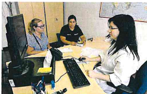
Consulta médica en un centro de salud de Castellón.

La Federación de Asociaciones en Defensa de la Sanidad Pública (FADSP) aplaude la respuesta del Defensor, pero le exige una mayor celeridad porque «urge una Atención Primaria de calidad, accesible y para toda la población».