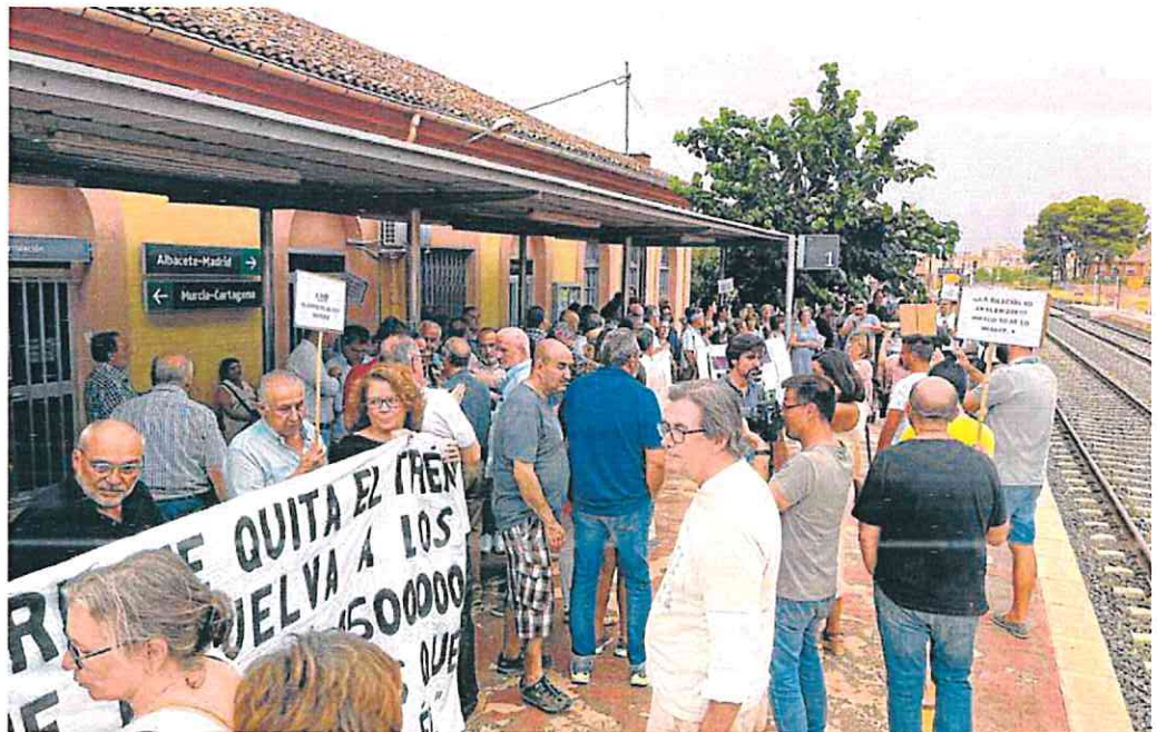
Vecinos de Hellín, Cieza y Murcia protestaron ayer por la tarde en la estación de la ciudad castellanomanchega. CLAUDIO CABALLERO

«Hemos solicitado la comparecencia de la ministra para que aclare, además, la preocupante situación actual del estado de ejecución de las obras del AVE en la Región de Murcia», señaló Méndez. Asimismo, han pedido a Sánchez una explicación sobre el plan alternativo de autobuses con Albacete.