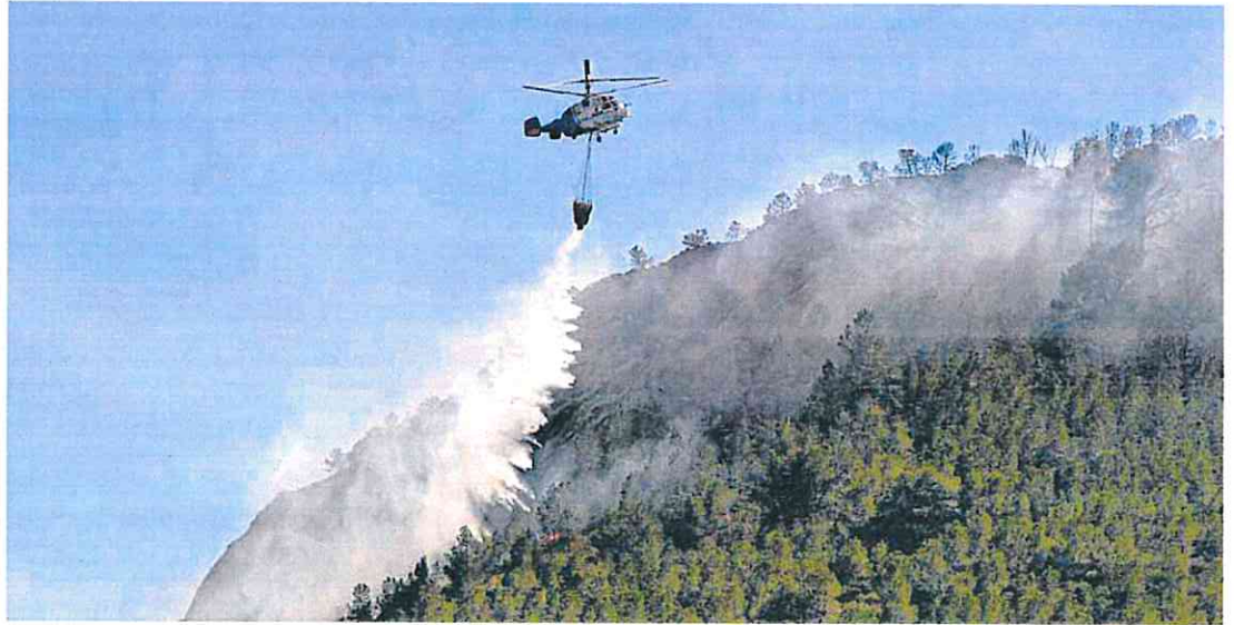
El helicóptero Kamov asignado hasta ahora a la base de La Alberquilla realiza una descarga en un incendio declarado en el Puerto del Garruchal, en el año

reducido este año a cinco. Los otros tres necesitaban piezas de recambio que no van a ser suministradas por Rusia (país fabricante de la aeronave) como consecuencia de las sanciones derivadas de la invasión de Ucrania. Esto ha motivado una «reorganización de me-