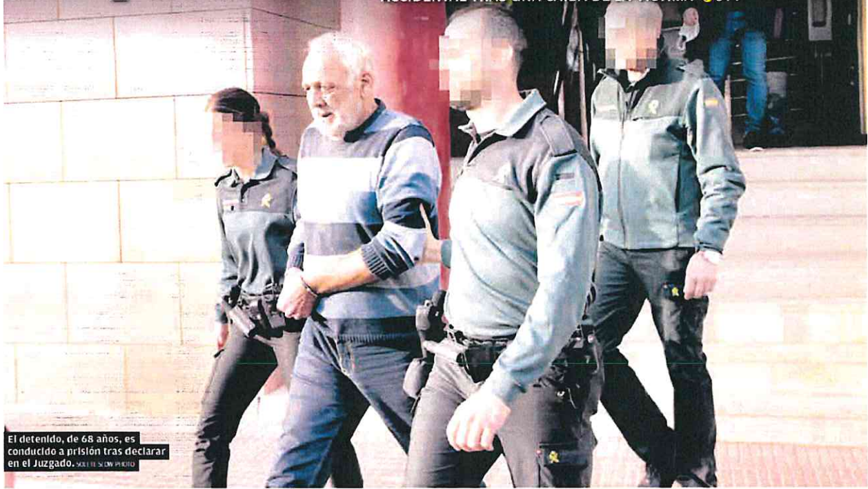
El detenido, de 68 años, es conducido a prisión tras declarar en el Juzgado.

DETIENEN EN MAZARRÓN A UN BRITÁNICO CON ANTECEDENTES POR VIOLENCIA DE GÉNERO ACUSADO DE MATAR A SU PAREJA , AUNQUE ÉL ALEGA ANTE EL JUEZ QUE FUE UNA MUERTE ACCIDENTAL TRAS UNA CAÍDA DE LA VÍCTIMA 8 y 9