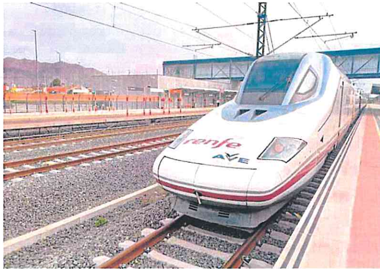
Uno de los trenes AVE, durante las pruebas realizadas entre Beniel y Murcia.

El horario de los trenes directos está todavía por definir. Se baraja uno en torno a las 6.30 horas y otro cerca de las 14 horas. Pero en lo que respecta a los indirectos, este diario ha podido saber que habrá uno que partirá de la Estación del Carmen a las 11.50 horas, con previsión de llegar a Orihuela-Miguel Hernández a las 12.06; a las 12.20, a Elche; a las 12.41, a Alicante; y, a las 15.18 horas, a Madrid. Por la tarde, está previsto que salga un AVE de Murcia a las 19.30 horas, con las mis-