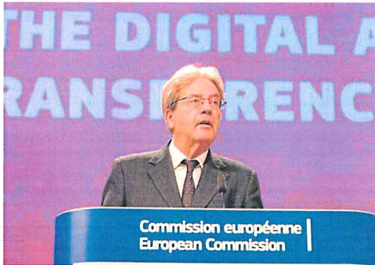
El comisario europeo de Economía, Paolo Gentiloni, ayer, en rueda de prensa.

La ministra aseguró que lleva meses detrás de medidas para hacer frente a los precios de los productos básicos que «están imposibles». En este sentido, apuntó que «es curioso que el pequeño comercio sea el que esté tomando cartas en el asunto», mientras las grandes distribuidoras «ven aumentar sus beneficios». Destacó que Unidas Podemos tratará de lograr cestas asequibles «de productos variados y de calidad» y otras adaptadas para las familias con personas celiacas. «Junto al precio del alquiler y las hipotecas, el coste de la cesta de la compra es uno de los grandes problemas de este país», apuntó.