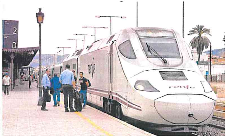
Un tren híbrido de la clase Alvia, en la estación de Murcia en marzo de 2019.

A vuela pluma, se podría decir que para este viaje no hacían falta tantas alforjas. Si se compara el híbrido de Camarillas con el próximo AVE por Alicante, no se sale ganando con el desplazamiento. Otra cosa son los AVE directos con Madrid, que tardarán unas dos horas y media (desde Orihuela son 2 horas y 24 minutos). Aunque tampoco será para tirar cohetes. Un factor que se olvida a menudo es que se mejorarán considerablemente los servicios de Cercanías entre Murcia y Alicante –que tienen una demanda muy superior a los viajes con Madrid–, a la vez que se abre el abanico para viajar a Valencia, Barcelona y la frontera francesa. O sea, este tramo debía construirse, sí o sí, como prolonga-