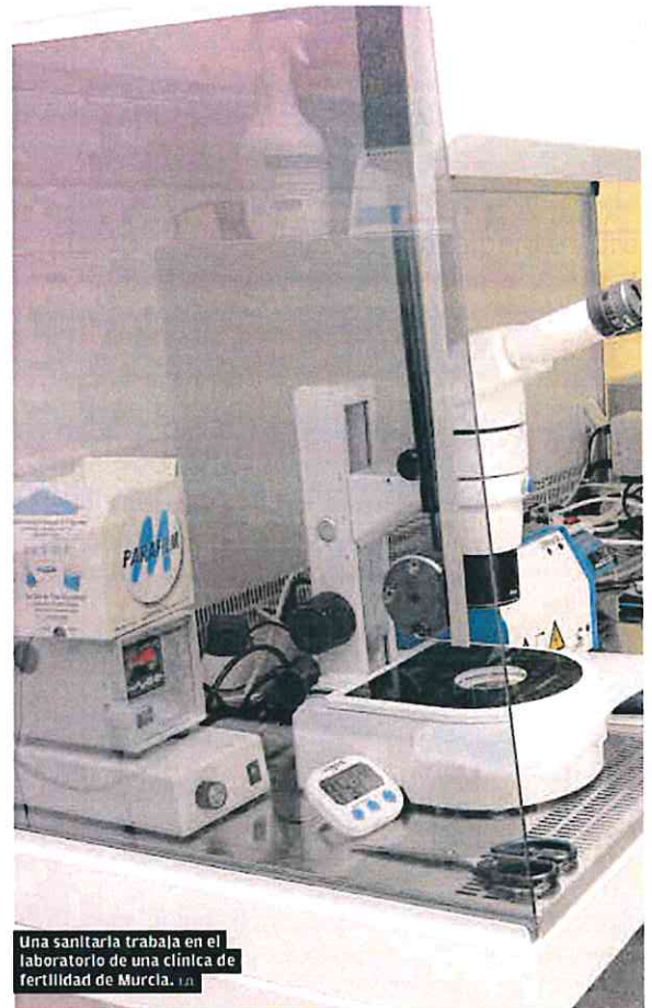
Una sanitaría trabaja en el laboratorio de una clínica de fertilidad de Murcia. (1)

Este profesional reconoce que en la Región de Murcia, a diferencia de otras comunidades, «es complicado conseguir donantes de óvulos», algo que relaciona con el hecho de que «en Murcia hay un buen nivel de vida y las donaciones son más habituales en aquellas autonomías con una menor renta per cápita». Aunque no ve correcto que «en muchas ocasiones se hable del negocio de la