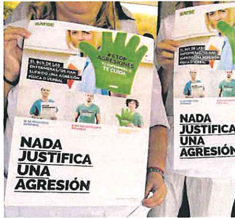
Concentración de Satse contra las agresiones.

Satse se ha dirigido por carta a los principales partidos con representación en el Congreso para recordarles que, desde su publicación en