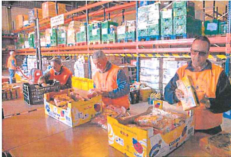
Tres voluntarios del Banco de Alimentos trabajan en la preparación de un reparto.

Tanta es la confianza en la empatía de la sociedad, empresas e instituciones cartageneras, que espera conseguir en las tres semanas que restan hasta fin del año 5.000 kilos más de alimentos. «Si algo nos ha demostrado la pandemia es que cualquiera puede verse en una situación de vulnerabilidad. Proporcionar los recursos necesarios para salir adelante puede evitar que esa persona o familia completa pasen de una circunstancia pasajera a entrar en la exclusión social», dijo el presidente del Banco de Alimentos de la Región de