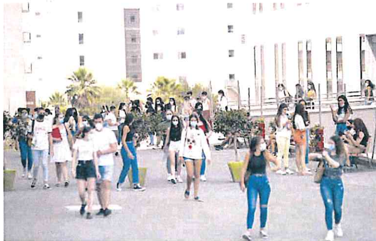
Alumnos a la salida del campus de Ciencias de la Salud de El Palmar (Murcia).

Murcia se queda a seis puntos de la media nacional y a 17 puntos del primero de la lista: la provincia de Guipúzcoa con casi el 43% de los mayores de 16 años con estudios superiores. Por otro lado, la Región sólo está a 3,4 puntos del último en la lista: Cuenca. Por encima se quedan territorios sin universidades propias como Alava, Soria, Guadalajara, Huesca, Palencia, Pontevedra, Lugo, Teruel o Melilla, cuya formación en grados o posgrados depende de una universidad matriz ubicada en una provincia cercana. La Región tiene tres: la Universidad de Murcia, la Universidad Politécnica de Cartagena y la Universidad Católica de Murcia. Además, tiene sede oficial de la Universi-