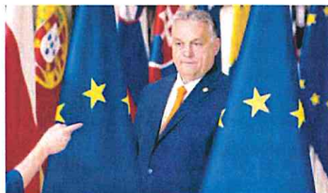
El primer ministro húngaro, Viktor Orbán.

Todas estas cuestiones requieren de decisiones unánimes. Orbán ha decidido vincular el visto bueno a las mismas con la propuesta de Bruselas de congelar los fondos estructurales asignados a su país por la deriva del Estado de derecho. «Eso que hay y tenemos que lidiar con ello», admiten las