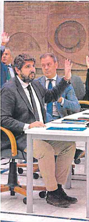
SÁNCHEZ / AGM