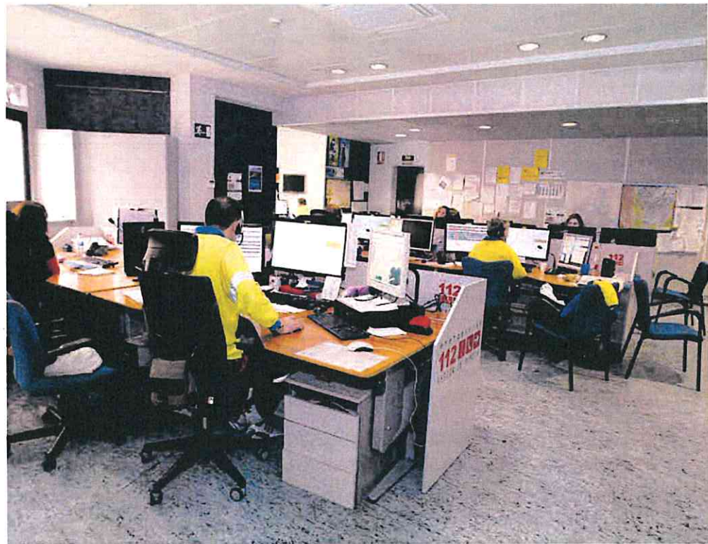
Vista de las instalaciones del Centro de Coordinación de Emergencias, en la avenida Mariano Rojas de la capital murciana.

«Te recomendamos que tengas activada siempre la posición GPS de tu teléfono móvil para poder enviar tu posición en caso de emergencia», aconsejan.