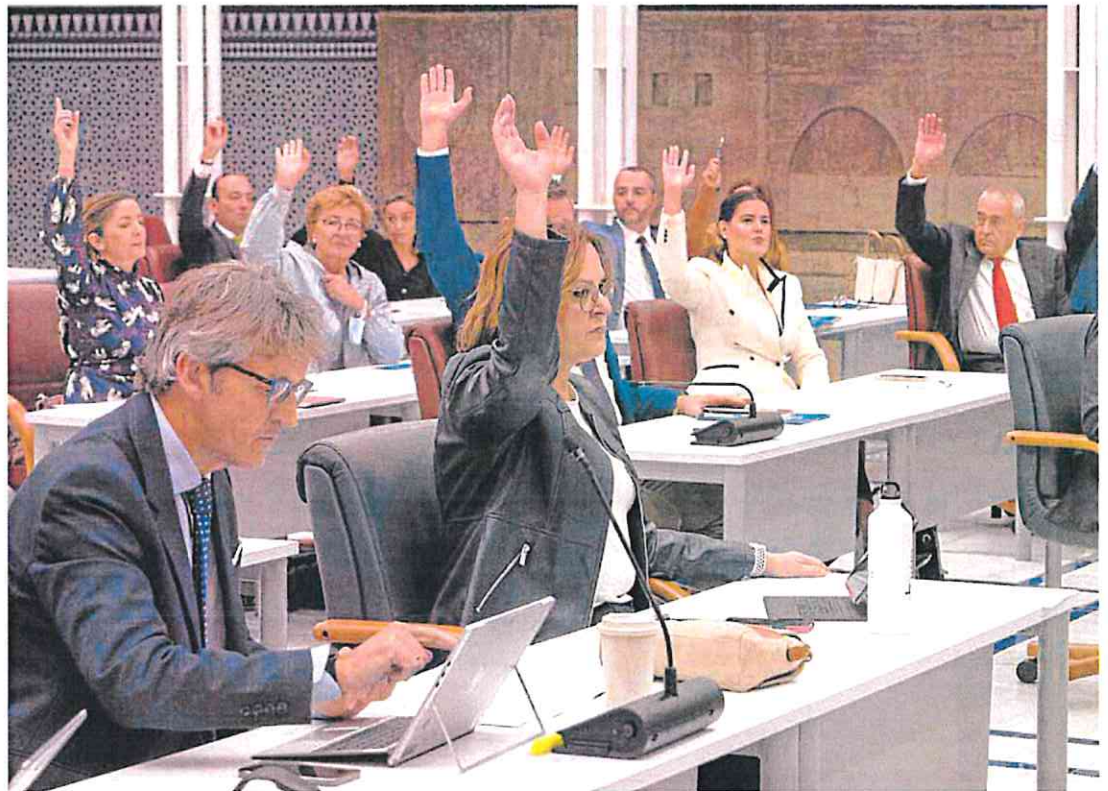
Votación en la Asamblea Regional del techo de gasto para 2023, el pasado 11 de noviembre, con los miembros del Gobierno regional en primera fila. PABLO

Esta última, la ley de Emergencias y Protección Civil, está a la espera de su tramitación en la Asamblea Regional desde que se presentó en ella el pasado mes de julio, y no parece que vaya a