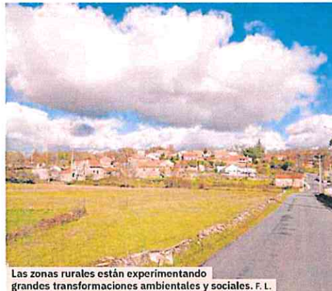
Las zonas rurales están experimentando grandes transformaciones ambientales y sociales. F. L.

La superposición de los mapas sobre la prevalencia de la despoblación en España con los mapas