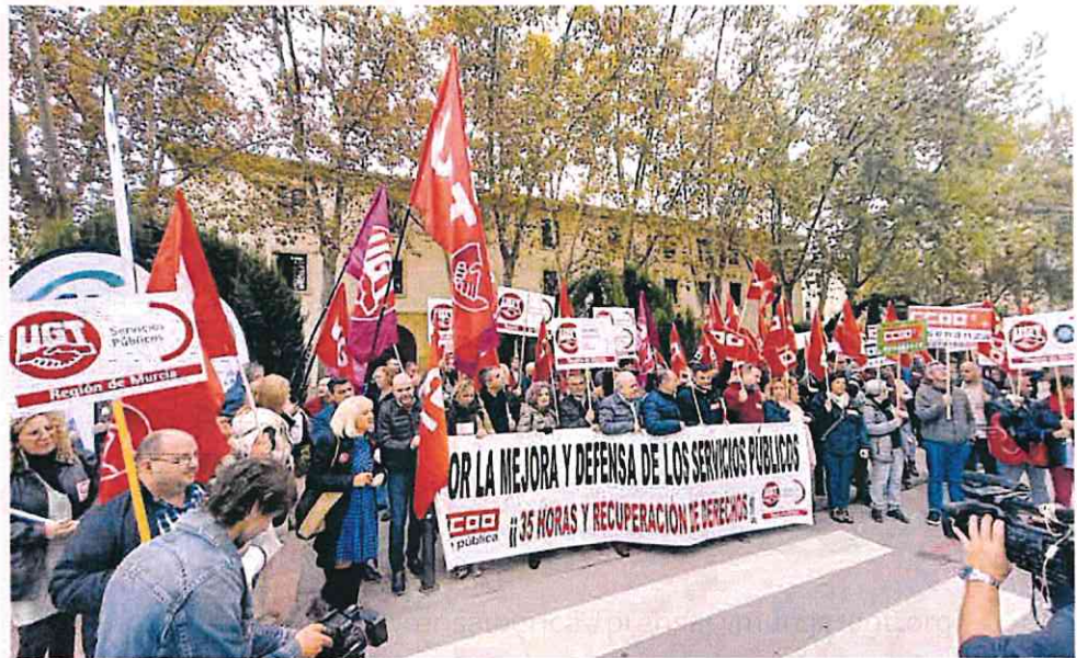
Protesta de los representantes de los funcionarios ante San Esteban.