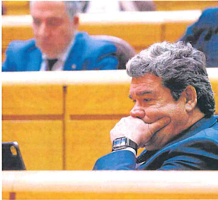
El ministro de Seguridad Social, José Luis Escrivá, muy pensativo ayer en el Senado.

Tampoco hubo ningún avance en la otra iniciativa que genera una fuerte controversia: la subida extra del 30% de las cotizaciones máximas desde 2025 hasta 2050, acompañada de un alza muy inferior en las pensiones máximas en ese período, de apenas un 3% en términos reales. La nueva propuesta que se presentó este lunes a sindicatos y patronal mantiene intactas estas dos medidas polémicas aunque quedan poco más de 15 días para que tengan que estar aprobadas, por lo que UGT y CC OO advierten que el «tiempo se acaba» y el Ejecutivo no da los pasos necesarios. «El