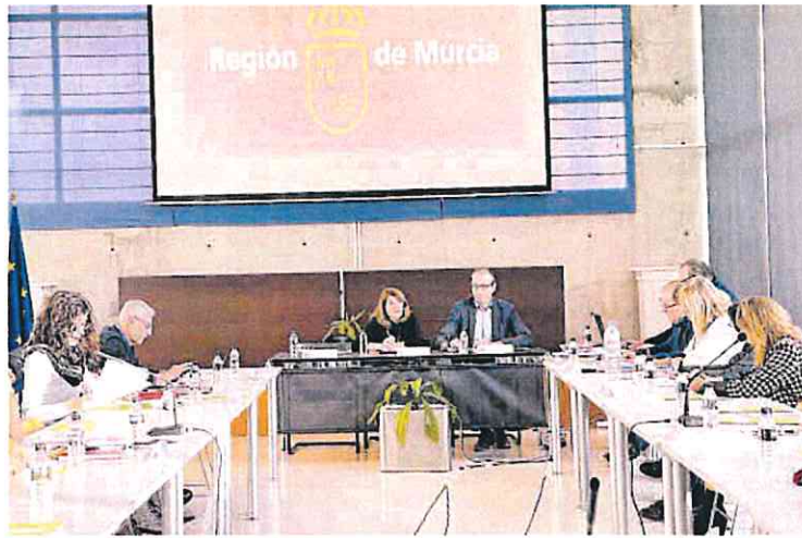
Mesa Sectorial de Educación celebrada este lunes con los sindicatos.

Respecto al concurso de méritos que se está celebrando estos días y hasta el 21 de diciembre, los docentes podrán optar a una de las 134 plazas destinadas al cuerpo de maestros, 130 para las de Secundaria y otros cuerpos docentes y dos para el de catedráticos de Artes Escénicas y Música. Este modelo carece de pruebas evaluables y únicamente se basa en un proceso selectivo por méritos. En total, para esta convocatoria se aprobaron 266 plazas.