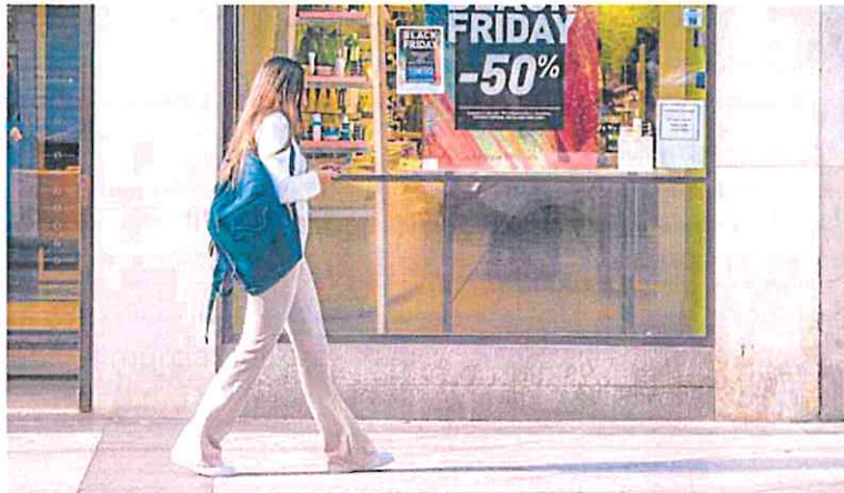
Una joven pasa delante de un comercio del centro de Murcia.

Los europeos empiezan a sopesar qué destino escoger para despedir el año y Murcia es uno de ellos. Según el portal de vuelos JetCost, la Región es el séptimo lugar más solicitado para los británicos, el octavo para los neerlandeses o el decimo-cuarto para los franceses y los portugueses. España se sitúa, asimismo, como el país favorito en Europa para dar la bienvenida al 2023 por delante de Italia, Francia o Portugal