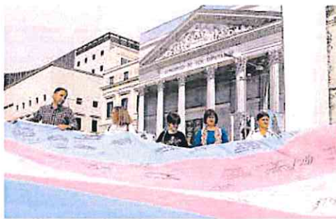
Protesta a favor de la 'ley trans' frente al Congreso.

La 'ley trans' ve despejado finalmente su camino, a pesar de que su tramitación ha sido tortuosa desde su redacción en el seno del Gobierno hasta la aprobación del dictamen ayer en la Comisión de Igualdad. Ha sido, sin duda, uno de los principales puntos de desacuerdo y tensión en la relación entre los partidos del Gobierno de coalición.