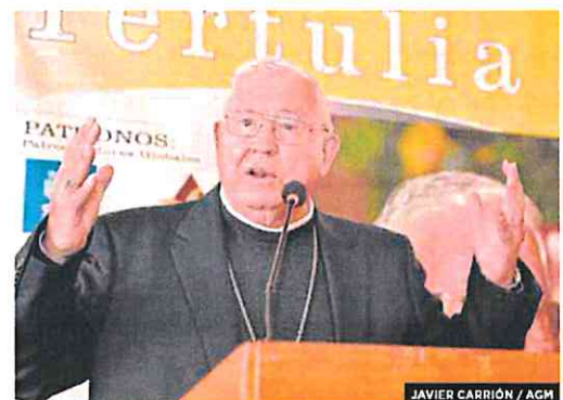
JAVIER CARRIÓN / AGM

Por su parte, CC OO expresó este viernes su «indignación» por la «falta de respuesta» de las empresas del grupo Aena para la recuperación de la productividad y anunció una convocatoria de huelga para Navidad y primer trimestre de 2023, incluida Semana Santa, en los aeropuertos y centros de control.