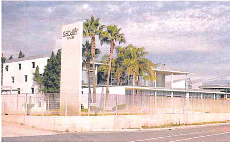
Instalaciones de Sabater Spices, en Cabezo de Torres (Murcia).