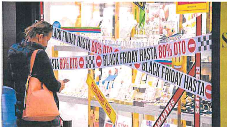
Escaparate de un comercio de la Gran Vía durante las promociones del 'Black Friday'.

Croem apunta que, «atendiendo a una dinámica sectorial, el impacto no es homogéneo. Industria, Construcción y Turismo muestran todavía un comportamiento sólido.