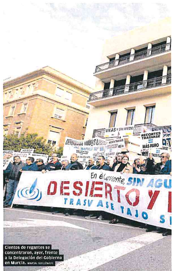
Cientos de regantes se concentraron, ayer, frente a la Delegación del Gobierno en Murcia.

Ganarse el apoyo de la sociedad civil es la tarea pendiente de los regantes. A los ciudadanos Jiménez les recordaba que el mayor impacto que sufrirán será en el bolsillo. Con el encarecimiento del agua por la desalación, la alternativa ofrecida por el Gobierno central, los gastos de producción terminarán por repercutir en los consumidores.