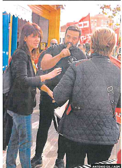
ANTONIO GIL / AGM

Los nuevos caudales ecológicos que se plantean en el Tajo conllevarían el abandono de nada menos que 12.228 hectáreas de regadío, lo que supondría una pérdida directa del valor de producción de 137 millones de euros anuales y de 232 millones de euros anuales con los efectos inducidos en otros sectores. El impacto económico negativo es de tal calibre que podría suponer la pérdida de más de 8.000 puestos de trabajo.