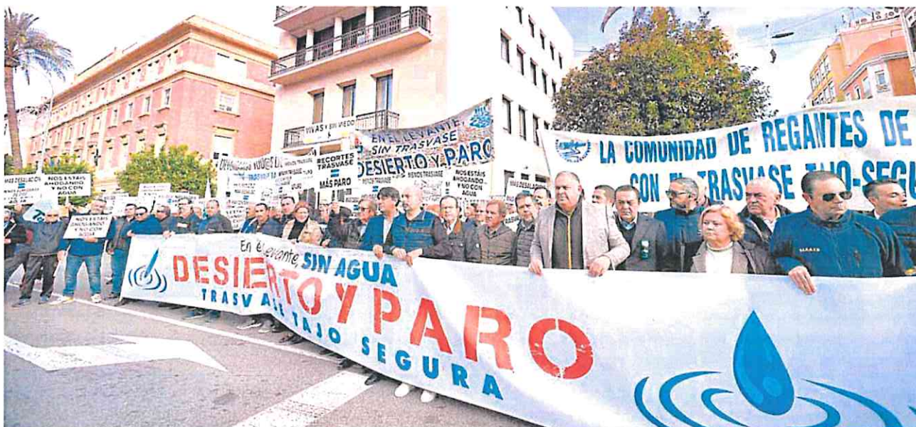
Los representantes de los regantes y dirigentes empresariales sujetan la pancarta en la concentración junto a la Delegación del Gobierno en Murcia, ayer.