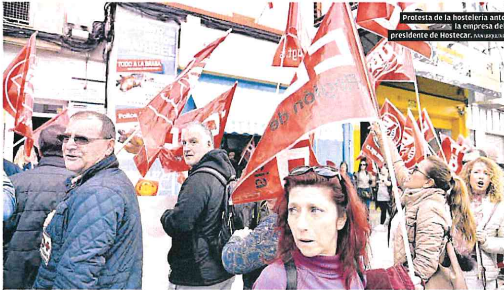
Protesta de la hostelería ante la empresa del presidente de Hostecar. NAN LOPEZ