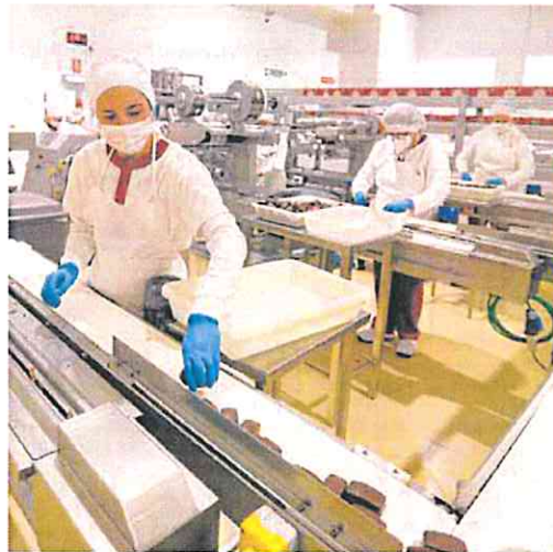
Empleadas en una fábrica de mantecados, en un pueblo de Sevilla.

A pesar de que los expertos anticipan que el ejercicio cerrará con más de 600.000 unidades vendidas, no descartan cierto ajuste del mercado en la recta final del año, pues serán las estadísticas de noviembre y diciembre las que reflejen el verdadero impacto de las subidas de tipos.