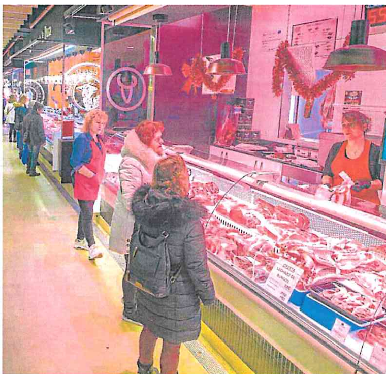
Varias personas, en un puesto de carne en un mercado en Burgos.

Un informe de la OCU (Organización de Consumidores y Usuarios) confirma estos datos: el gasto navideño previsto suma 735 euros por persona, un 15% más que el año pasado (94 euros más), a pesar de que se realizarán menos compras y se harán menos viajes. El presupuesto se incrementa especialmente para los regalos, de 348 euros de 2021 a los 393 de este año, no por más cantidad, sino por las subidas de los precios, según revela la encuesta. También para los viajes y vaca-