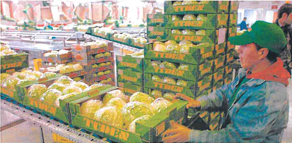
Un trabajador prepara varias cajas de lechugas envueltas en plástico en las instalaciones de una cooperativa agrícola.