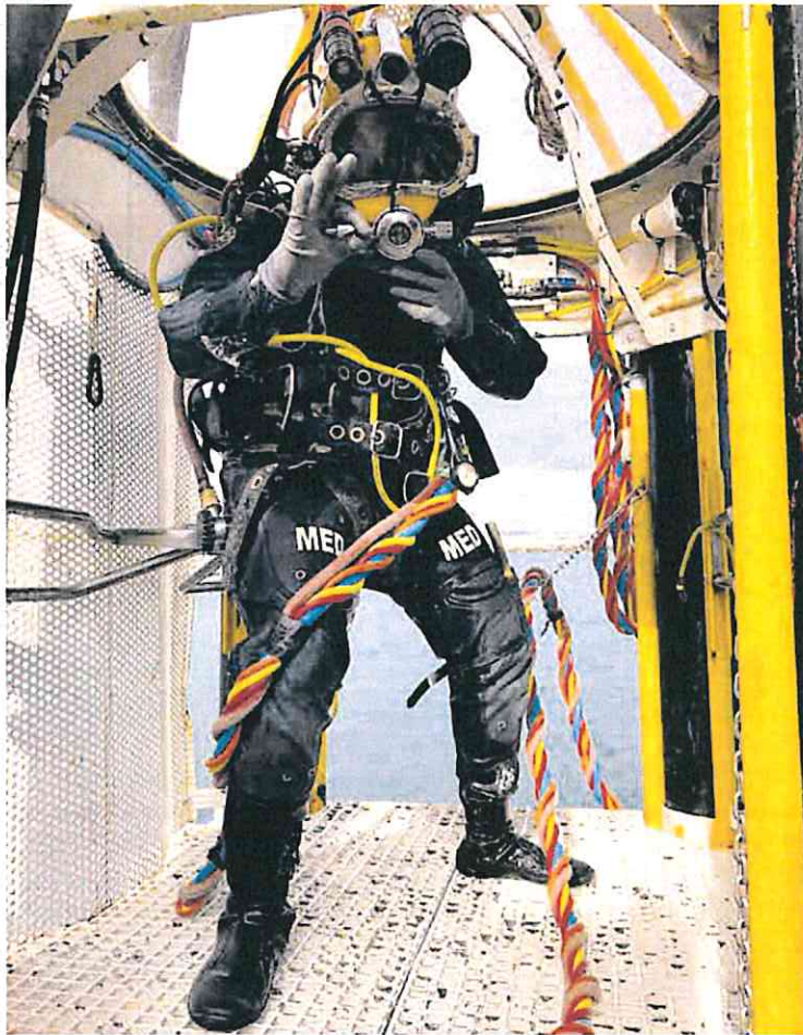
Clases de operaciones subacuáticas en el CIFP Hespérides de Cartagena.

La formación del profesorado permitirá poder hacer frente a estas demandas, señala el director general. Dependiendo de la petición, Educación expedirá un tipo