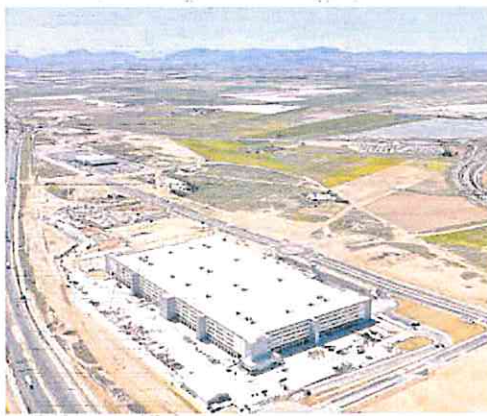
Parque del Sureste junto a la autovía Murcia-Cartagena.

De los 600.000 metros cuadrados de parcelas netas, 50.000 son de titularidad municipal y de los