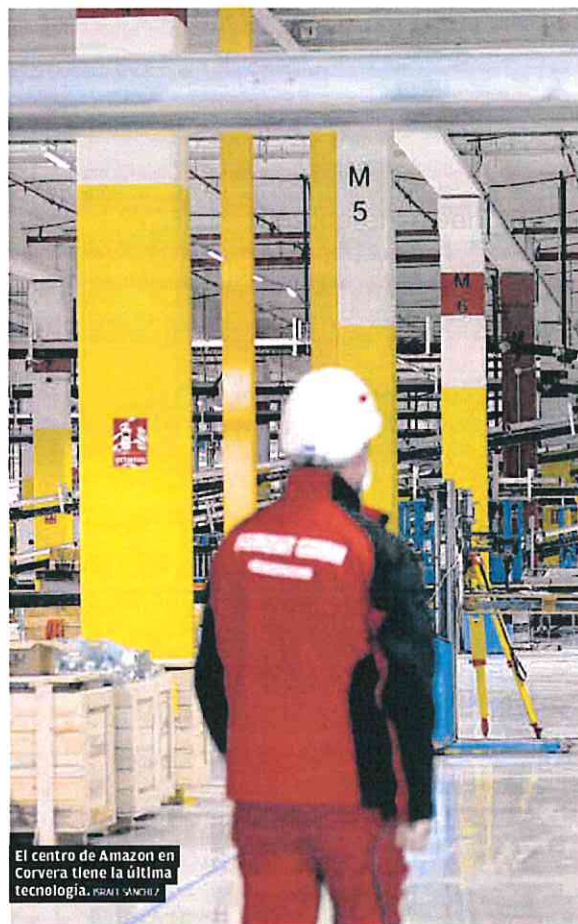
El centro de Amazon en Corvera tiene la última tecnología. FRANK SANCHEZ

El Parque Logístico del Sureste nació con la pretensión de ser la plataforma intermodal más importante del Levante, cuenta con el apoyo de todas las Administraciones de la Región de Murcia y su tramitación cumple los más altos estándares normativos, medioambientales y urbanísticos. Cabe recordar que en enero de 2011 se procedió por parte del Pleno del Ayuntamiento de Murcia a acordar la