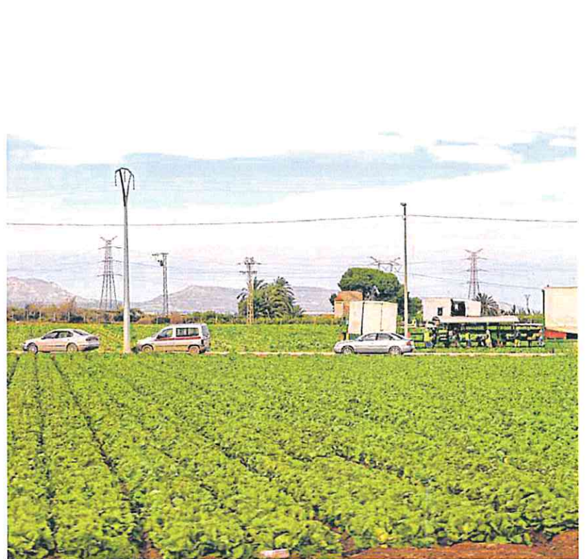
Labores de recolección en una explotación agrícola del Campo de Cartagena, la semana pasada.