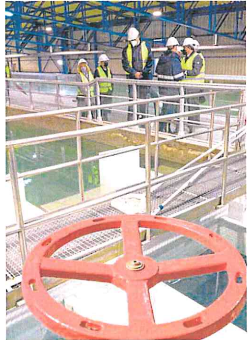
Foto de archivo del Interior de una depuradora de Murcia.

La entidad tiene entre sus principales objetivos impulsar los proyectos de investigación propios en las estaciones depuradoras y fomentar el ahorro energético, la eficiencia en la gestión y la sostenibilidad ambiental. Durante 2022, Esamur