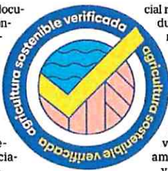
Logotipo del distintivo de agricultura sostenible

probación de la documentación. La Consejería no descarta ampliar la aplicación del sello de sostenibilidad agrícola al resto de la Región de Murcia. Recalca que son «pioneros» con esta iniciativa. Una vez obtenida la autorización, las empresas o explotaciones solicitantes podrán hacer uso del distintivo en los productos agrícolas y en los envases, embalajes y documentación comer-