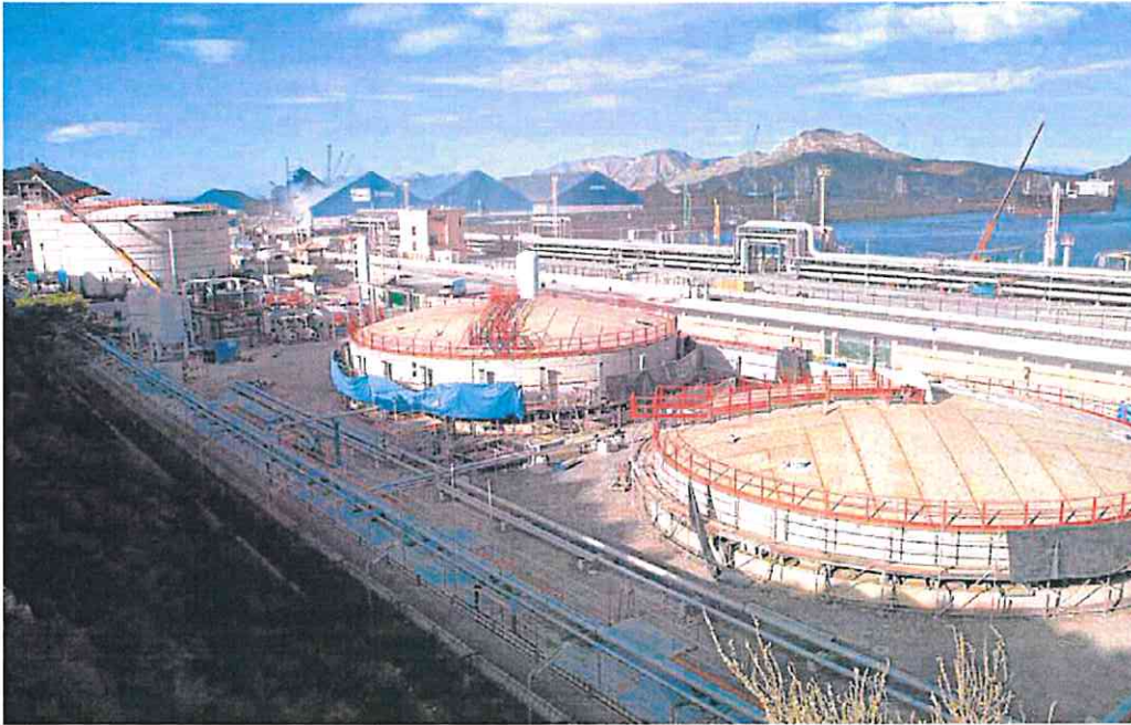
Vista de los cuatro tanques que Repsol construye en sus instalaciones del puerto de Escombreras.