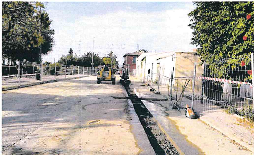
Renovación de redes de alcantarillado en el barrio de Las Filipinas de Alhama de Murcia iniciada a finales de octubre.