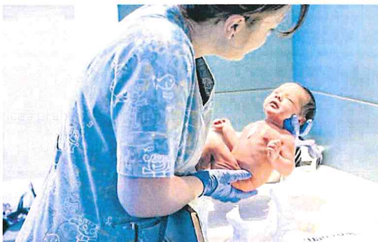
Una matrona sostiene en brazos a un bebé recién nacido.

Los responsables de Recursos Humanos del SMS explican que a lo largo de 2022 se han convocado unos 35 procedimientos de urgencia, de los que 28 corresponden a la selección de personal facultativo sanitario especialista, 3 para la selección de personal diplomado sanitario, opción enfer-