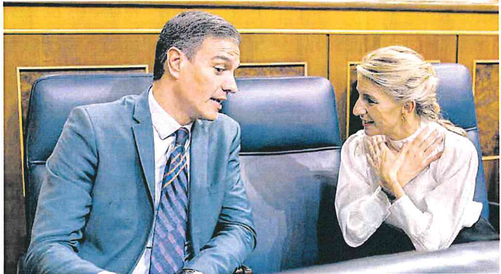
Pedro Sánchez y Yolanda Díaz, en el Congreso, el pasado 24 de noviembre.