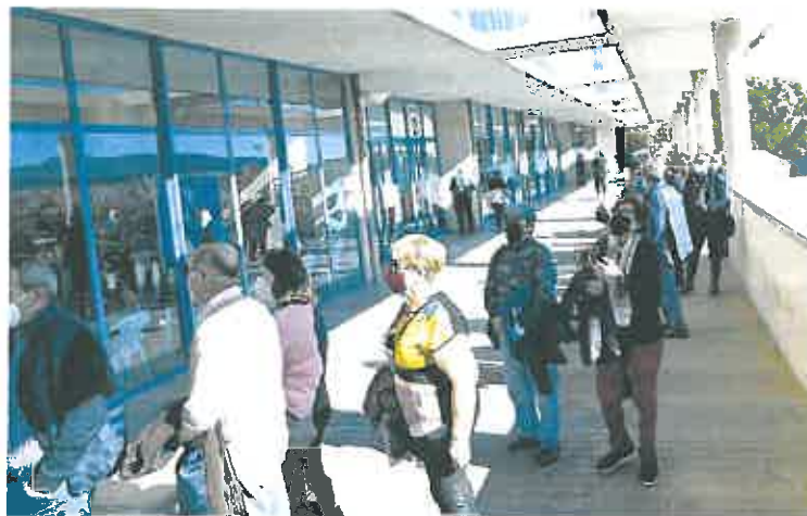
Colas para la vacunación en el Palacio de los Deportes de Murcia.

En una circular remitida este viernes a los directores de los centros, la Consejería recuerda «la importancia de que los centros educativos sigan manteniendo en todo momento las medidas de prevención establecidas en sus planes de contingencia» y pide reforzar la «implementación y el cumplimiento». En la circular se subraya que al centro no se deberá acudir si se presenta síntomas