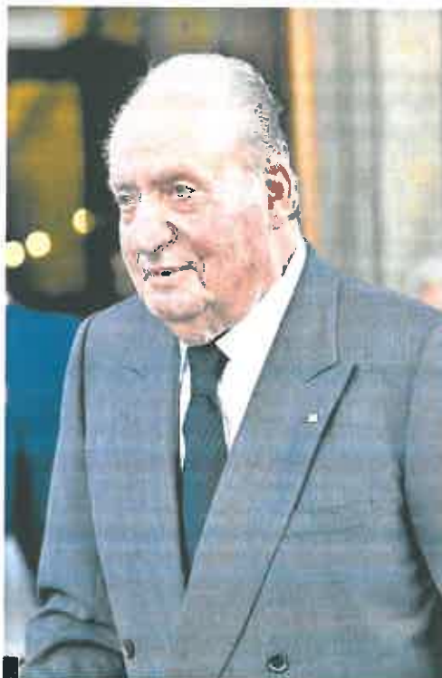
El rey emérito, en una imagen antes de abandonar el país.

Por eso, desde hace meses, se trabaja en la perspectiva de su vuelta. La Zarzuela y La Moncloa se preparan para su regreso a España. Sobre todo la Casa del Rey. Pero su retorno no es un asunto fácil. Se está librand un importante tira y afloja. Juan Carlos I reclama seguir vivien-