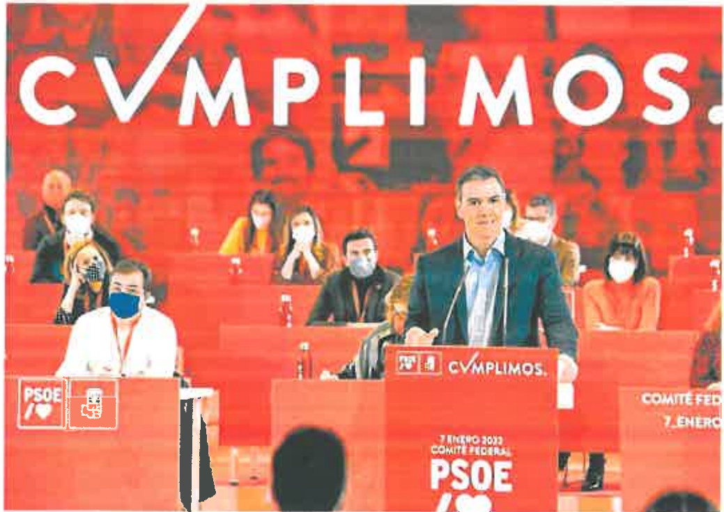
El presidente del Gobierno, Pedro Sánchez, ayer durante su intervención en el Comité Federal del PSOE, en Madrid.

En opinión de Sánchez, si la oposición no respalda la reforma laboral deberá explicar a sus votantes «si se resiste a defender los intereses de los empresarios