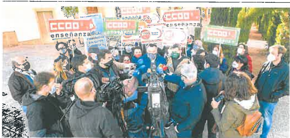
Los responsables de los sindicatos de enseñanza, ayer frente a San Esteban, donde plantearon sus demandas. ROS CAVAL

Según los datos de la Administración regional, solo faltan profesores en el 31% de los centros educativos