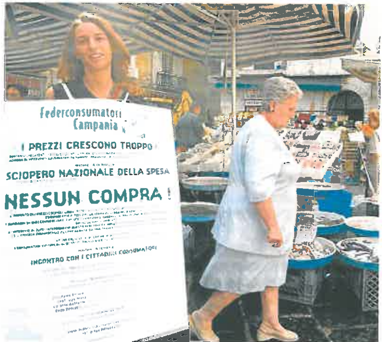
Una mujer protesta en un mercado de Nápoles por la subida de los precios, que en Italia fue del 4,2%.

Al excluir del cálculo el impacto de la energía, la tasa de inflación interanual de la zona euro subió al 2,8% desde el 2,5% del mes anterior, mientras que al dejar fuera también el efecto de los precios de los alimentos frescos, el alcohol y el tabaco, la tasa de inflación