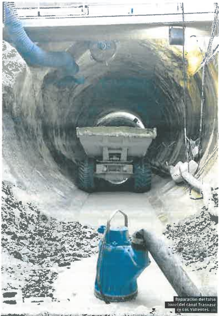
Reparación del falso túnel del canal Travesaje en Los Valientes.

Según una encuesta de Frecom, «el 55% de los encuestados apunta que el incremento de precios de las materias primas les ha obligado a cancelar algún contrato o paralizar alguna obra». Este sondeo realiza-