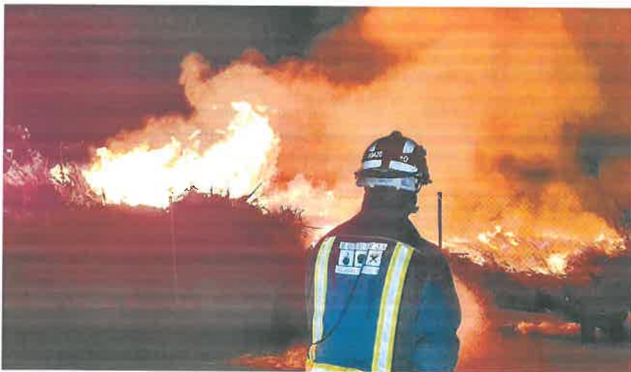
Un bombero trabaja en el incendio que se produjo en Archena el Día de Reyes, debido a una quema de restos de poda de palmeras.