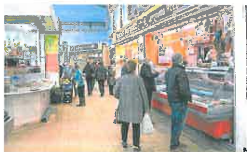
Varios clientes ante la carnicería donde ocurrió el suceso. J. M. RODRÍGUEZ

El suceso, del que fueron terceros clientes y otros empleados de la plaza de abastos, llevó a movi-