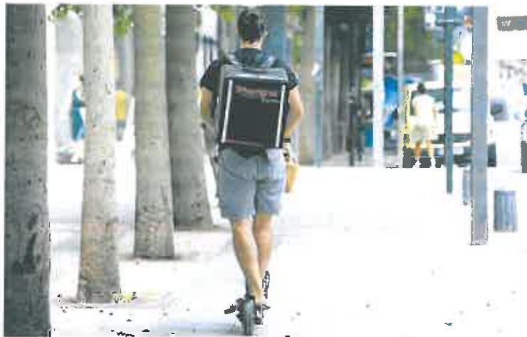
Repartidor de una empresa de distribución urgente por las calles de Murcia.

El año 2021 ha terminado en la Región con 2.315 trabajadores por cuenta propia de alta más, según los últimos datos de la Unión de