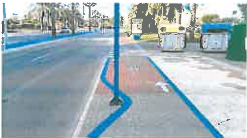
Una línea del carril bici bordea una señal informativa en La Manga.