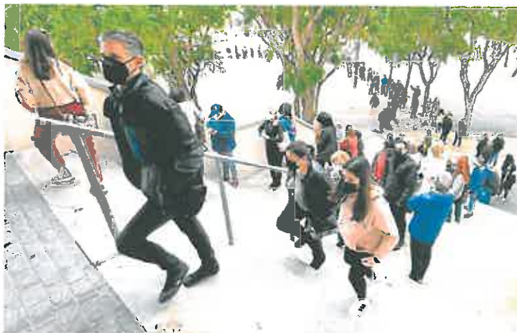
Colas para vacunarse, ayer en el Palacio de los Deportes de Murcia.

En la actualidad, solo tienen derecho a una baja laboral las personas que están obligadas a guardar cuarentena: las que han dado positivo en una prueba diagnóstica o son contacto estrecho de un positivo y no tienen la pauta completa de vacunación.