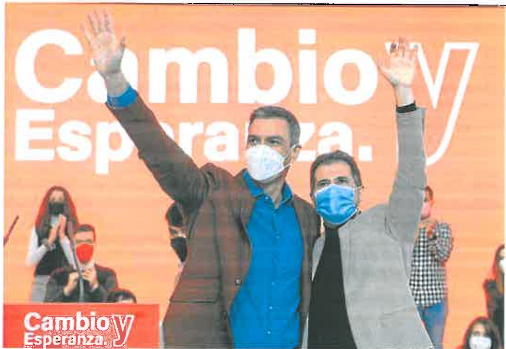
Pedro Sánchez arropa al candidato socialista a las autonómicas de Castilla y León, Luis Tudanca, ayer, en un acto en Palencia.

Con los socios del Gobierno descontentos con dicho decreto ley, que consideran «insuficiente», como es el caso de ERC y EH