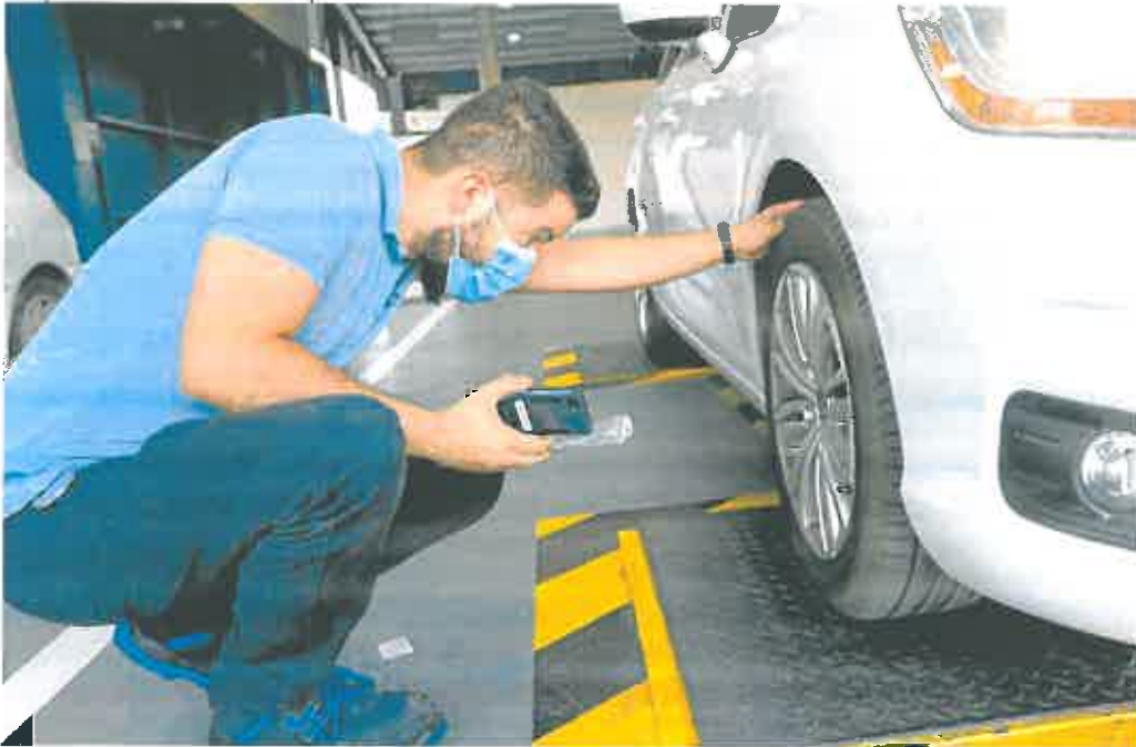
Un técnico revisa los neumáticos en una estación de ITV de Murcia.

De las 8 plantas de inspección que había antes de la desregulación, se ha pasado a 36, más otras 4 que hay en trámite