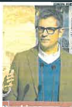
Bolaños, ayer, en un acto del PSOE.

Frente a la ofensiva judicial de autonomías y ayuntamientos del PP por el reparto de fondos europeos, que los 'populares' demuestran que se realiza en «beneficio»