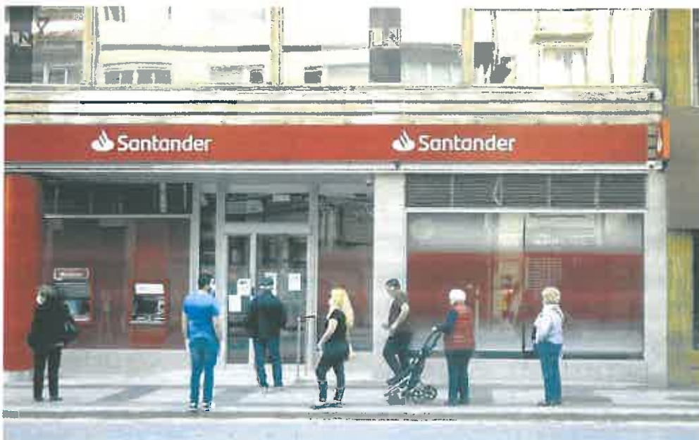
Usuarios hacen cola en un cajero del banco Santander de Murcia durante el periodo del confinamiento, en abril de 2020.