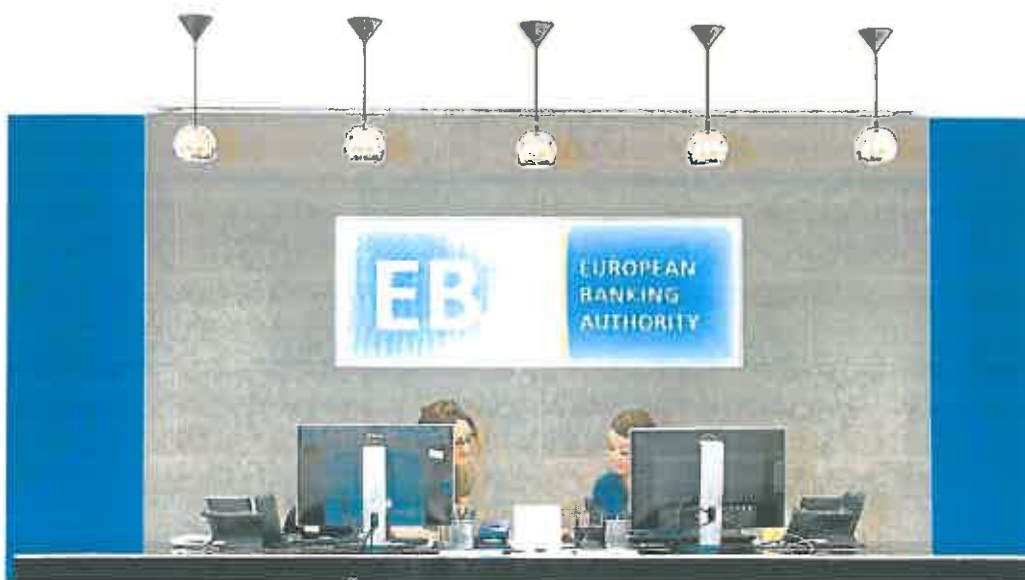
Interior de la sede de la Autoridad Bancaria Europea (EBA) en París.