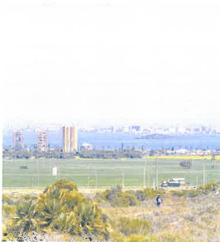
Panorámica del campo de Cartagena y el Mar Menor desde Calblanque.

Para el Ejecutivo, el diseño que realiza la normativa murciana «dificulta, reduce y dilata» los procesos autonómicos de restitución de los terrenos a su estado