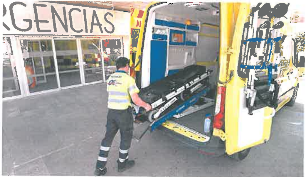
Un profesional prepara una ambulancia, ayer, en el Hospital Virgen del Castillo de Yecla.

Satse apunta en la misma dirección. «El SMS tiene orden de Hacienda de reducir las contrataciones desde antes de las Navidades. Además, son contratos más cortos que en las comunidades limítrofes, que han ofertado tres o cuatro meses para las enfermeras, mientras que aquí la mayoría