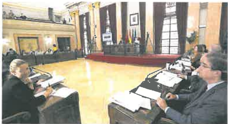
La Corporación municipal durante la sesión plenaria de ayer

Los sindicatos piden el cese de la jefa de servicio de Escuelas Infantiles ► Los sindicatos SAME y CCOO ocuparon ayer una de las pajareras con carteles en los que se podía leer 'Libertad sindical'. Exigen el cese de la jefa de servicio de Escuelas Infantiles por «una larga trayectoria de conducta antisindical». Como ejemplo, señalaron que en últimas elecciones sindicales prohibió el acceso a las escuelas infantiles para hacer campaña electoral y dificultó el ejercicio del derecho al voto». Si nada cambia, estos sindicatos pedirán la dimisión del concejal de Educación.