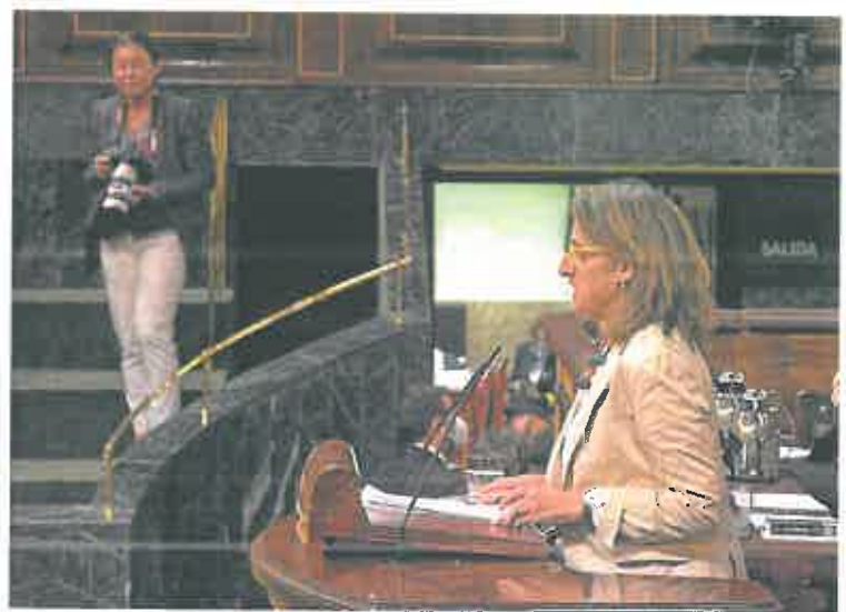
La ministra para la Transición Ecológica, Teresa Ribera, ayer en el Congreso.

En el caso del Estado, hasta mayo el déficit fue del 1,36%, prácticamente la mitad que entre enero y abril del año pasado. Este resultado se debe, según Hacienda, a un incremento de los ingresos por la fuerte recaudación -gracias a la actividad económica- y a un gasto algo menor.