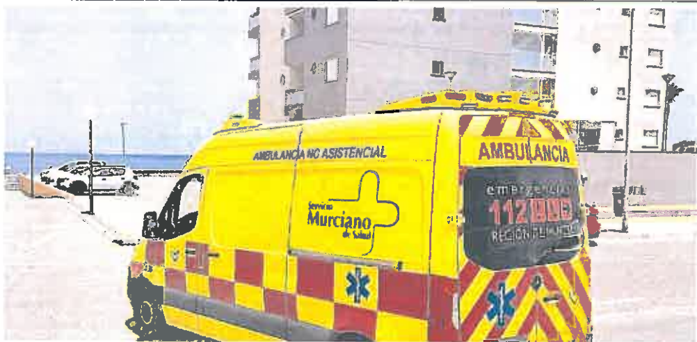
Los centros asistenciales de la costa se refuerzan en verano para atender a toda la población desplazada.

► El Plan Verano 2022 contará con un presupuesto inicial de 30 millones de euros que servirá para la reorganización de la asistencia durante los meses de julio a septiembre.