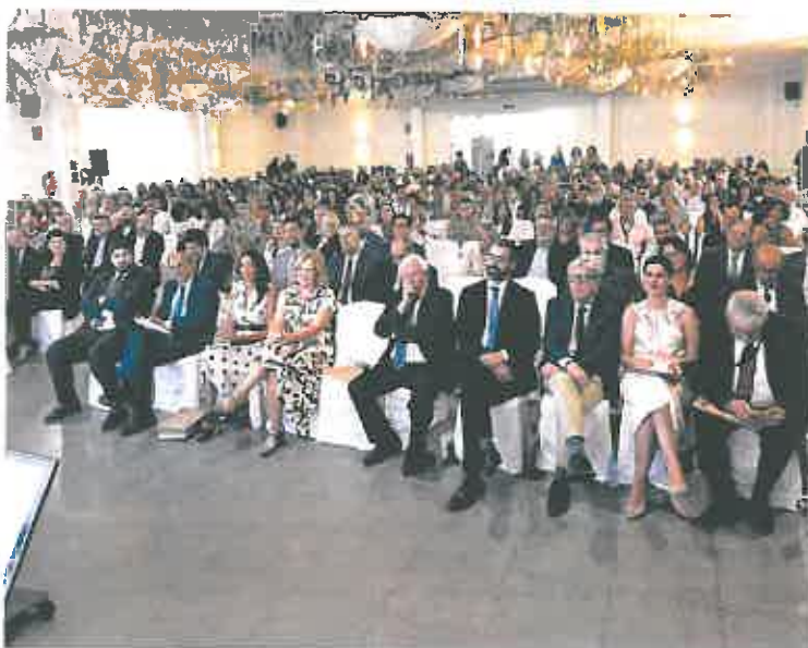
Asistentes a la XXXIII Asamblea General de Ucomur.

El cooperativismo aporta ya en la Región unos 100.000 empleos, más de la mitad de cuales corresponde a las cooperativas agrarias, que suman unos 55.000 puestos de trabajo, mientras que las sociedades laborales y los centros especiales de empleo aportan otros 30.000, según las estimaciones del presidente.