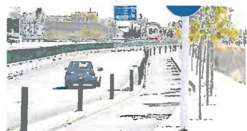
Tramo de la Costera Sur a la altura de El Palmar