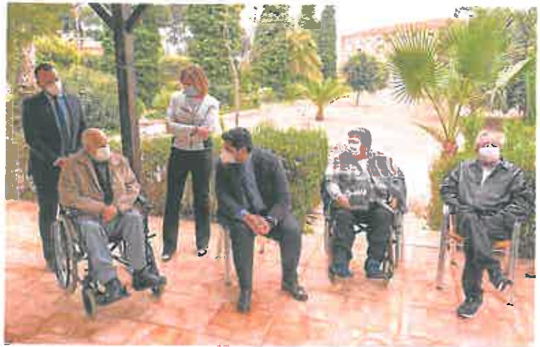
Isabel Franco y Fernando López Miras, en una visita a una residencia de mayores, en marzo de 2021. A. ca.

Tampoco hay más vehículos para Urgencias, subrayan. Por todo ello, la asociación considera que el plan «no responde a las necesidades reales del Servicio Murciano de Salud».