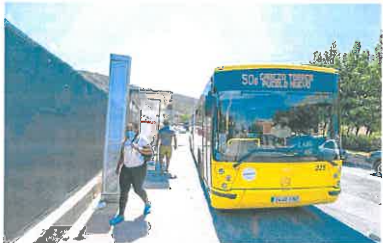
Viajeros en una parada de la línea Cabezo de Torres-Pueblo Nuevo (Murcia), ayer a mediodía.

Fuentes del Ejecutivo autonómico explicaron que se trata de una nueva medida «para garantizar la prestación de los servicios públicos mediante la minimización del impacto económico de la crisis en las empresas del transporte». Entre esas medidas de apoyo al sector del transporte también destaca la eliminación de las tasas regionales del transporte incluidas en el plan regional de reactivación económica, que esta semana se ha ampliado hasta final de año.