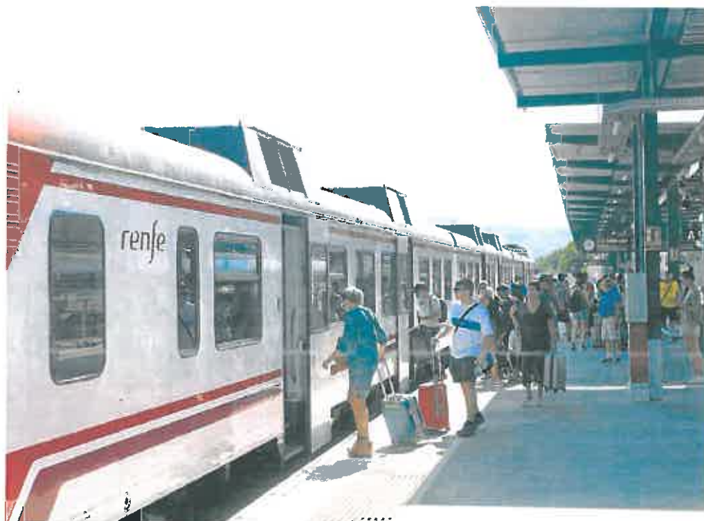
Los pasajeros suben a un tren automotor de la línea de Cercanías entre Murcia y Alicante, ayer en la estación del Carmen.

El representante de Froet considera que las ayudas al tren se dejarán notar principalmente a mediados de septiembre, cuando empiece el curso en las tres universidades de la Región, ya que se moviliza un considerable número de estudiantes. En los periodos