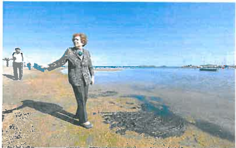
La jefa de la delegación europea, la letona Tatjana Zdanoka, en febrero en la orilla del Mar Menor.

Por otra parte, entre la batería de propuestas para mejorar el estado de la albufera se incluye la recuperación de los efluentes del