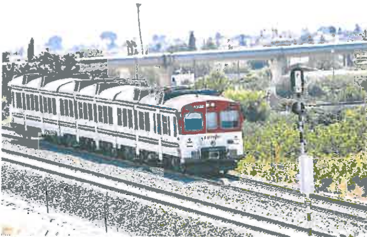
Las bonificaciones se aplicarán en la línea de Cercanías de Murcia a Alicante.