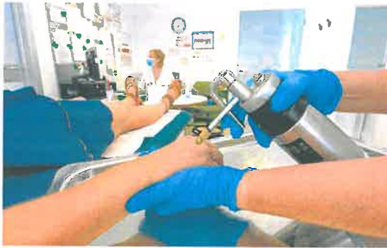
Un paciente se somete a un tratamiento en el servicio de Dermatología del Reina Sofía.