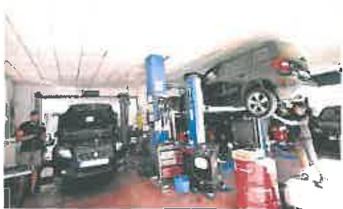
Wagon de un taller de reparación de vehículos.