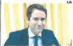
Teodoro García Egea.

► El murciano dimitió como secretario general tras la marcha de Casado y ahora ha sido nombrado por mayoría absoluta