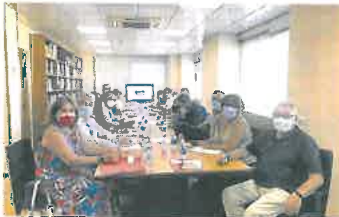
Reunión del Consejo de la Seguridad y Salud Laboral.

En concreto, ocho tuvieron lugar mientras los accidentados desarrollaban su jornada laboral y