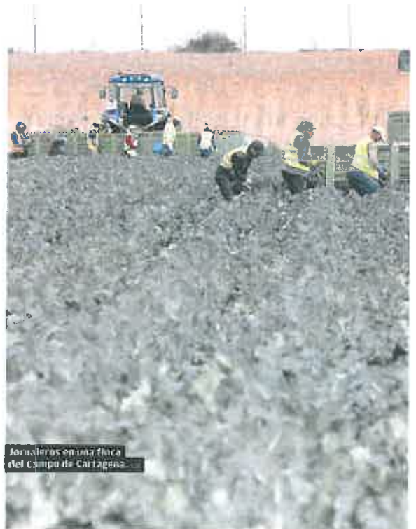
Trabajadores en una finca del Campo de Cartagena.

Mientras tanto, los contratos temporales han registrado «una