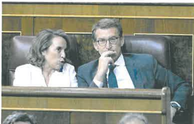
Cuca Gamarra y Alberto Núñez Feijóo, ayer, en el Congreso de los Diputados.

La formación conservadora hizo saber su opinión sobre los dos principales anuncios del discurso del debate sobre el estado de la nación del Gobierno justo a la vez que adelantó su abstención en la votación del segundo paquete de medidas para paliar las consecuencias económicas de la guerra en Ucrania. No pueden apoyarlo, dijo el diputado Jaime Olano, porque incluye medidas «populistas». Fue tan duro en su intervención que sorprendió cuando la dirección del partido informó a la prensa de que se optarían por la abstención.