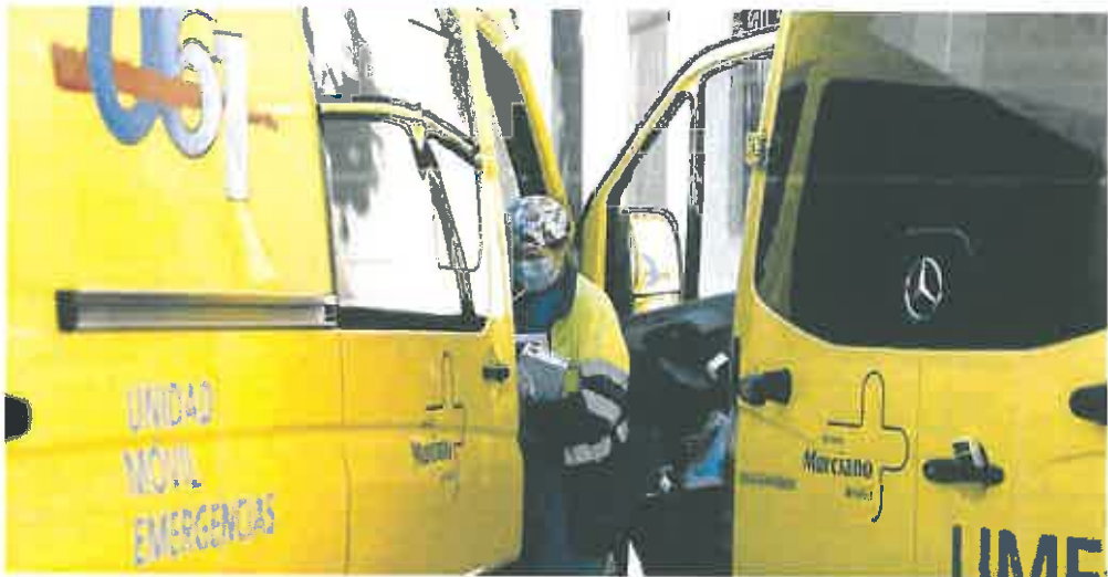
Una sanitaria trabaja dentro de una de las ambulancias del 061 de la Región de Murcia.

El temor reside en que esta falta de médicos se 'cubra' con la presencia de enfermeros en las ambulancias del SUAP. El Sindicato Médico en Valencia y otras organizaciones sanitarias en Madrid ya han denunciado el Intrusismo laboral que se produce al permitir que «especialistas en enfermería tengan que desempeñar funciones que son propias de un médico cuando la dotación del servicio de asistencia de emergencias no lo lleva».