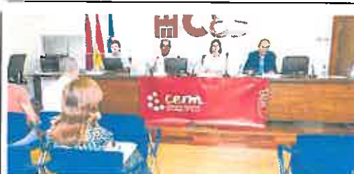
Un momento de la reunión del Consejo Escolar, ayer.