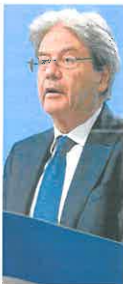
Paolo Gentiloni, ayer.

El comisario de Economía, Paolo Gentiloni, apuntó que la economía europea es «especialmente vulnerable» a la volatilidad del coste de la energía, por su alta dependencia de Rusia, lo que ha lastreado la actividad. A la presión inflacionista se suma la erosión en el po-