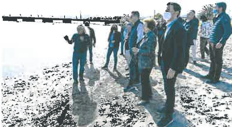
Miembros de la Comisión de Peticiones y eurodiputados, durante su visita al Mar Menor.

Ahora, este documento recoge unas conclusiones y una serie de recomendaciones que hacen a las autoridades españolas para tratar de salvar la laguna. Los eurodiputados consideran que «este problema múltiple» que sufre el Mar Menor necesita «una acción integral por parte de todas las autoridades» con competencias. Señalan, además, que aquellas actividades económicas que contaminan la laguna «necesitan medidas regulatorias bien diseñadas y estrictas», además de limitarlas a nivel territorial. «Sin medidas estructurales, ni las actividades ni la integridad ecológica serán posibles, al menos en los niveles de calidad deseables», señalan, «es necesario monitorear los usos agrícolas, urbanos y turísticos de la zona».