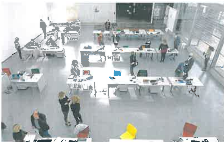
Uno de los pabellones de La Conservera, que fue utilizado para enseñanza 'online' durante la pandemia.