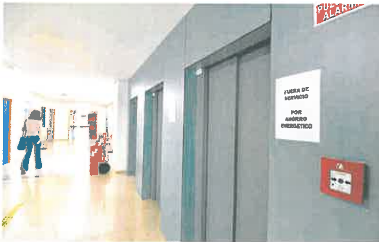
Carteles en algunos ascensores de Biología fuera de servicio por ahorro energético.

La UMU acordó a finales de marzo un plan para recortar el gasto en electricidad, cuando decidió limitar el uso de la calefacción solo a determinados umbrales. También se aprobó activar la refrigeración de las aulas a partir de los 27 grados en el interior de los centros, con cortes cada dos horas y solo a partir de las 10 horas. La UMU también acordó cerrar sus aulas de estudio y otros espacios de reunión por las noches y los fines de semana, y dejar solo abierto al público el aula de La Merced en horario nocturno y sábados y domingos. Las medidas para la contención del gasto en electricidad ya se adoptaron en 2012 tras la crisis económica, en un contexto de contención de gasto que la UMU está aplicando de nuevo.