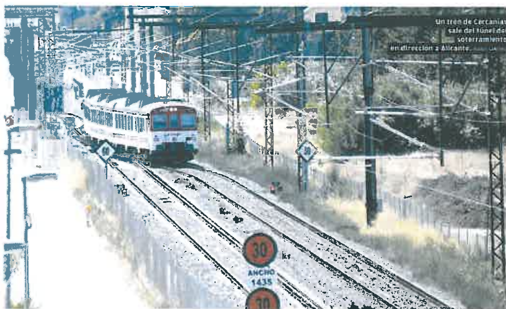
Un tren de Cercanías sale del túnel del soterramiento en dirección a Alicante.