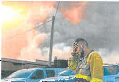
Un bombero llora con impotencia por el avance de las llamas en Losacio.

Los fuegos obligan a evacuar a unos 2.000 vecinos de Lugo, Orense, Zamora y Barcelona, y cortan el AVE a Galicia