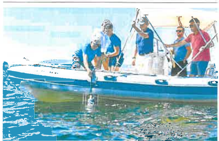
Momento de la colocación, ayer, de una de las nuevas boyas en aguas del Mar Menor.

La Demarcación de Costas está a la espera solo de la respuesta de la Dirección General del Medio Natural para trasladar al Ministerio la resolución de la concesión definitiva a Anse del dominio público de las salinas orientales.