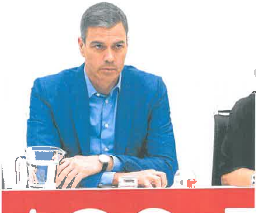
El líder del PSOE y su hasta ahora 'número dos', en la ejecutiva tras el revés de las andaluzas.

un comité electoral en el que no se descarta la participación de esos colaboradores (exsecretario de Organización y portavoz parlamentario del PSOE). En todo caso, según apuntan en su entorno, busca que la relación entre La Moncloa y el partido fluya con mayor facilidad.