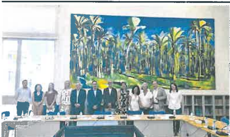
Reunión del Observatorio de la Calidad de los Servicios de la Comunidad Autónoma.