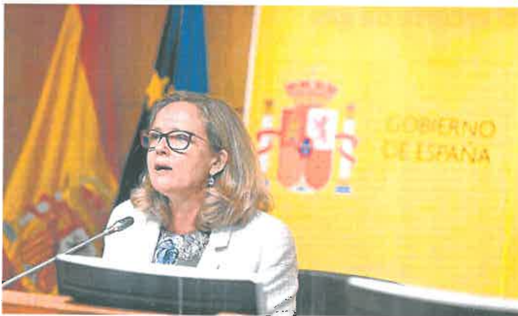
La vicepresidenta económica, Nadia Calviño, ayer durante una comparecencia en la sede de su departamento.

Los expertos recuerdan que otros tributos anunciados han recaudado menos de lo esperado