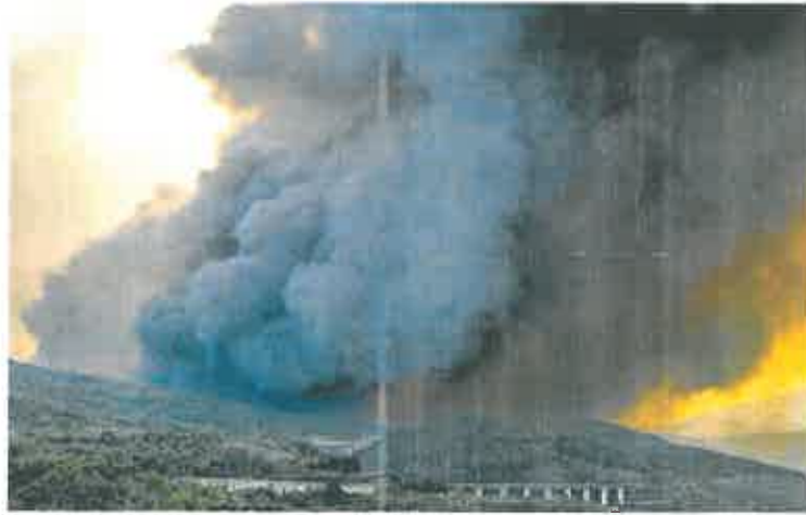
Incendio forestal en O Barco de Valdeorras (Ourense).

Otros ocho fuegos activos en la comunidad han sido clasificados