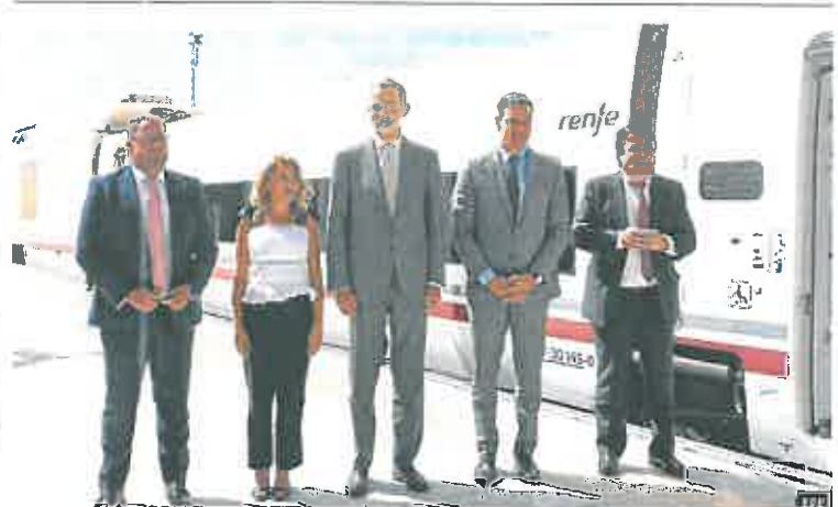
El Rey inaugura la puesta en marcha del AVE extremeño

te, por lo que ha cedido a las presiones de los sindicatos —más expresamente de CC OO, la organización ahora más crítica— para rebajar aún más las cuotas a quienes menos ganan, pero manteniendo las de aquellos que más ingresan. Así, el nuevo esquema de cotización en función de los ingresos reales tendrá unas cuotas que oscilarán entre los 230 euros y los 530 euros en 2023. Luego se modificará gradualmente los dos años siguientes hasta alcanzar una horquilla en 2025 entre los 200 euros y 590 euros.