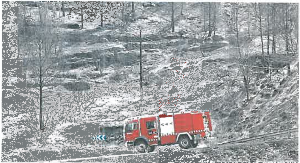
Un camión de bomberos atraviesa ayer parte de las 1.600 hectáreas calcinadas en el incendio aún activo de Pont de Vilomara (Barcelona).

Pero lo peor de todo, lo que de verdad muestra el peligro y la devastación que ya ha traído a España el cambio climático, es que solo en esos 20 tórridos días de junio y julio la suma de unas temperaturas infernales con arboledas repletas de matorral y maleza secas (pura yesca) han desencadenado 23 superincendios —de