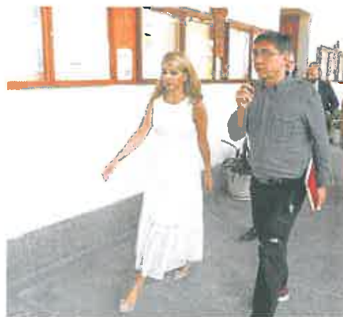
Yolanda Díaz y Juan Carlos Monedero, en los cursos del Escorial.

Amante de la música, sobre todo del rock con AC/DC entre sus grupos de cabecera, y voraz lectora de los poemas de Ángel González, uno de sus referentes vitales, Lastra se ha caracterizado por aguantar bien la presión, no amedrentarse y desplegar un carácter contundente. Toda una mujer de partido y leal a Sánchez hasta este cese como vice-secretaría general del PSOE. Su salida desatasca eventuales cambios internos y encauza tensiones en Ferraz agudizadas por los últimos revolcones en las urnas.