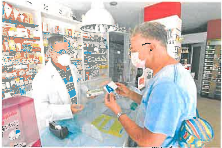
Un cliente compra, ayer, un test de antígenos en una farmacia de Murcia.

En España, el número de hospitalizados en UCI por coronavirus aumentó un 9,1% durante la última semana y solo Andalucía, Baleares, Ceuta, Madrid y la Región de Murcia registran descensos en este indicador. Los ingresos en planta, en cambio, descendieron en España un 9,4%, siendo Canarias, Canta-