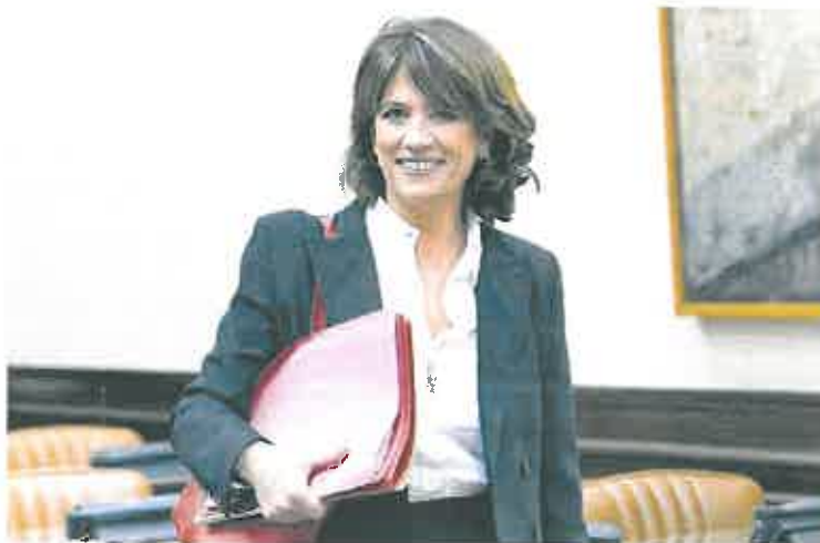
Dolores Delgado, en la Comisión de Justicia del Congreso.

El nuevo fiscal general sustituirá a la que desde las asociaciones de fiscales se ha considerado la fiscal general más polémica de la de-