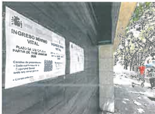
Oficina de la Seguridad Social donde se puede solicitar el IMV.

Es más, apenas cubre a un 22% de los hogares en riesgo de pobreza, que se estiman en 1,3 millones (es decir, aquellos cuyos ingresos son inferiores al 40% de la renta mediana nacional). Cubrir toda la pobreza supondría un coste de 6.000 millones anuales, frente a los 1.600 millones que se