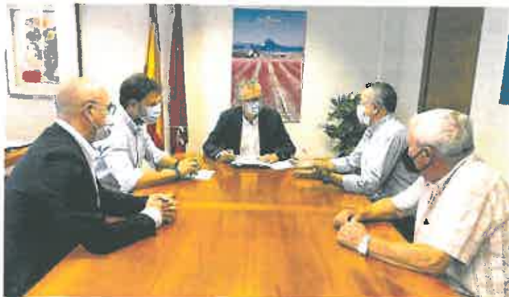
Reunión del alcalde de La Unión con el consejero de Salud.

Sobre el periodo vacacional, indicó en que en Atención Primaria no se ha cerrado ningún consultorio de salud, así como los Puntos de Especial Aislamiento de Benlizar, Sabinar y Cañada de la Cruz, que permanecerán abiertos.