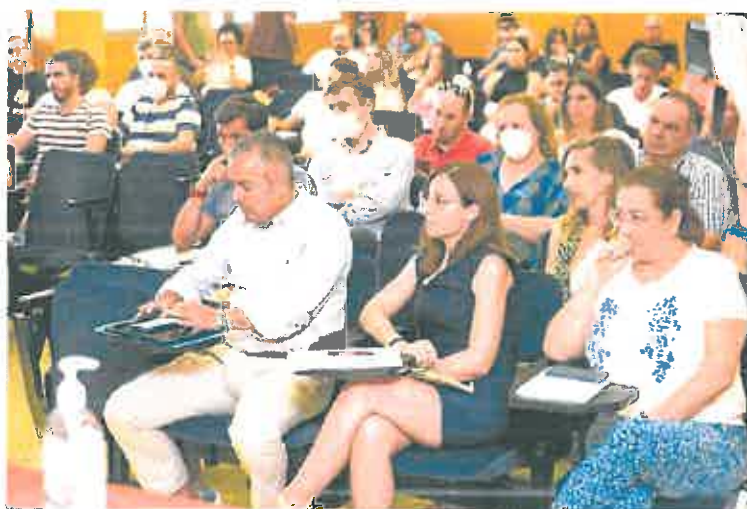
Asistentes a la jornada técnica celebrada ayer en la sede de la Consejería de Agricultura.

La implantación de estas líneas de actuación tendrá como horizonte temporal el año 2030, cuyo primer hito será la aprobación este año de los planes hidrológicos del tercer ciclo y de los planes de gestión del riesgo de inundación.