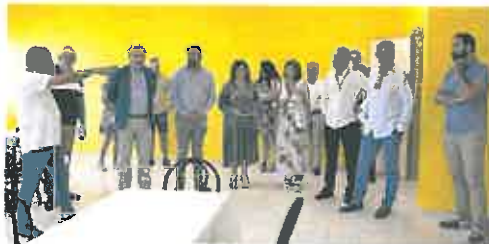
A la presentación de las instalaciones acudieron el director general de FP, el alcalde de Los Alcázares y representantes de restaurantes de la zona.

Se impartirán los ciclos de Grado Medio Concertado en Cocina y Gastronomía y el Grado Medio en Servicios de Restauración