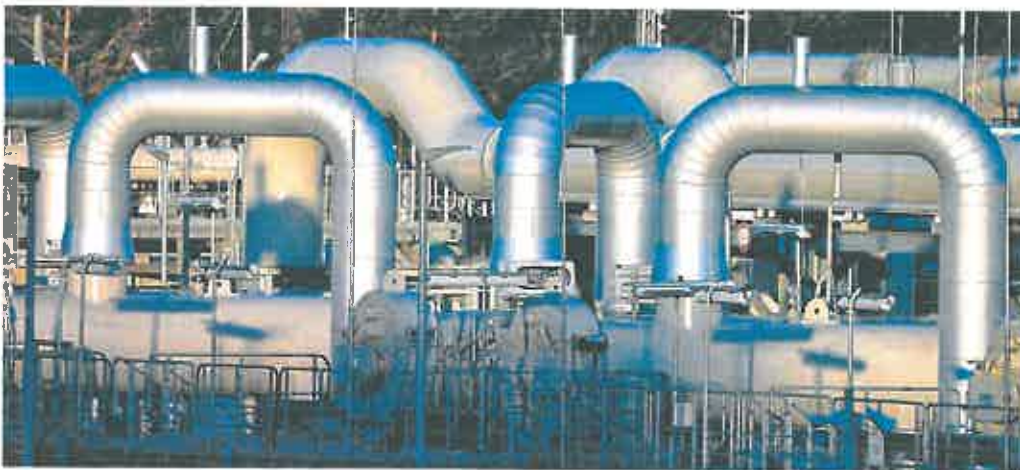
Infraestructura del gasoducto Nord Stream I, que une Rusia con Alemania.

El foco del informe centra su análisis en los países del centro y sobre todo del este de Europa, los más dependientes del suministro de gas ruso. E insta a los del sur, como España, a aprovechar las conexiones para exportarles gas si lo necesitan.