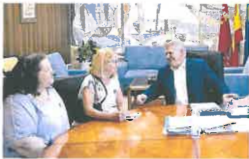
Reunión de la Coordinadora con el Delegado del Gobierno.

Además, según el colectivo, «se demuestra que no aplicarán el Plan Director teniendo en cuenta con las acciones aisladas e inconexas que anuncian, cuyo objetivo no es darle un tratamiento uniforme a todo el yacimiento sino proponer actuaciones incoherentes basadas en el inte-