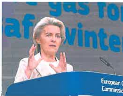
Ursula von der Leyen, ayer en Bruselas.

Ribera considera que esa idea de que todos los Estados reduzcan un 15% el consumo de gas no tiene sentido en un mercado como el español, prácticamente ajeno al resto de Europa, al ser una isla energética. Aunque el sistema peninsular aplicara ese recorte, España no tiene capacidad de trasladar todo ese gas que no se ha consumido ni por tierra, en los pequeños gasoductos que unen País Vasco y Navarra con Francia; ni por buques metaneros, ya que el resto de países, como Alemania, apenas tiene plantas regasificadoras para recibir esa cantidad de gas.