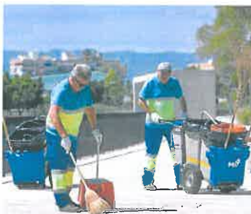
Barrenderos trabajando ayer en las calles de Murcia.

En cuanto a los trabajadores de parques y jardines, han recibido charlas informativas y se ha adelantado el horario de entrada de 7.15 a 6.45 horas. En cuanto a los equipos de tarde, se asignan tareas suaves como el riego con cuba y limpieza de juegos y pipicanes.