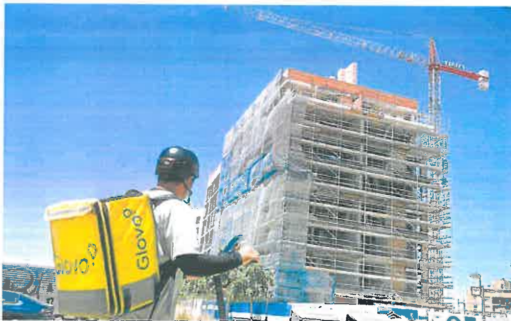
Edificio de nueva construcción en la zona de Juan de Borbón.