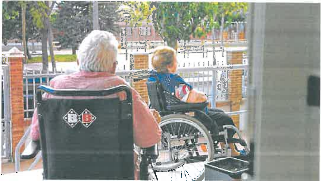
Dos internas, en los espacios exteriores de una residencia de personas mayores de la Región.

La Comunidad prepara un decreto para abonar 4,5 millones que se adeudan a los centros por los gastos de la pandemia