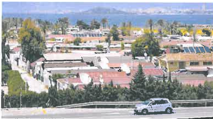
Residencias del Camping Villas Caravaning, en La Manga.

Caravaning Costa Cálida, S.L., no obstante, «tiene la mano al Ayuntamiento para consensuar las medidas que sean necesarias para garantizar la seguridad de las personas en el camping, y ha solicitado a la Administración municipal «una reunión urgente para avanzar en soluciones definitivas, que den seguridad jurídica a la mercantil», que se celebrará hoy mismo, ante su voluntad de «invertir lo que sea necesario para