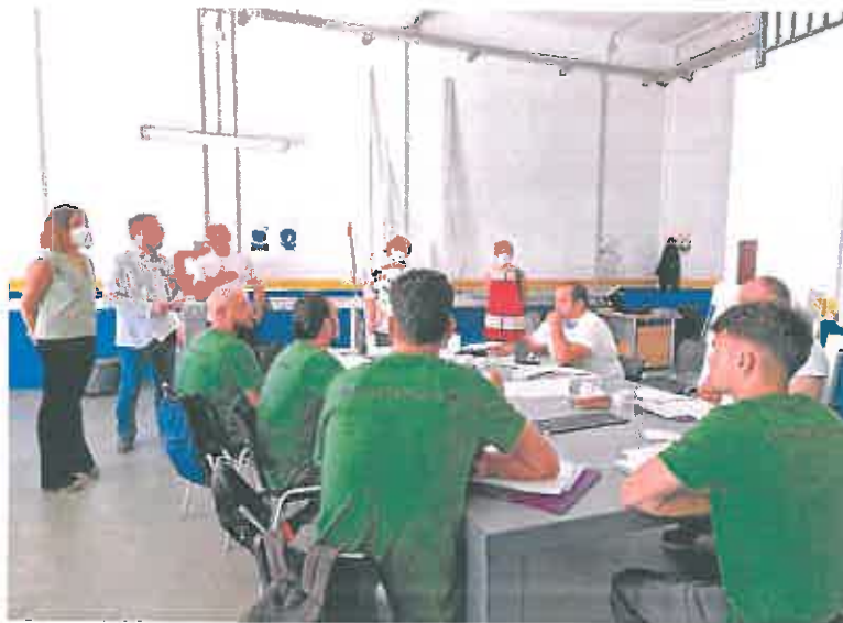
Visita del alcalde, ayer, a los alumnos del Vivero de Empresas de Torrecilla.

Según el alcalde, la eficacia del proyecto reside en que los cursos se han organizado teniendo en cuenta las necesidades laborales que se han detectado en el municipio y las solicitudes de las patronales de distintos sectores de actividad para que la formación sea «útil». Dijo que con el repunte del sector de la construcción han sido muy demandados los oficios de operaciones auxiliares de montaje electrostáticas y de telecomunicaciones en edi-