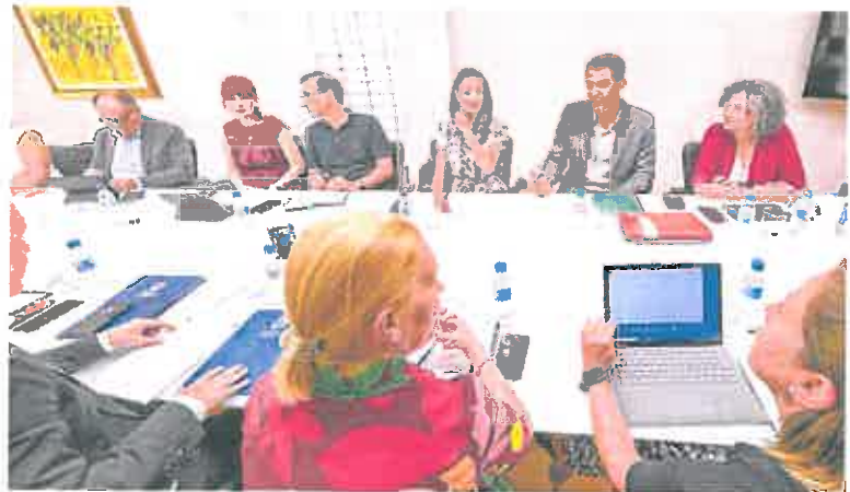
Los rectores y vicerrectores de las tres universidades con la consejera y el director de Universidades.

La modificación y el aumento salarial tendrán carácter retroactivo para quienes lo solicitaron