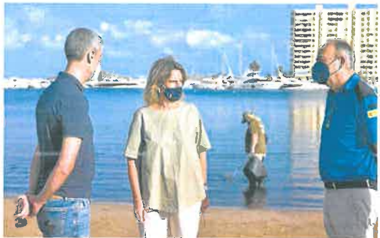
Teresa Ribera, en el Mar Menor en agosto del año pasado.