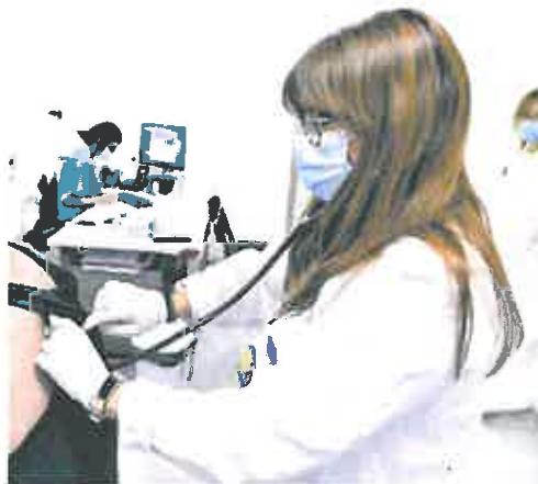
Los centros se suman a los cerrados desde el año pasado. IVÁN URQUÍZAR

El sindicato UGT ha mostrado su «preocupación» por el «más que evidente deterioro de la sanidad pública en la Región de Murcia» debido al cierre de consultorios médicos en verano. En concreto, desde el sindicato han informado de que en el Área I de salud han cerrado los centros de Barqueros, La Murta y La Puebla de Mula; en el Área II, los de San Isidro, El Escobary La Pinilla; y en el Área III, los de La Tercia, La Campana, y La Escucha. En el Área V, en Jumilla, ha cesado su actividad el consultorio del Barrio de San Juan, mientras que en el área VII han cerrado los consultorios de Buertomar, Orilla del Azarbe, y Matarizos. Estos 13 consultorios médicos se suman a los que se han venido cerrando desde el año pasado y que constituirán sin abrir.