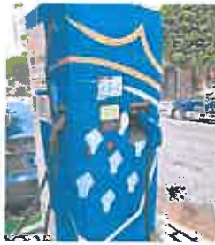
Uno de los puntos de recarga. Avra.

vancos y Alcalde Pedro Manuel Toledo, se sumarán a principios de 2023 a los dos de la Calle Mayor de Alcantarilla. Son estaciones de recarga dobles, con capacidad de cargar dos vehículos cada uno de forma simultánea, y dotados con un sistema de carga rápida, con una potencia de 50 Kw cada uno, capaces de cargar un coche eléctrico en 20 minutos.