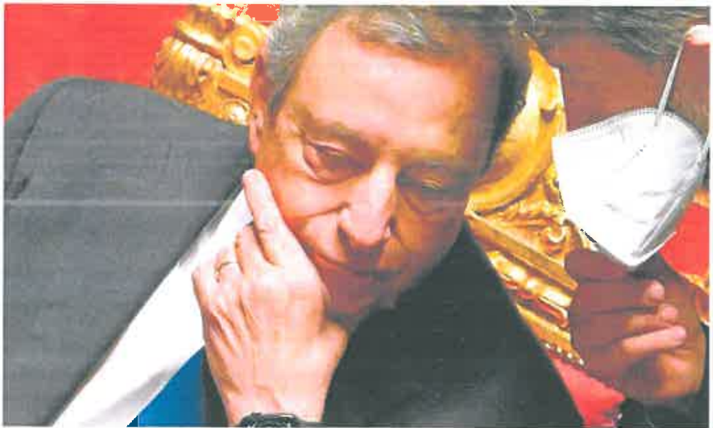
Mario Draghi escucha al ministro de Cultura, Dario Franceschini, durante la sesión que se celebró en el Senado.

El primer ministro había llamado horas antes a reconstruir el pacto que possibilitó el Ejecutivo de unidad nacional