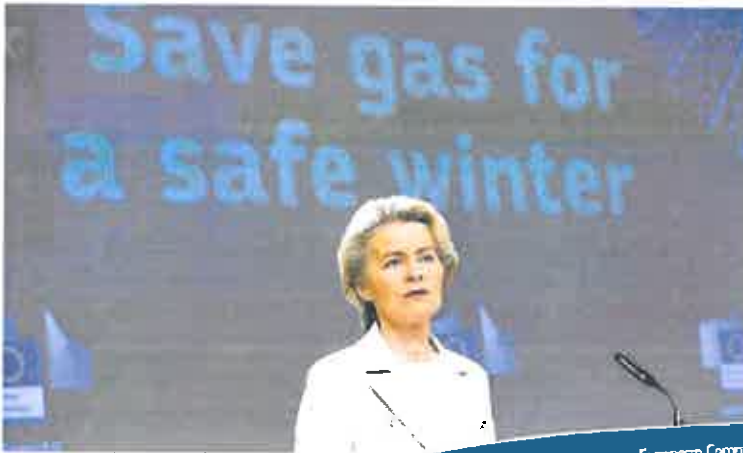
Ursula von der Leyen explica el plan de ahorro energético europeo, ayer en Bruselas.

► La Comisión Europea quiere lograr el aval de los veintisiete en la reunión de ministros de Energía de la próxima semana ► El plan permitirá ahorrar 45.000 millones de metros cúbicos del combustible