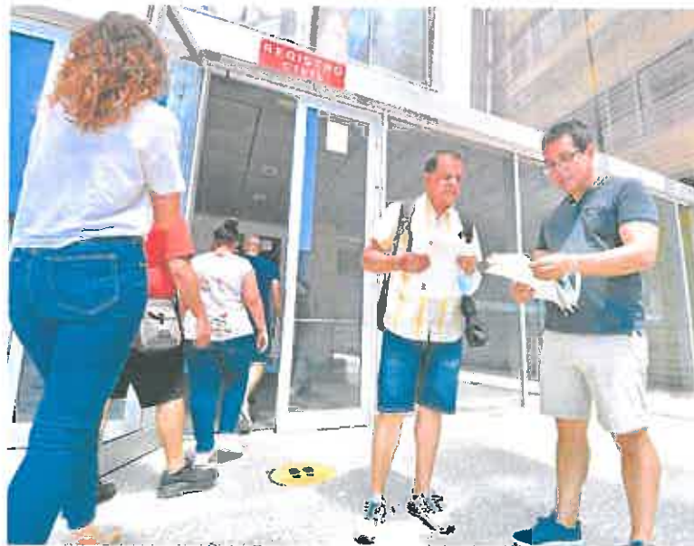
Varios ciudadanos, ayer, a las puertas del Registro Civil de Murcia.

«Las residencias tendrán de plazo hasta septiembre para manifestar su disponibilidad al concierto», dijo el presidente de Adermur.