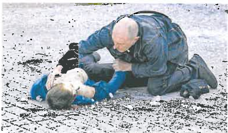
Un hombre, ante el cuerpo de un niño muerto en Járkov.