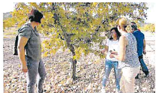
La directora general de Agricultura, Remedios García, ayer.

productos que suponen un alto coste para los agricultores y podría suponer un 30 o 40% de pérdidas en las explotaciones agrarias. La plaga del tigre en el almendro está descontrolada en la comarca del Altiplano ya que se han utilizado productos de baja efectividad.