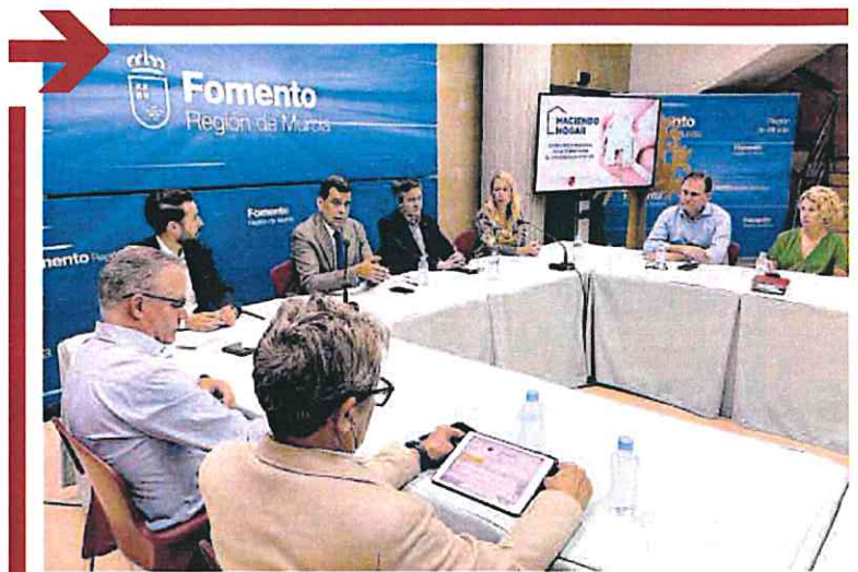
Reunión del Consejo Asesor de Vivienda de la Región de Murcia, ayer.