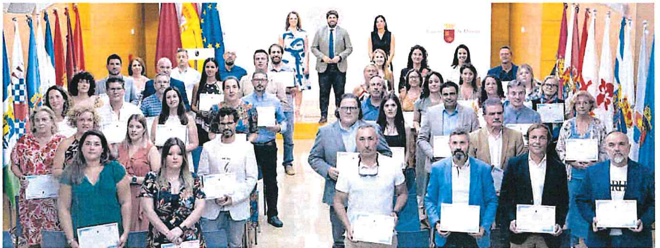
Acto de reconocimiento a las entidades adheridas a la tercera edición de la iniciativa 'Empresas por una sociedad libre de violencia de género'.