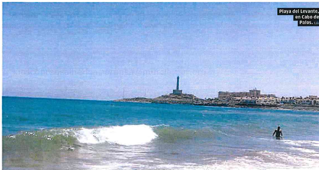
Playa del Levante, en Cabo de Palos. I.J.