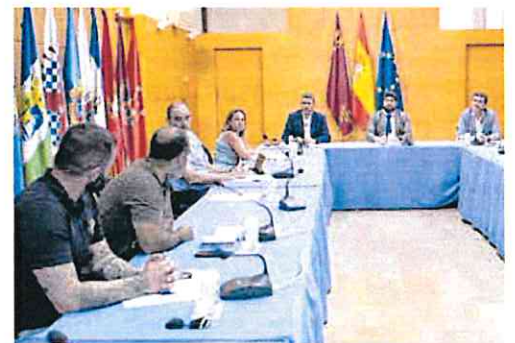
Reunión de López Miras con los bomberos.

De hecho, al respecto de las de julio de 2021 a diciembre de ese mismo año, se aprobó «en Comisión Permanente y en Junta de Gobierno del Consorcio un expe-