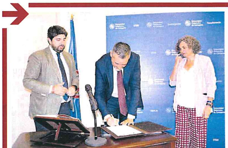
El nuevo presidente del Consejo Social de la UPCT, ayer, durante el acto.

La industria química y afines ocupa el segundo lugar de la industria manufacturera en aportación al PIB regional