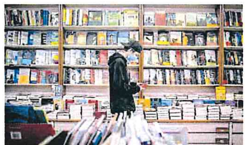
Un joven sostiene un libro en sus manos.

culturales con la siguiente distribución: 100 euros para productos físicos (libros, prensa o discos, entre otros), otros 100 para productos digitales (prensa digital, podcast, videojuegos en línea o plataformas de contenidos audiovisuales) y 200 euros para artes escénicas (teatro, ópera, cine, danza o museos).