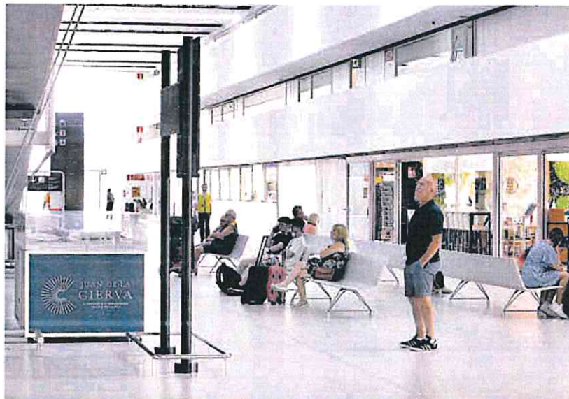
Interior del aeródromo, donde desde junio está la cartelería con el nombre del inventor.

► La Abogacía del Estado reclama la suspensión cautelar del acuerdo del Ejecutivo regional para la denominación, pues sostiene que el inventor tiene vínculos con el golpe de Estado que dio Francisco Franco en el 36