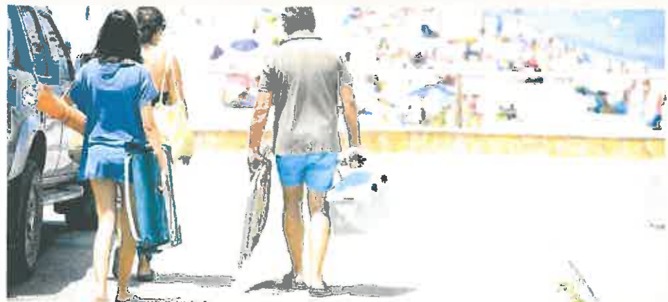
Una familia se dirige a la playa en Cabo de Palos.