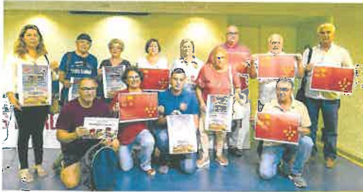
La presentación de las Marchas por la Dignidad el 9 de junio tuvo lugar ayer en Cartagena.

Hasta cuatro 'columnas' o marchas saldrán desde distintos puntos de la ciudad de Murcia a partir de las once de la mañana para unirse en la Gran Vía y continuar hasta el Jardín del Malecón, donde a su llegada se leerá un manifiesto. La 'columna verde' saldrá desde la Consejería de Educación, en la Avenida de la Fama; la 'columna azul' partirá desde la Consejería de Agricultura, en la Plaza Juan XXIII; mientras que la 'violeta' hará lo propio desde la calle Torre de Romo, en