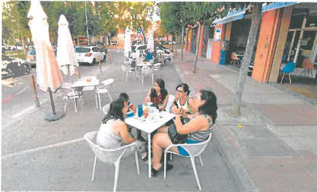
Clientes en la terraza instalada en una zona de aparcamiento en el barrio de San Basilio.