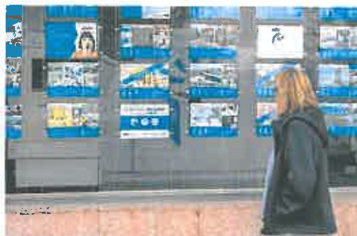
Una mujer observa el escaparate de una inmobiliaria con anuncios.

El Banco Central Europeo (BCE) seguirá los pasos de la Fed y empezará a subir el precio del dine-