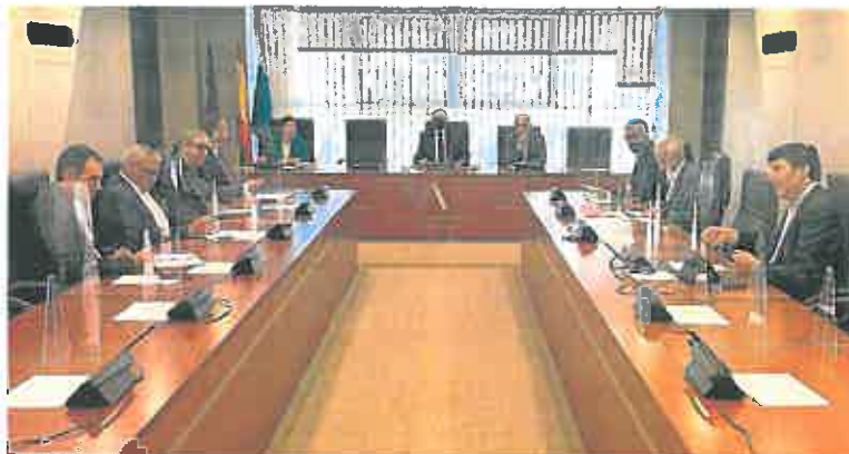
Componentes de la Junta de Portavoces, reunidos ayer para programar la actividad de la próxima semana.