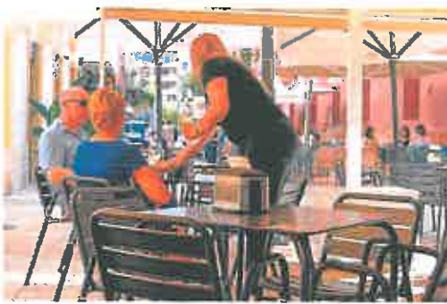
Una camarera atiende a unos clientes en la terraza de un bar.

Abellaneda hizo estas declaraciones durante la presentación de la segunda edición del evento 'Lorca, abierto por vacaciones' que prevé 48 actuaciones de grupos locales de todos los estilos musicales en calles y plazas de la ciudad las noches de los fines de semana de junio y julio.