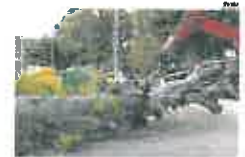
Uno de los árboles derribados.