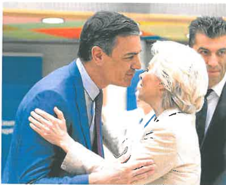
El presidente del Gobierno, Pedro Sánchez, y la de la Comisión, Ursula von der Leyen, ayer en Bruselas.