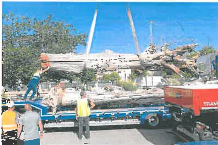
Operarios cargan en un camión dos de los enormes troncos de los eucaliptos, ayer.