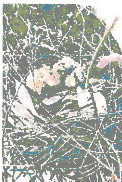
Uno de los nidos con polluelos rescatados tras la tala.