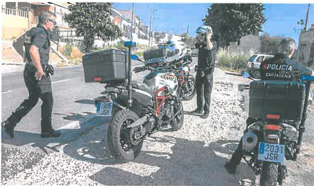
Control especial de tráfico realizado ayer por agentes de la Policía Local en Alumbres.