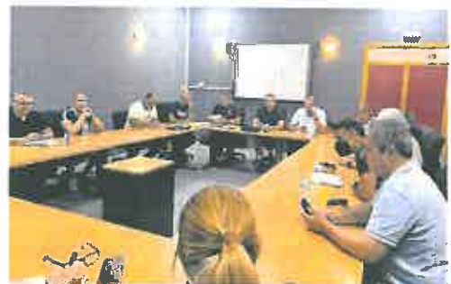
Reunión de CC OO y la nueva dirección de Emergencias.

De cara a la oferta de 2022, los representantes del Gobierno regional adquirieron el compromiso de establecer una mesa de negociación para tratar la propuesta de los sindicatos en cuanto a las necesidades de personal del Consorcio para que a través de la ampliación de una plantilla presupuestaria se creen 79 plazas, de las que 57 serían de bomberos, 9 cabos y un sargento.