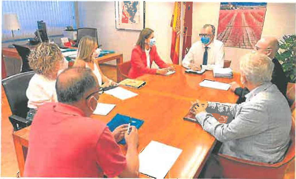
El consejero Pedreño, el director del SMS y la directora de Asistencia Sanitaria se reúnen ayer con los representantes de los coordinadores. CAMM

Las medidas deberán concretarse en un documento de acción antes de que acabe el año