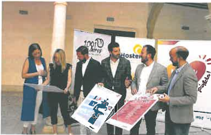
La presentación del programa 'Lorca, abierta por vacaciones', tuvo lugar ayer.