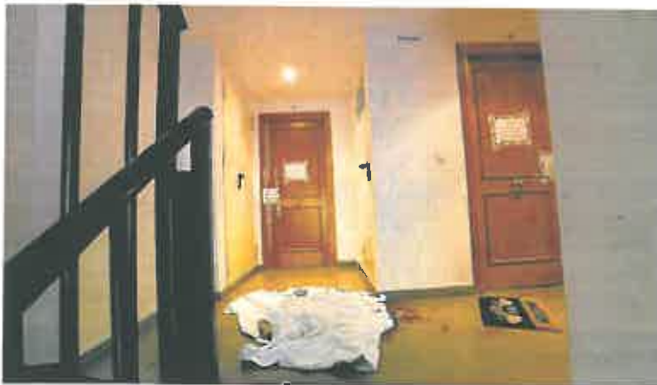
Restos de la asistencia sanitaria a la víctima sobre el sofá en el que tuvo lugar el asesinato.