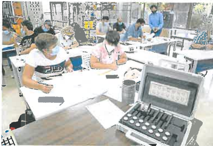
Alumnos de los cursos del SEF en el centro de FP de San Félix, en Cartagena.

En cuanto a la tasa de paro, la Consejería de Empresa y Empleo la sitúa en la actualidad en el