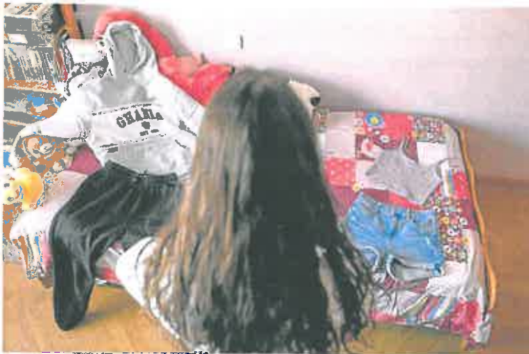
Una adolescente, de espaldas, en el interior de su cuarto. A. C.

Las ONG piden celeridad para formar a sanitarios y policías en detección precoz y más campañas para romper el silencio