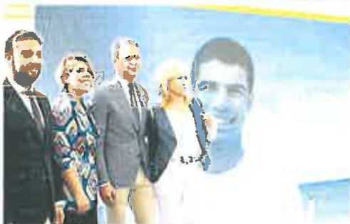
Presentación de la campaña turística de la Región.

En el PP están «convencidos de que todo se realizó con la legalidad y con informes favorables».