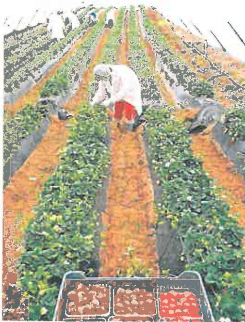
Temporeros de la fresa en Huelva.

Otra de las ideas es ampliar el modelo de los «temporeros» a otros sectores como la construcción, pero con ciertas mejoras en las condiciones. Por ejemplo, ofrecer permisos de cuatro años en vez de por temporada y, si el trabajador regresa a su país al finalizar su período de contratación, podría renovar después por otros cuatro. Por otro lado, el Ejecutivo abre la