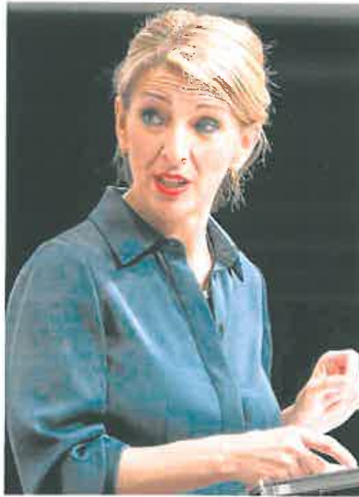
La ministra de Trabajo, Yolanda Díaz.