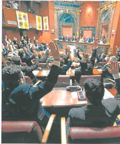
Momento de la votación unánime en la Asamblea para aprobar la reforma del Estatuto de Autonomía, en abril de 2019.