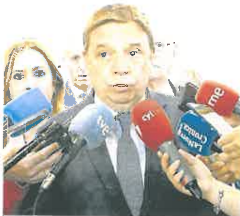
El ministro de Agricultura, Luis Planas.

Planas reconoció el trabajo y el esfuerzo de las comunidades de regante y por sumarse a la «oportu-