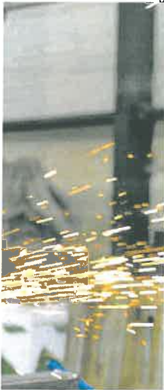
Varios operarios trabajan en una empresa del metal.