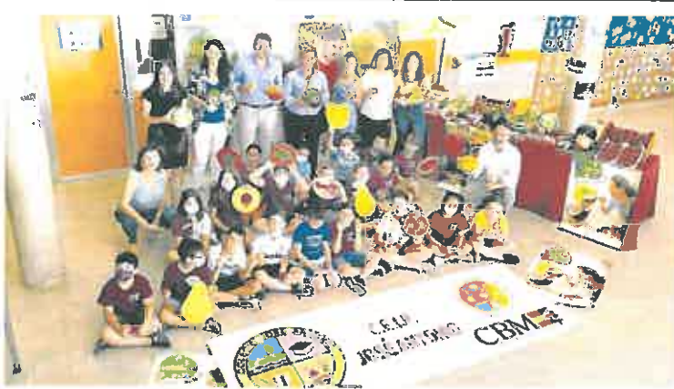
Presentación, ayer, del programa de reparto de fruta en el CEPI José Antonio de Fuente Álamo.