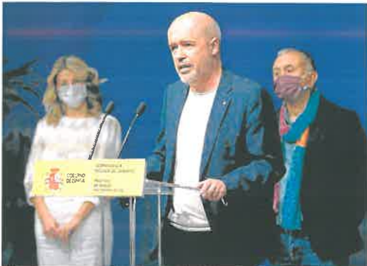
El líder de CC OO, Unai Sordo (c), junto a la ministra Yolanda Díaz y su homólogo de UGT, Pepe Álvarez.