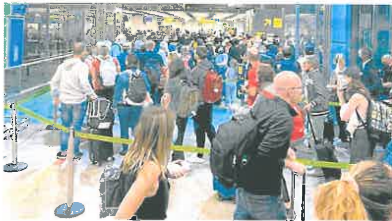
Largas colas de pasajeros en el control de pasaportes de la T4 del aeropuerto de Madrid-Barajas.

Tras conocerse la carta enviada a la compañía, las acciones de Twitter se dejaban más de un 4% tras la apertura de Wall Street y cotizaban en 38,59 dólares, muy por debajo de los 54,20 dólares del precio de la oferta de compra planteada.