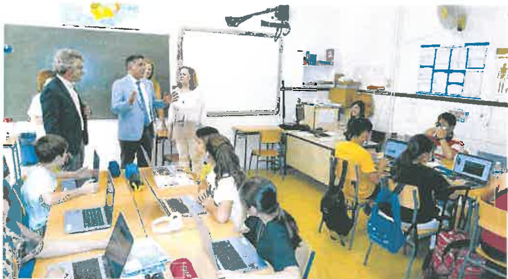
El alcalde visitó ayer el CEIP Andrés Baquero para presentar al proyecto de 'Patios Coeducativos'.