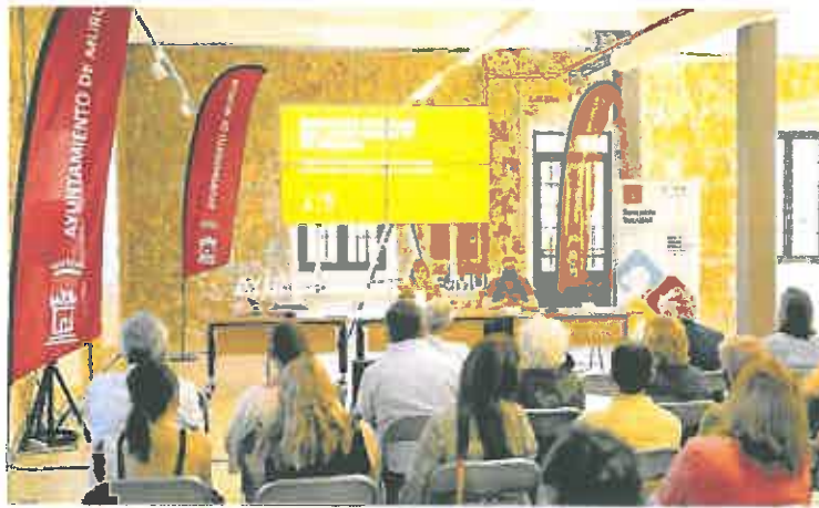
Presentación de la Memoria de 2021 de Servicios Sociales ante entidades y ONG.

Durante 2021 Servicios Sociales del Ayuntamiento de Murcia derivó a más de 25.500 personas a ONG de reparto de alimentos,