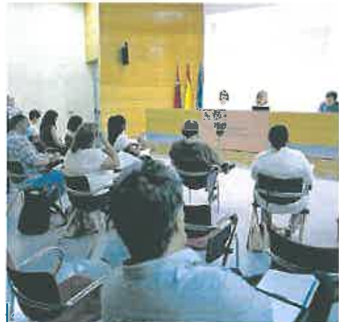
Isabel Franco preside el Foro de la Inmigración.

La vicepresidenta y consejera de Política Social, Isabel Franco, manifestó en la inauguración del Foro Regional de la Inmigración, en el que están representados los sindicatos y las ONG, que su departamento es consciente «de la necesidad de trabajar por la inclusión e integración