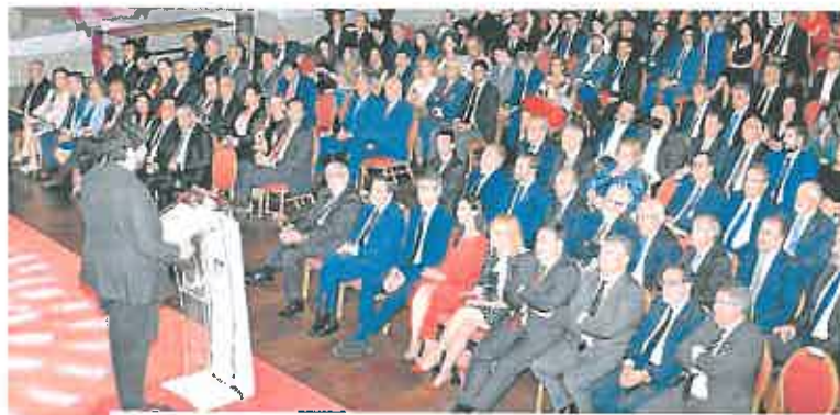
El presidente de la Comunidad, Fernando López Miras, dirigiéndose a los empresarios.

El parón ha dado alas a la Cámara de Comercio de Murcia para iniciar una nueva etapa de estos galardones (los más antiguos en el ámbito