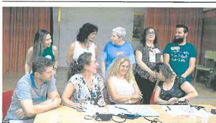
Representantes de los sindicatos y de los orientadores, en la rueda de prensa de ayer.

La Plataforma Colombine también presentó alegaciones contra la concesión de distinciones por el Día de la Región. «Consideramos que estos reconocimientos no obedecen al principio de igualdad efectiva entre hombres y mujeres (solo hay dos galardonadas). Esto no refleja la realidad de nuestra tierra y el talento de tantas mujeres queda invisible. La realidad social de la Región es diferente, las mujeres ocupan diversos ámbitos que también son merecedoras de reconocimiento institucional. Las mujeres referentes existen, y han de estar visibles porque su reconocimiento genera equidad y proyecta la idea de que es posible la igualdad real y efectiva».