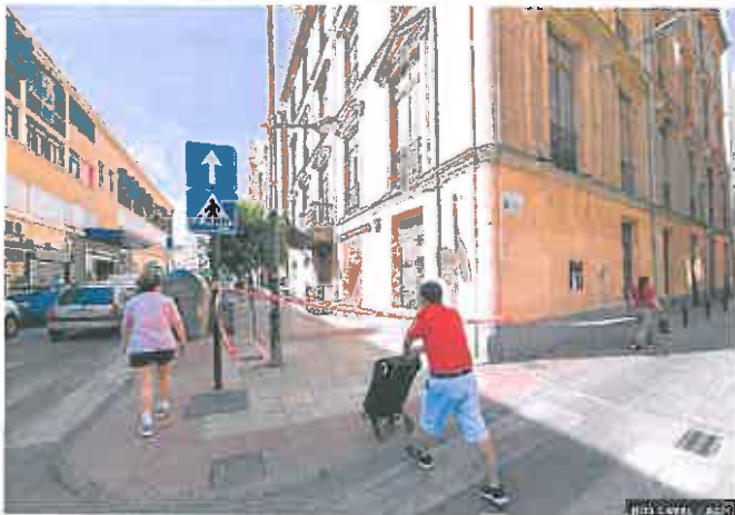
Cintas para evitar accidentes por la caída de cascotes

► Programa de accesibilidad. Con medidas como la lectura fácil, y en un futuro: documentos en Braille, intérpretes de lengua de signos en visitas y audioguías.