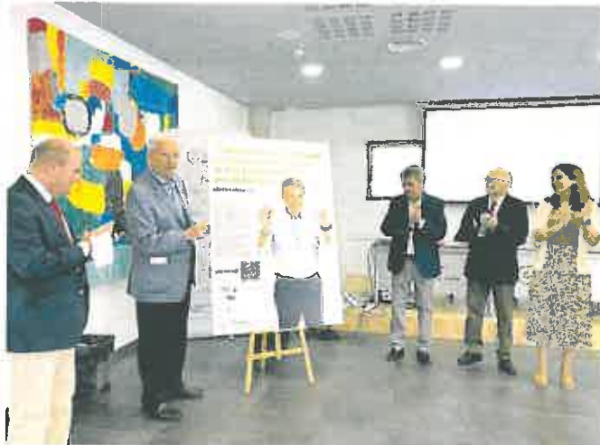
Presentación de la campaña ayer en la Asociación Contra el Cáncer de la Región de Murcia.

Desde la Asociación Española Contra el Cáncer también señalan que «es importante destacar que el cáncer de pulmón pasó de ser el cuarto tumor más diagnosticado en mujeres en las estimaciones para el año 2015, al tercero más incidente ya en el año 2020», un incremento que estaría claramente relacionado con el aumento del consumo de tabaco en mujeres.