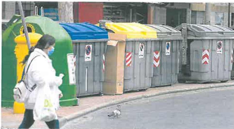
Una fila de contenedores para recoger diversos tipos de residuos, en una calle de Cartagena.

El impuesto sobre el uso del vertedero o la incineradora que impone la nueva Ley se convertirá en un 'incentivo' a la separación: del plástico, el vidrio, el papel y demás materiales recicla-