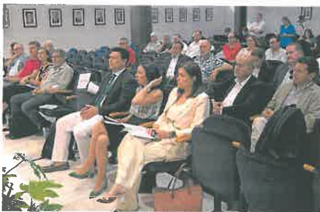
Un momento de la asamblea de la Federación de Municipios celebrada ayer en San Javier.

«Falta una apuesta por una educación ambiental para darle continuidad a la conciencia sostenible»