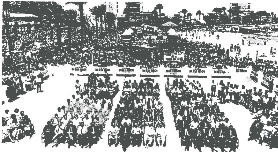
Acto de celebración del Día de la Región de Murcia en 1988 en Santiago de la Ribera, con importante concentración de público. JUAN REAL

Si se compara todo lo organizado hace 32 años con lo que se va a celebrar hoy, se puede decir aquello de que cualquier celebración del 9-J pasada nos parece mejor. Por no hablar de la gala 'Murria, qué hermosa eres', que durante 12 años (de 1997 a 2009) llevó a la Región a los mejores ar-