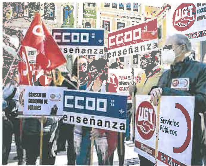
Protesta de los sindicatos frente a la Universidad durante el Consejo de Gobierno de abril.

Ahora la Universidad pretende aplicar un modelo transitorio