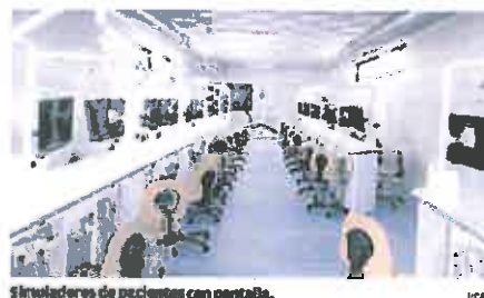
Simuladores de pacientes con pantalla.

Odontología en inglés, cuya implantación ha incrementado la presencia de alumnos internacionales en el campus de la UCAM de Cartagena, en el que también se imparten los grados en Enfermería, Medicina, Criminología, Ciencias de la Actividad Física y Deporte y Fisioterapia.