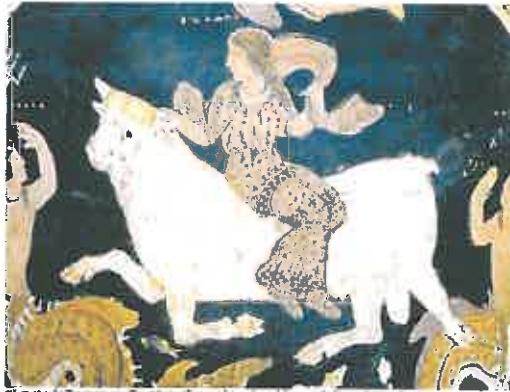
El rapto de Europa por Zeus transformado en toro blanco. C. 460-450 a. C.

La violencia física, sexual y psicológica ejercida por las divinidades del panteón grecorromano estaban a disposición de los hombres y de las mujeres de la época. El rapto, considerado un crimen contra la propiedad, pues se trata del robo de un cuerpo que pertenece a un padre o mar-