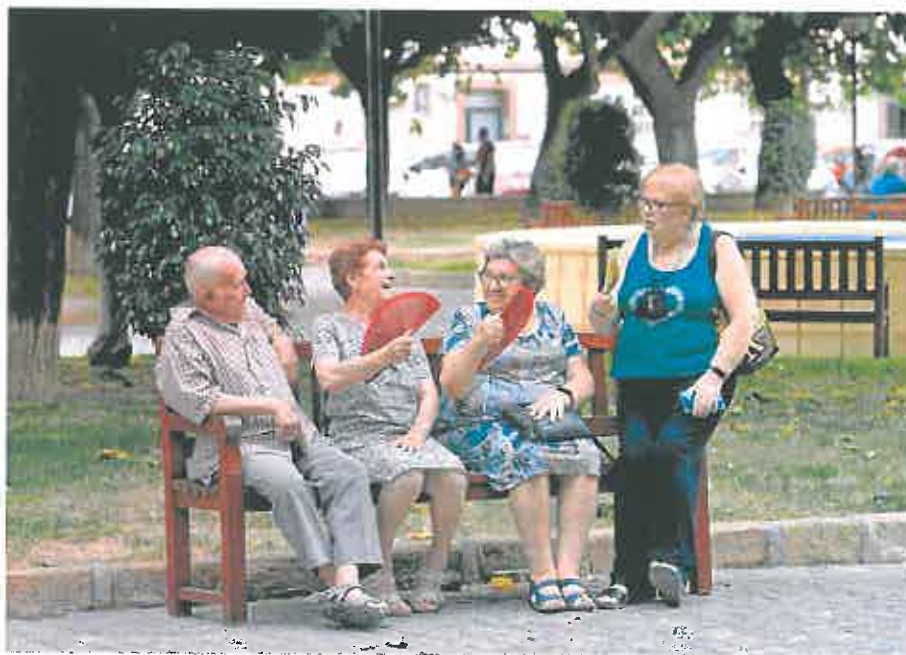
Un grupo de mayores combate el calor con abanicos en un Jardín de San Basilio mientras conversan.

La plaza del Cardenal Belluga fue el escenario elegido ayer para presentar el nuevo contrato, para el que se destinarán 3,2 millones de euros en los próximos tres