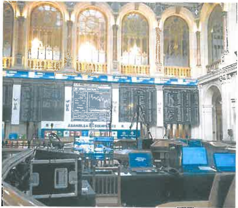
Interior del salón principal de la Bolsa de Madrid.

Sin embargo, Herrero dejó claro que aunque los datos puedan reflejar una senda bajista, la posición del país es «frágil y vulnerable», pues ese ajuste esperado