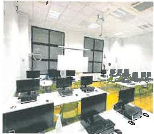
Aula de informática ofrecida a los ucranianos.

La UMU ha habilitado una página web para los refugiados ucranianos con intereses universitarios para que conozcan los ser-