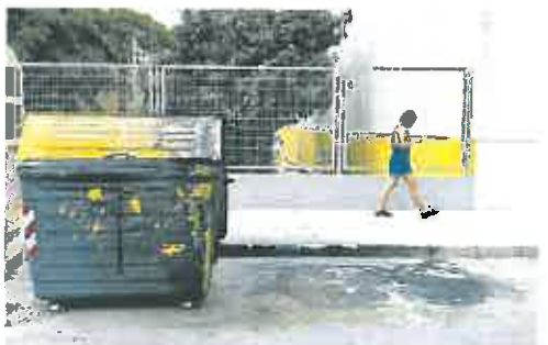
Una persona pasa junto a un contenedor que quemaron.