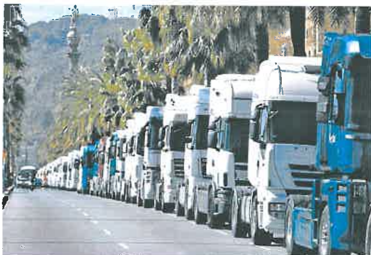
Una larga cola de camiones movilizados en la huelga del pasado mes de marzo.

La aprobación definitiva del Fondo llegaría este mismo verano, el peor escenario posible con los costes de los combustibles en récord.