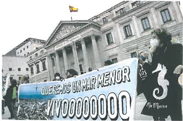
Concentración frente al Congreso de los Diputados en defensa del Mar Menor.

La Comisión será la que vote el texto definitivo y de ser aprobado, al tener este órgano plenas competencias, la proposición de ley no pasará por el pleno del Congreso sino que saltará al Senado. En la Cámara Alta se abrirá otro periodo de enmiendas. Si hay modificaciones en el texto, este volverá al Congreso para que sea de nuevo validado; pero si no, la ley será definitivamente publicada en el Boletín Oficial del Estado, momento en el que entrarán en vigor los derechos propios del Mar Menor.