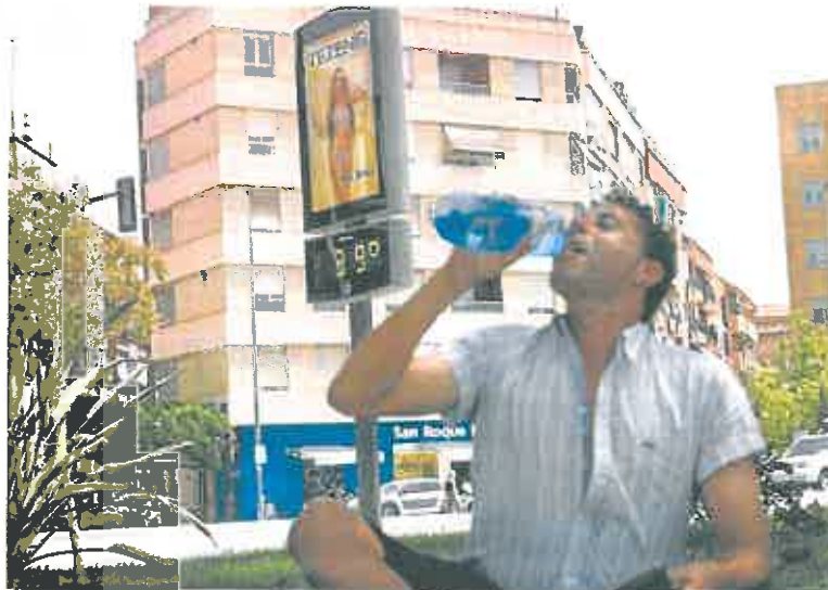
Un hombre bebe agua junto a un termómetro que marca 35 grados, en Murcia.

«La sentencia está bien armada, pues no se limita a señalar que la interpretación de la cláusula espejo debe ser la de la Fundación, sino que acude al proyecto de segregación de 2011, indicando que a pesar de la titularidad formal de algún elemento, la Caja transferirá al Banco CAM el valor económico de los derechos u obligaciones derivados de dichos elementos de activo o pasivo desde la fecha de efectos contables de la segregación», apuntan.