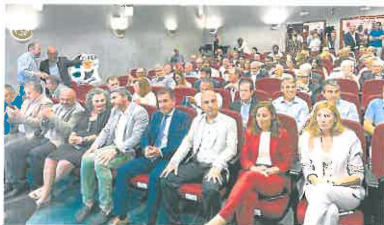
Participantes en el acto que el Cifea llevó a cabo para conmemorar sus 50 años de andadura. J. L. VIVAS

La iniciativa apuesta, entre otras cuestiones, por la adecuación, mejora y revitalización del casco histórico y zona alta de Mula. Lo hace a través de actuaciones ligadas a otros programas ya puestos en marcha, como el Proyecto Kairós o el Plan Director del Castillo de Mula.