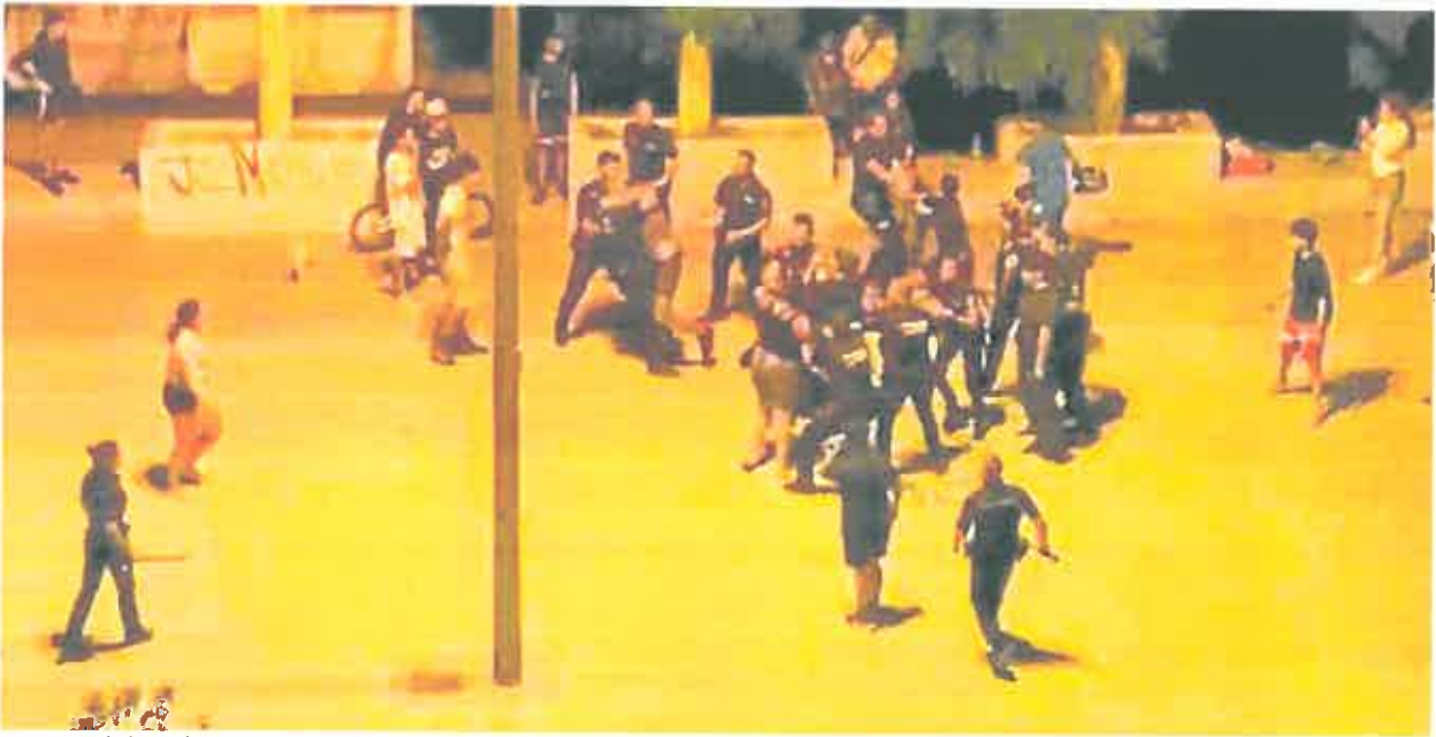
Imagen tomada de uno de los vídeos grabados por vecinos durante la reyerta en la plaza de la calle Rubí donde está el local social de la Urbanización Mediterráneo. w