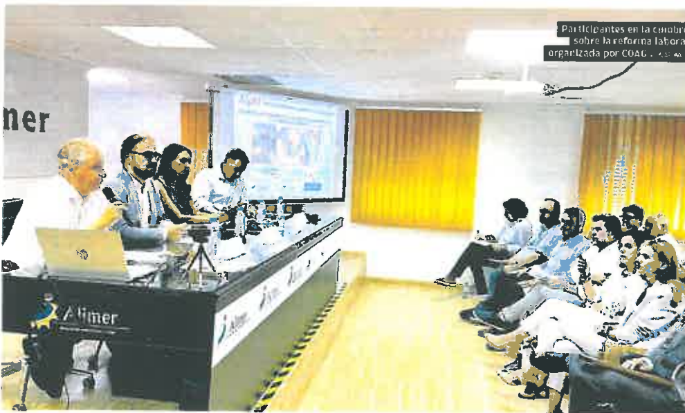
Participantes en la cumbre sobre la reforma laboral organizada por COAG.

El endurecimiento de las sanciones aumenta la incertidumbre