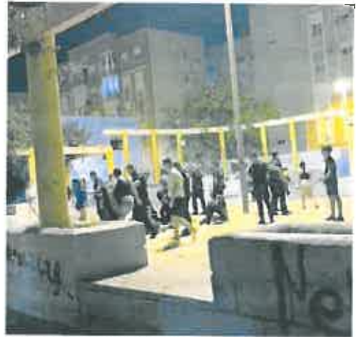
Participantes en el suceso en Urbanización Mediterráneo.

Desde el Ayuntamiento de Cartagena subrayaron que «es absolutamente intolerable» que ocurra algo así «en una sociedad presuntamente democrática» y remarcaron que «las faltas de respeto a los agentes de la autoridad no se pueden consentir y, mucho menos, las agresiones».