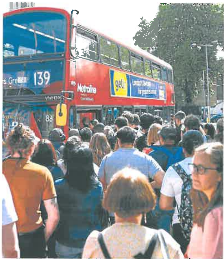
Numerosos pasajeros hicieron cola en la estación londinense de Waterloo.

Los sindicalistas afirman que la oferta de los directivos del sector del ferrocarril es un aumento del 2%. Ellos habrían pedido 7%. Reprochan al Gobierno una supuesta ocultación detrás de las empresas que son públicas o, en el caso de las franquicias que operan las líneas, son controladas financieramente por el Ministerio de Transportes tras