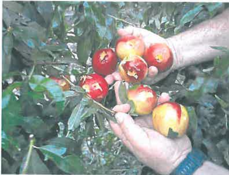
Un agricultor de Cieza muestra los daños provocados por el pedrisco en un nectarino.

Pero la tromba de agua ocasionó más incidentes. En Cieza, un indigente que se encontraba alojado debajo de un puente de la rambla del Realejo tuvo que