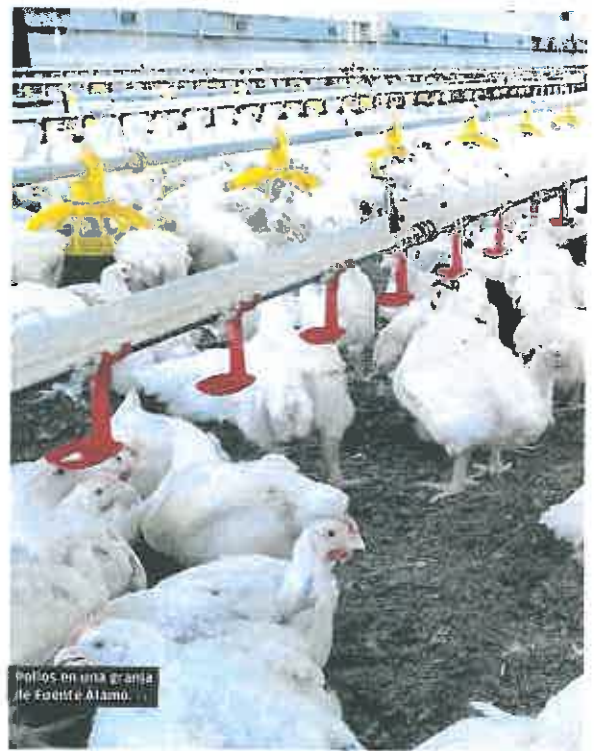
Pollos en una granja de Fuente Álamo.

Precisa que «la media de edad es de las más bajas» del sector agrario, dado que ronda los 45 años, a pesar de la falta de relevo generacional. «Mucha gente joven ha realizado inversiones en este sector», señala, aunque la organización agraria crítica que muchas de las compañías destinatarias «siguen trabajando sin firmar contratos con los granjeros y sin permitirles cubrir sus costes de producción».