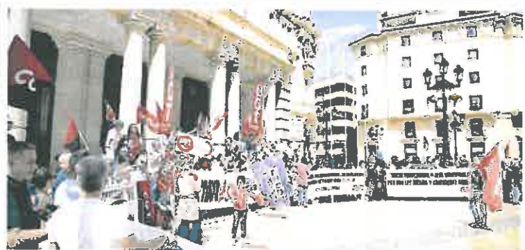
La marcha sindicalista de Cartagena culminó frente al Palacio Consistorial.