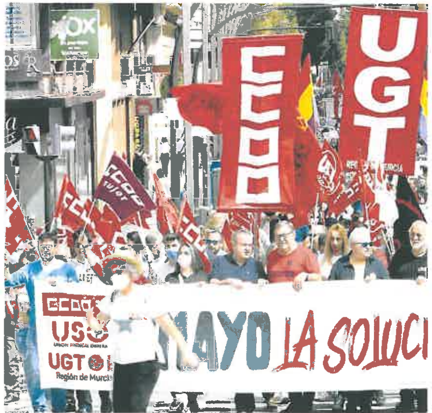
Miles de personas llenaron la Gran Vía de Murcia para reivindicar sus derechos laborales ante las amenazas presentes derivadas de la inflación y la falta de actualización de los convenios colectivos.