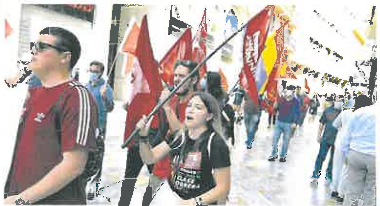
La Juventudes Comunistas no faltaron a su cita con el Día del Trabajador.