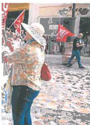
LA CANTINERA FERIA DE MURCIA. A. EL BORGUEÑO

Desde UGT solicitan que el texto se adapte a «las nuevas realidades productivas y regule las causas y el precio del despido», además de asegurar medios suficientes a la Inspección de Trabajo para hacer cumplir las leyes. Por su parte, el Ejecutivo reconoce que «toca cambiar la realidad de arriba a abajo frente al viejo estatuto que tenía tintes autoritarios».