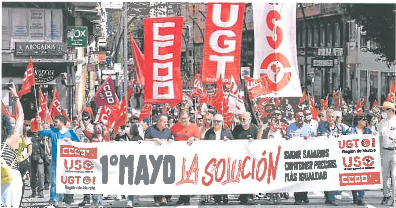
Manifestantes recorren ayer, domingo, la Gran Vía murciana en la marcha del Primero de Mayo.