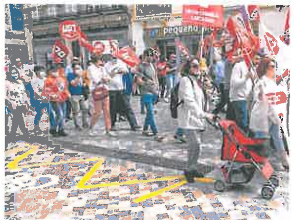
Una turista toma imágenes de la manifestación del 1º de mayo en Cartagena, en