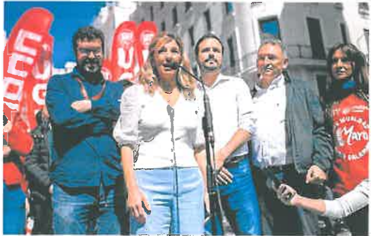
La vicepresidenta Yolanda Díaz y el ministro Alberto Garzón, en la manifestación del Primero de Mayo, ayer. »

Las últimas semanas son claro ejemplo de ello. Cuando toda-