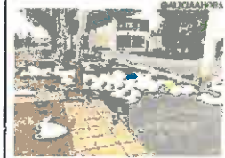
Restos del festival Intercampus