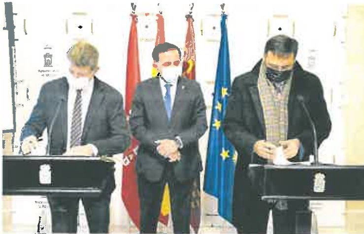
Firma del convenio de colaboración entre Ayuntamiento y Amusal en diciembre

► Se encargará de realizar informes para conocer el nivel de implantación de este modelo y detectar oportunidades de negocio en el municipio