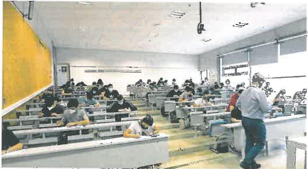
Los alumnos realizaron las pruebas de acceso a selectividad siguiendo las medidas de prevención ante la covid.

Castilla y León tiene una media en sus alumnos de bachillerato