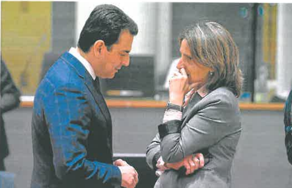
La ministra de Transición Ecológica, Teresa Ribera, charla con su homólogo griego Konstantinos Skrekas.

rían serían los clientes del mercado regulado (el denominado PVPC), dado que su tarifa está vinculada a ese mercado. La rebaja conseguida por Madrid y Lisboa, que en principio tendrá una aplicación de 12 meses, resulta notable frente a los 90 euros a los que ahora se mueve el gas en el mercado. Sin embargo, es menos ambiciosa que la propuesta inicial de 30 euros que habían defendido en un principio España y Portugal. Las reticencias mostradas por algunos socios europeos, especialmente por Alemania, y la presión de buena parte del sector eléctrico para evitar la propuesta, obligó al final a ceder a los ejecutivos ibéricos en este sentido. Pese a ello, y con el pacto político bajo el brazo, no hay riesgo de que la medida no se ponga en marcha en las próximas semanas. Pero no es menos cierto que el hecho de que su aprobación definitiva en el Consejo de Ministros vaya a retrasarse implica que el consumidor también tardará más en notarlo en la factura.