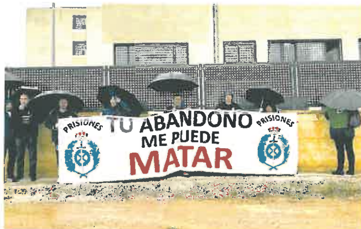
Funcionarios protestaban por la visita del secretario de Instituciones Penitenciarias.