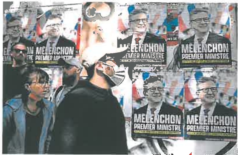
Manifestantes el pasado 1 de mayo caminan ante carteles en los que se lee 'Mélenchon primer ministro'.

Los ecologistas y La Francia Insumisa se han puesto de acuer-