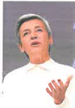
Margrethe Vestager, ayer.

De acuerdo con la investigación de Bruselas, que comenzó en junio de 2020, el gigante tecnológico no permite o restringe