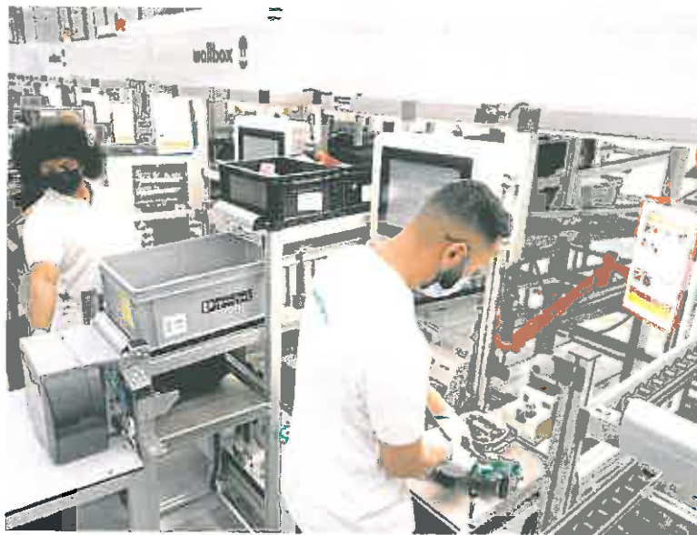
Trabajadores en la nueva fábrica de la empresa Wallbox en Barcelona, el pasado mes.

Es cierto que siempre que el dato se sitúa por encima de 50 indica expansión. Es decir, la actividad ha crecido. Pero a un ritmo prácticamente nulo y muy por debajo del 54,2 registrado en marzo, que ya había caído desde el 56,9 de febrero. Además, la de abril es la peor lectura del dato de los últimos 14 meses y, lo que es peor, se ha situado por debajo de la referencia de 54 que esperaba el consenso del mercado. Así que queda