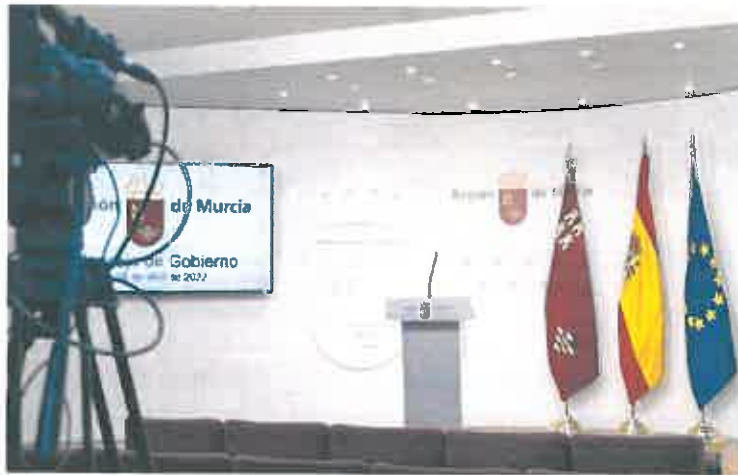
Sala de prensa del Palacio de San Esteban, sede la Presidencia del gobierno regional.

Según los datos que aparecen en el Portal de la Transparencia, las consejerías y la Secretaría General de Presidencia tienen más de 40 personas contratadas como personal eventual, incluyendo los jefes de gabinete.