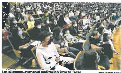
Los alumnos, ayer, en el auditorio Víctor Villegas.