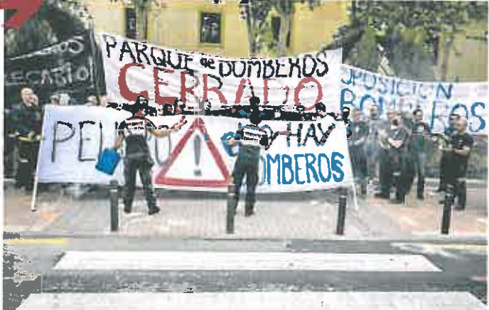
Un momento de la protesta de los bomberos, ayer en la puerta de San Esteban.

Adquieren 115.000 dosis de vacunas contra la difteria, tétanos, tosferina acelular, entre otras enfermedades