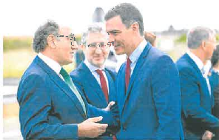
El presidente de iberdrola, ignacio Galán, y el jefe del Ejecutivo, Pedro Sánchez, ayer en Valencia.

Además, indicó que las previsiones remitidas a Bruselas «tienen en cuenta los tipos medios de la deuda emitida» por el Tesoro.