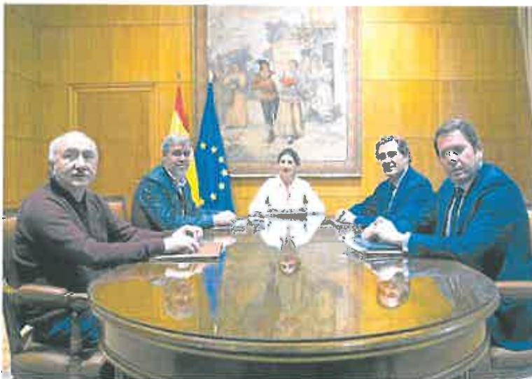
Los líderes de UGT, CC OO, CEOE y Cepyme, con la ministra de Trabajo, Yolanda Díaz. ÁNGEL DE ANTONIO

Por el contrario, sobre cual sería la subida para este año las posiciones estaban bastante cercanas, puesto que la patronal estaba dispuesta a aceptar la última propuesta de los sindicatos: alzas del 3,5% en 2022, del 2,5% en 2023 y del 2% en 2024, pero sin ningún tipo de blindaje.