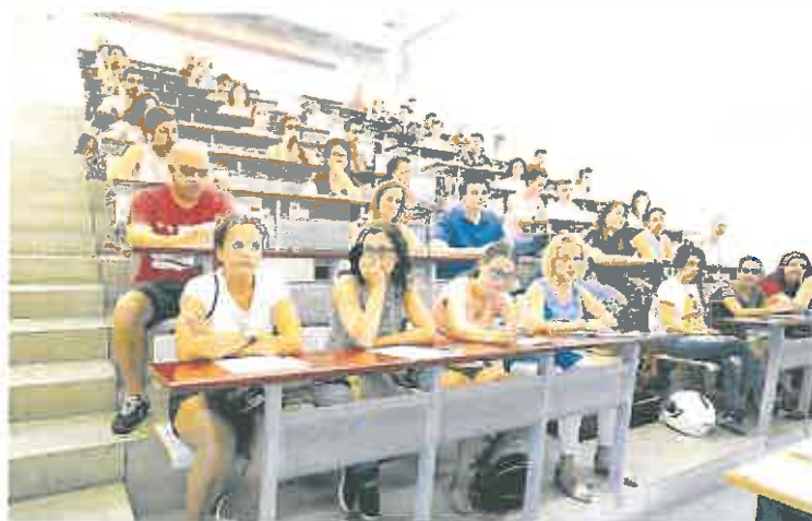
Opositores durante una de las convocatorias del Servicio Murciano de Salud.

Del total de las plazas, 1.057 se convocarán por el sistema de concurso-oposición.