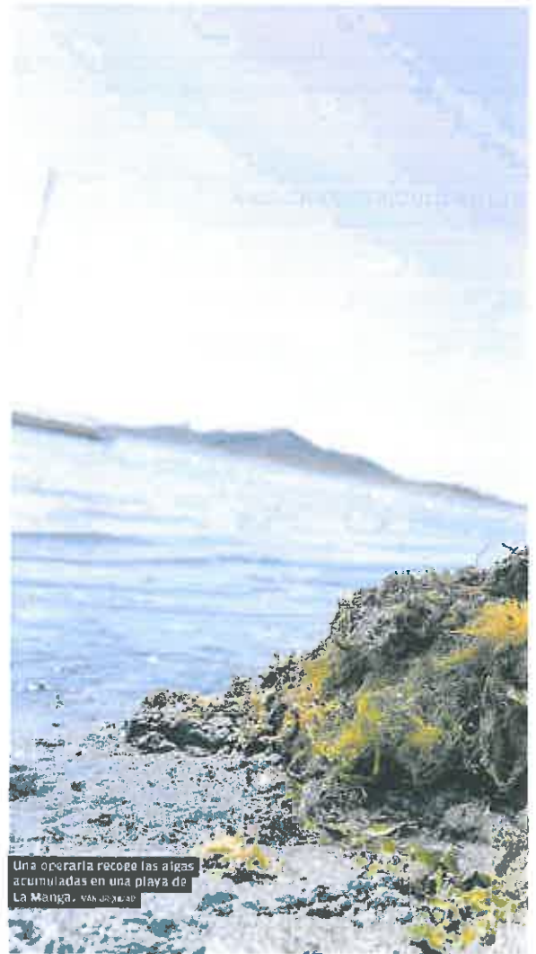
Una operaria recoge las algas acumuladas en una playa de La Manga.

Su previsión es que la campaña de verano volverá a rozar el lleno total en estas localidades costeras, tal y como ocurrió el pasado año. Da por hecho que la incertidumbre generada por la pandemia y por el conflicto bélico en Ucrania espolearán el turismo nacional, mientras que las salidas al extranjero seguirán siendo inferiores a las que se registraban antes del coronavirus. «La gente no va a salir mucho al extranjero por los coletazos de la pandemia y la guerra», augura.