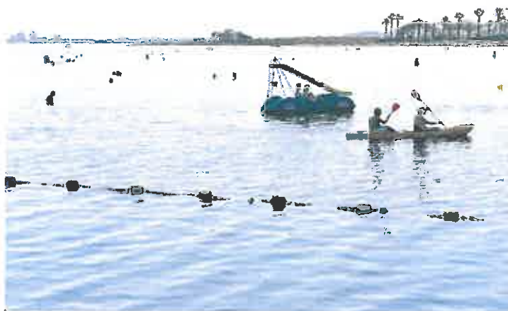
Redes antimedusas en una playa de Cartagena.

A juicio del secretario general del PSRM-PSOE, el Gobierno regional no está cumpliendo sus competencias porque sus dirigentes «están en otros temas», como «salvar sus puestos» y «quedar bien con Génova», en referencia al nuevo presidente del Partido Popular, Alberto Núñez Feijóo.