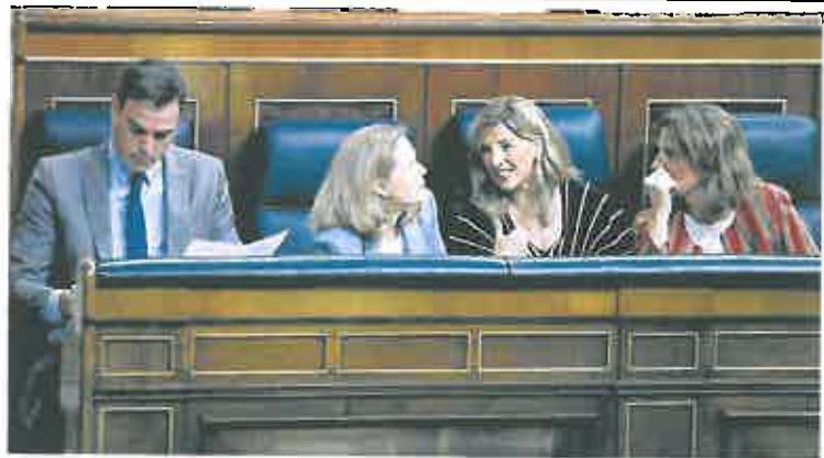
Calviño y Díaz, en el centro de la imagen, hablan el pasado lunes en el Congreso.

La propuesta del Ministerio de Igualdad no acaba de convencer a todas las carteras. Se ha llegado a un acuerdo con Sanidad, que es coproponente del texto, pero hay diferencias con el de Inclusión, Seguridad Social y Migraciones. Es-