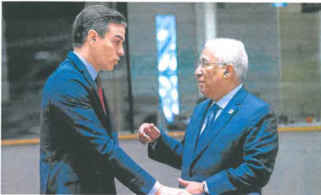
El presidente del Gobierno, Pedro Sánchez, y el primer ministro de Portugal, Antonio Costa, en el último Consejo Europeo.

Al próximo Consejo Europeo, que tendrá lugar a finales de mayo, podría llegar una propuesta para limitar de forma generalizada la cotización del gas en el mercado. Con ello se buscaría amortiguar el incremento de precios energéticos que sufren todos los países. Así, la independencia eléctrica ibérica se extendería entre todos los socios, aunque es una realidad aún lejana.