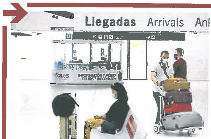
Pasajeros en las instalaciones de Corvera, el pasado viernes.

El Consejo de Gobierno aprobó también incrementar el gasto de personal del Consorcio de Extinción de Incendios y Salvamento de la Región (CEIS) para realizar la mayor oferta pública de este ente en su historia. El objetivo es convocar hasta 70 plazas, con un aumento en el gasto de personal de 1,2 millones de euros, y alcanzar los 26.288.628 euros en este ejercicio.