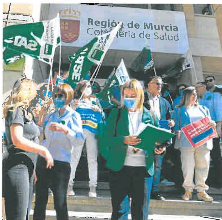
Representantes de Satse, ayer, durante la concentración ante la Consejería de Salud.

En este sentido, Blaya hizo referencia a la promesa «incumplida» de incorporar 800 nuevos profesionales que el Ejecutivo autonómico realizó cuando el anterior consejero de Salud, Manuel Villegas, aún ostentaba el cargo. «Se estuvo trabajando en ello al principio, pero se dio