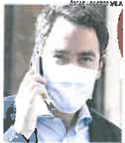
Teodoro García Egea.

Además, explica que la periodista publicó la imagen de la conversación de WhatsApp como «soporte gráfico» de una noticia publicada y, por lo tanto, su labor periodística está «amparada» en el Derecho Fundamental a la Libertad de Información recogido en el artículo 20 de la Constitución.