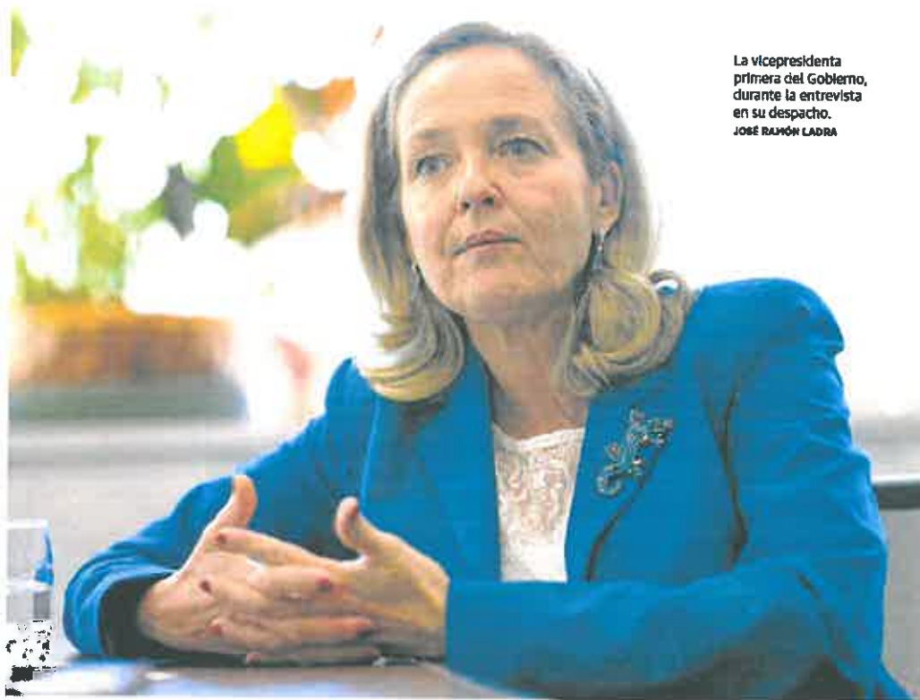
La vicepresidenta primera del Gobierno, durante la entrevista en su despacho.

dos tenemos un interés común en que se mejoren los sistemas de seguridad.