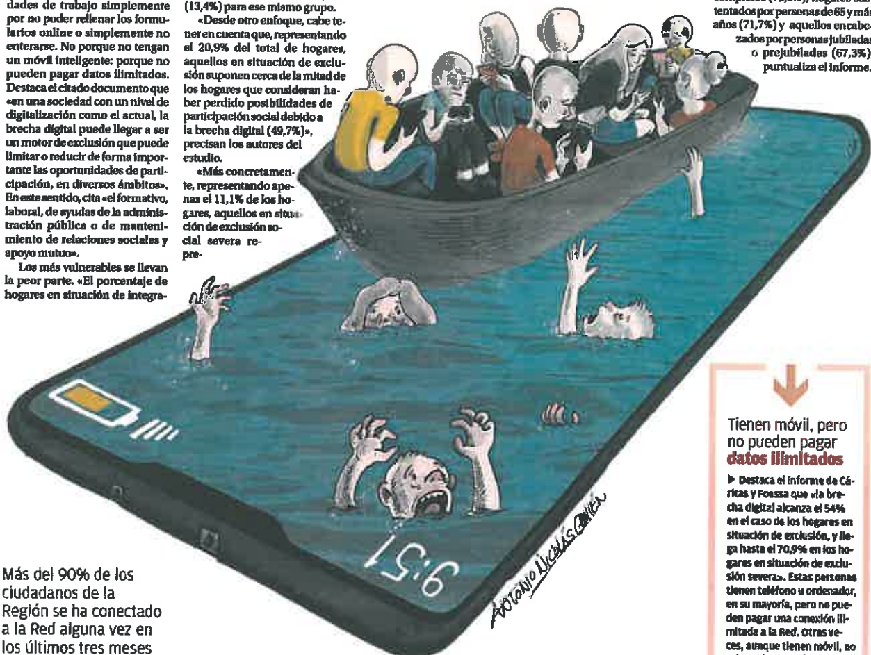
ILUSTRACIÓN: ANTONIO NICOLÁS GUILLÉN

Más del 90% de los ciudadanos de la Región se ha conectado a la Red alguna vez en los últimos tres meses