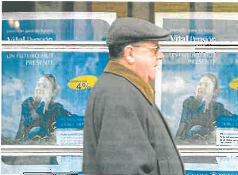
Anuncios de planes de pensiones, en una imagen de archivo. IGOR AZPURI