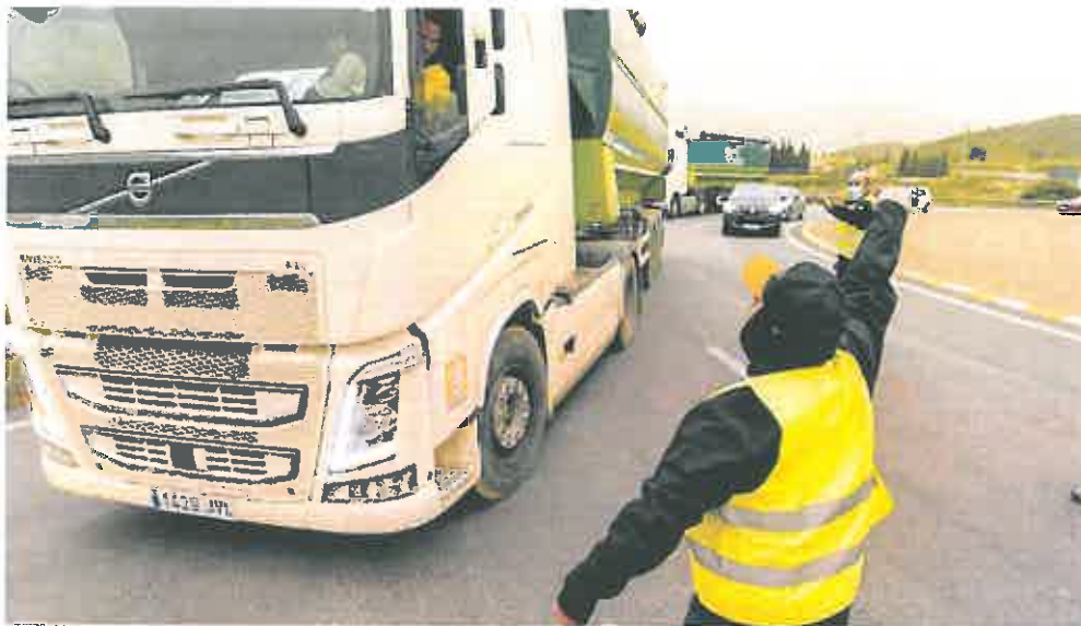
Varios miembros de un piquete paran un camión cisterna a la entrada del puerto de Cartagena durante la huelga de marzo.

► La Froet calcula que las empresas del sector necesitan unos 1.000 conductores que no consiguen encontrar. La patronal del transporte confía en que el convenio firmado con el Ministerio de Defensa para formar al personal de las Fuerzas Armadas cuando abandona el Ejército permite a las compañías conseguir conductores, pero también profesionales de mantenimiento y de la logística. La organización impartirá formación y orientación laboral al personal militar y facilitará información sobre los cursos programados por la Escuela de Conductores de Froet.