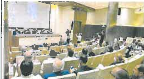
Encuentro de inspectores celebrado ayer en Murcia.

Asimismo, destacó su «competencia y flexibilidad», que «les ha permitido colaborar de manera decisiva en numerosas actuaciones en los momentos más duros de la pandemia».