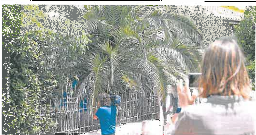
En la imagen, la vivienda abandonada donde supuestamente se produjeron las violaciones.

Si no hay violencia ni coacción, tal acción se castigará de 1 a 3 años de cárcel. Si la intimidación está presente, tendrá la actual pena de 3 a 6 años. Por idéntico criterio, la tercería locativa es el mero uso de un local para lucrarse con la prostitución. Habría delito sin que hiciera falta probar la explotación o sin importar si la mujer ejerce la actividad de forma voluntaria. Se consideraría un tipo agravado de proxenetismo, penado con 2 a 4 años de prisión, más una multa y el cierre del negocio.