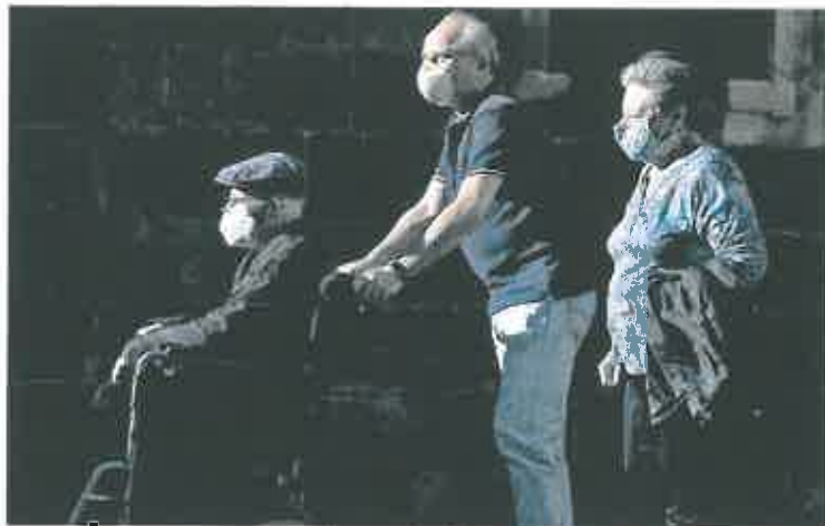
Un pensionista, acompañado por sus familiares en un barrio de Barcelona.

De momento, para 2023 el Banco de España plantea sumar las pensiones al pacto de rentas que reclama para repartir los costes de la inflación. Desde este punto de vista, en 2023 solo deberían subir según el IPC las pensiones mínimas. El organismo advierte de que extender esta práctica al conjunto de los pensionistas -tal como establece la reforma de la Seguridad Social- «conlleva necesariamente que otros agentes de la economía nacional (los perceptores de rentas del trabajo y del capital) tengan que asumir una parte mayor de esos costes». Esa propuesta choca con la decisión del Gobierno, que prevé una subida de las pensiones el año próximo en el entorno del 6%, en li-