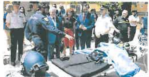
Uno de los equipos expuesto en la jornada de Aresmur.

sección de la Fremm a los representantes de las Fuerzas de Seguridad, con las que el sector mantiene una estrecha colaboración. La jornada concluyó con una exhibición de equipos de protección y técnicas empleadas en la seguridad.