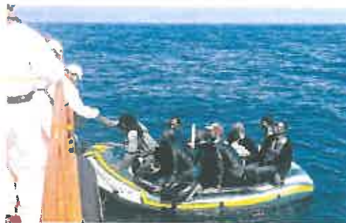
Salvamento Marítimo se encarga de rescatar a los inmigrantes. L.A.

embarcación con 17 inmigrantes a bordo -14 varones, una mujer y dos niños- a 15 millas náuticas al sur del Monte de Las Cenizas, y otra con once personas a 45 millas náuticas al sur del mismo monte. Por último, el Servicio Marítimo 'Río Ayliza' rescató una embarcación