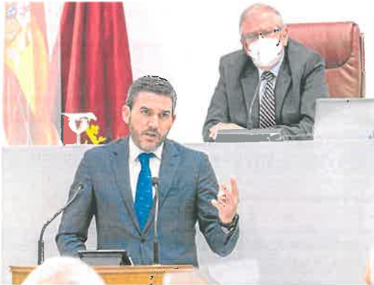
El consejero de Agua, Agricultura y Medio Ambiente interviene en la Asamblea.