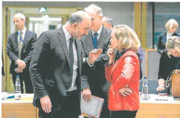
La vicepresidenta Nadia Calvino, en uno de los Eurogrupos que se celebran en Bruselas.

La cotización del euro frente al dólar se colocó en 1,0555 'billetes verdes', mientras que la prima de riesgo española se situó en 110 puntos básicos, con el interés exigido al bono a diez años en el 2,072%.