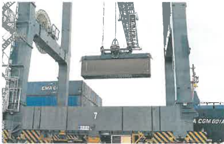
Tránsito de contenedores del Puerto de Cartagena.

Alemania, que es uno de los grandes clientes de los productos murcianos, aumentó un 25% las compras