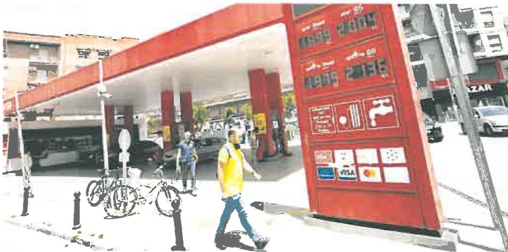
Precios de los carburantes en el surtidor de una gasolinera de Murcia, ayer.