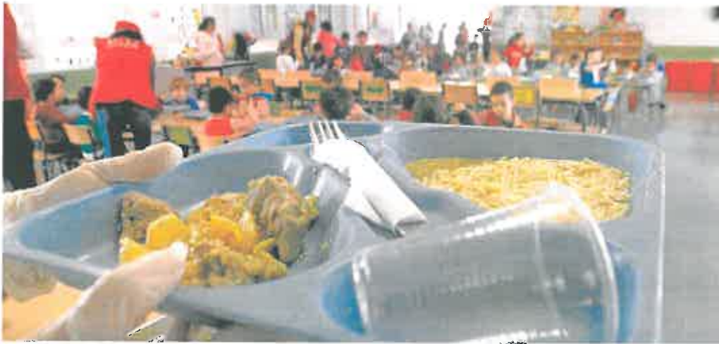
Servicio de catering en el comedor del colegio Atalaya, en Cartagena, en una fotografía de archivo.