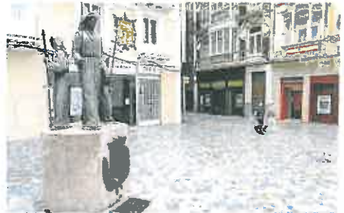
Monumento al Procesionista.

El acusado ha sido condenado a abonar el importe por los daños que ocasionó al monumento, cifrados en 1.294,70 euros, ya pagar una multa de 3 euros diarios durante seis meses, cuantía que asciende a unos 550 euros aproximadamente. El juez dictó ayer una sentencia de conformidad, ya que el acusa-