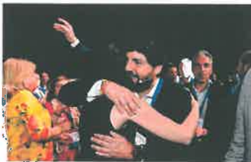
Fernando López Miras abraza a Isabel Díaz Ayuso.

Con respecto a la Región, recaló que «en mitad de una crisis económica y social, con la inflación disparada, con familias que no pueden llegar a fin de mes y con empresas pasándolo mal, en lugar de freír a impuestos a los ciudadanos, es posible ayudarles y poner más de 50 millones a disposición de los autónomos».