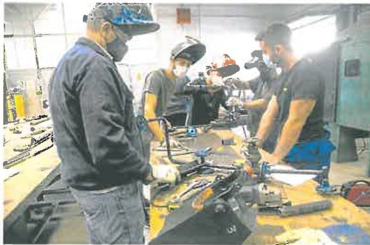
Alumnos del centro de Formación Profesional de San Félix, Cartagena.

Según el citado documento, solo Navarra (20,6%) y Cataluña (9,8%) cuentan con un porcentaje más alto que la Región de Murcia en cuanto a Grado Superior. En el caso del Grado Medio, Madrid, seguida de Navarra, superan a Murcia. Asimismo, la lista de «las familias educativas» con