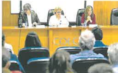
Inauguración de las jornadas, ayer.

La vicealcaldesa aseguró que «los fondos que estamos solicitando están dirigidos fundamentalmente a cuatro líneas de actuación que son la digitalización de