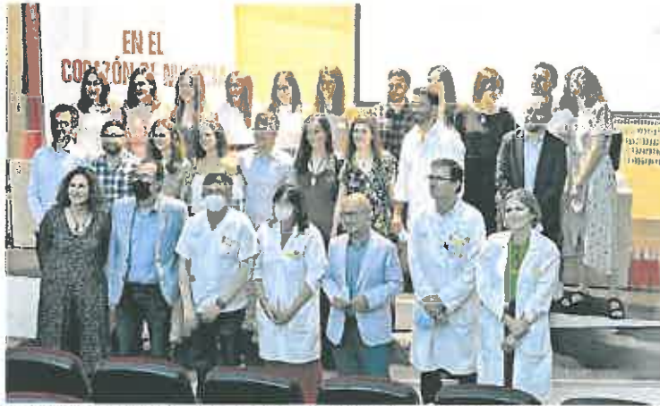
Despedida esta semana de los residentes que acaban su formación en el Morales Boteguer.

► El SMS pone en marcha un proceso de bolsa extraordinaria para trabajar durante el periodo estival y a partir del próximo 1 de junio