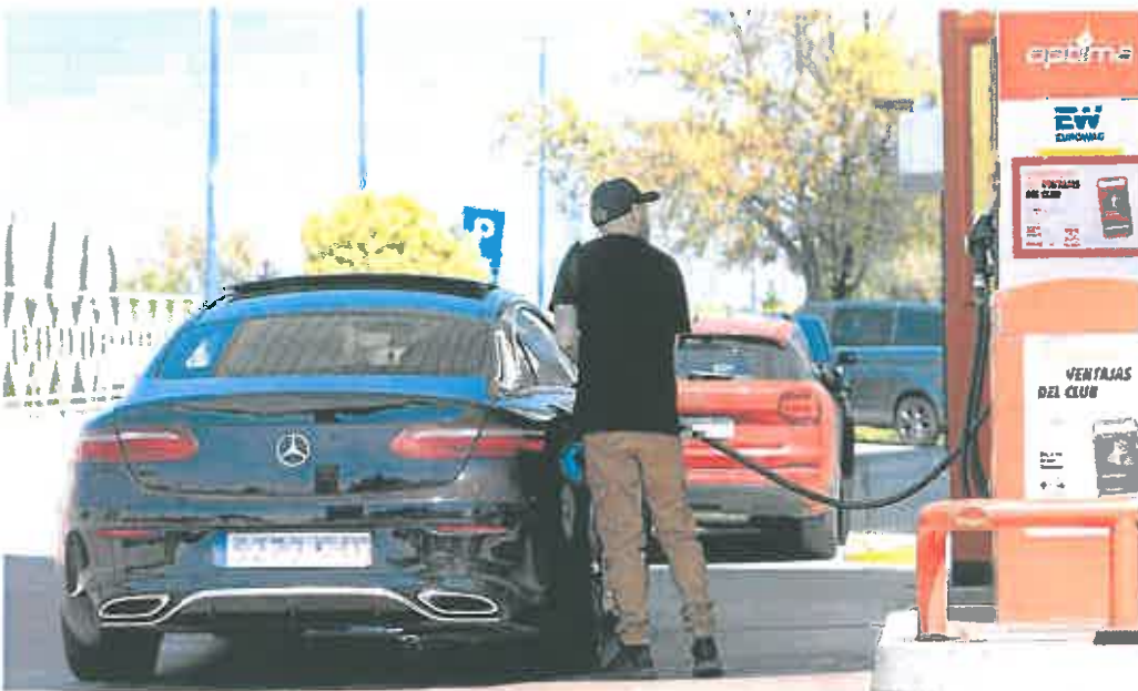
Un conductor reposta combustible en una estación de servicio de Madrid. ▀

Con estos datos, el Gobierno sigue estudiando cómo prorrogar la bonificación al combustible a partir del 30 de junio, el día en el que vence la actual ayuda. Economía no descarta ajustar la medida para limitarla a los colectivos sociales con menor renta, a la vista de que los combustibles seguirán en niveles elevados durante buena parte de 2022.