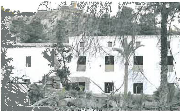
Edificio principal del Molino con fachada y cubiertas recuperadas y en la fase final de los trabajos.