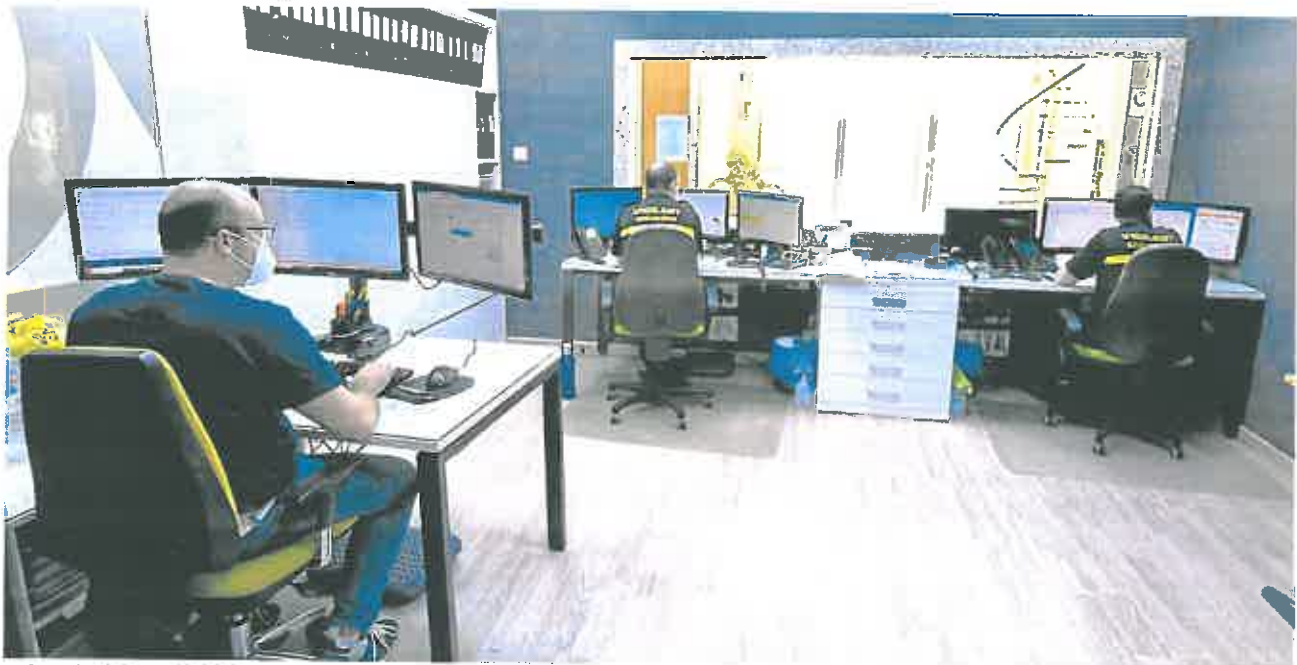
Profesionales de la seguridad de la empresa Vigilant, en uno de los cinco centros receptores de alarma (CRA) que hay en la Región de Murcia.