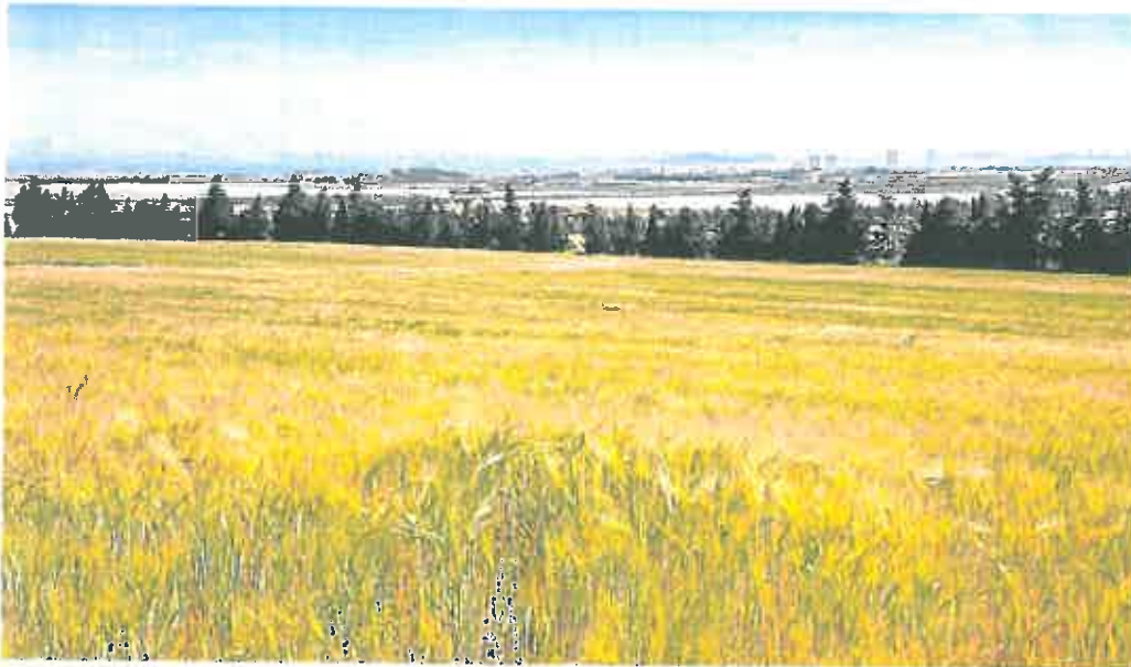
Cultivo de cebada en una parcela próxima al paraje de El Sabinar y a La Manga Club. Al fondo, el Mar Menor.