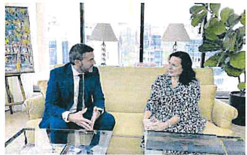
El consejero Luengo y la embajadora de España en Singapur. CARMA

«Hablamos de un mercado estable que no ha reflejado grandes variaciones en los últimos años, lo que ofrece una garantía añadida al