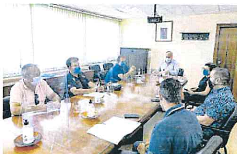
Reunión ayer entre hosteleros y el concejal de Vía Pública