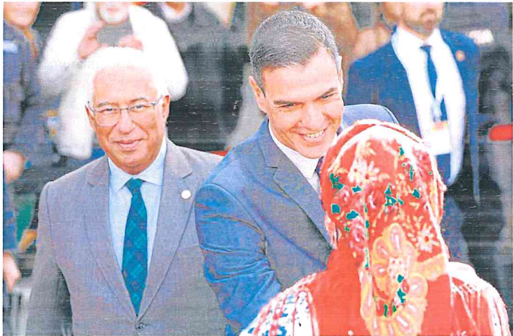
El presidente del Gobierno junto al líder portugués, António Costa, en la cumbre hispano-lusa celebrada en Viana do Castelo.

A primera hora de la mañana, el hoy vicepresidente del BCE había defendido que lo que busca el organismo con su dictamen sobre el futuro impuesto español a la banca, desvelado el jueves por la