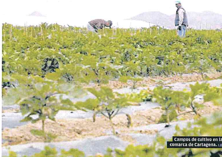
Campos de cultivo en la comarca de Cartagena. L.O.

Estos son solo algunos de los datos que se recogen en la última