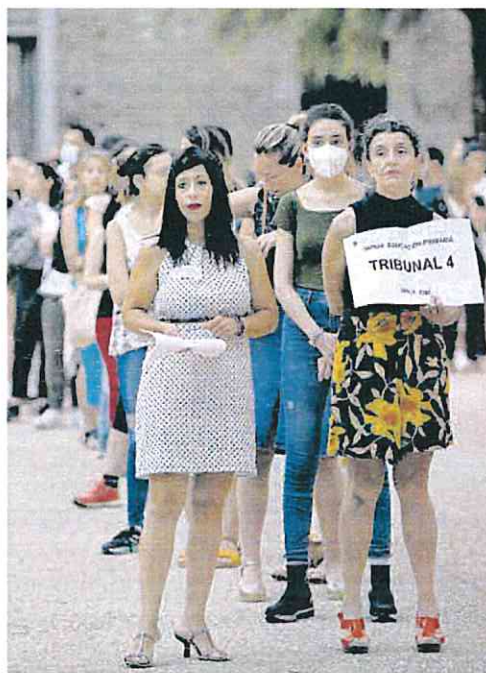
Una de las colas para las oposiciones a maestro. LOYOLA PÉREZ DE VILLEGAS

Los sindicatos representados en la Mesa Sectorial de Educación rechazaron ayer el texto de la orden por la que se convocará un concurso excepcional de mé-