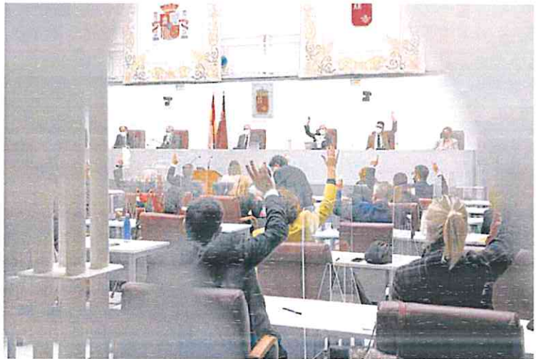
Los diputados regionales levantan la mano para votar durante un Pleno de esta legislatura.