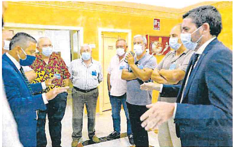
Representantes del sector agrario, en la Asamblea, el día de la votación de la Ley en 2020.