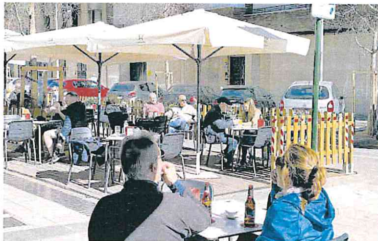
Las mesas y sillas en zonas de aparcamientos se autorizaron de manera extraordinaria

Además, el Ayuntamiento ha dejado la puerta abierta a que los propietarios de los locales que se vean más afectados por la derogación de esta medida puedan regularizar su situación. «A partir de este momento, los hosteleros que