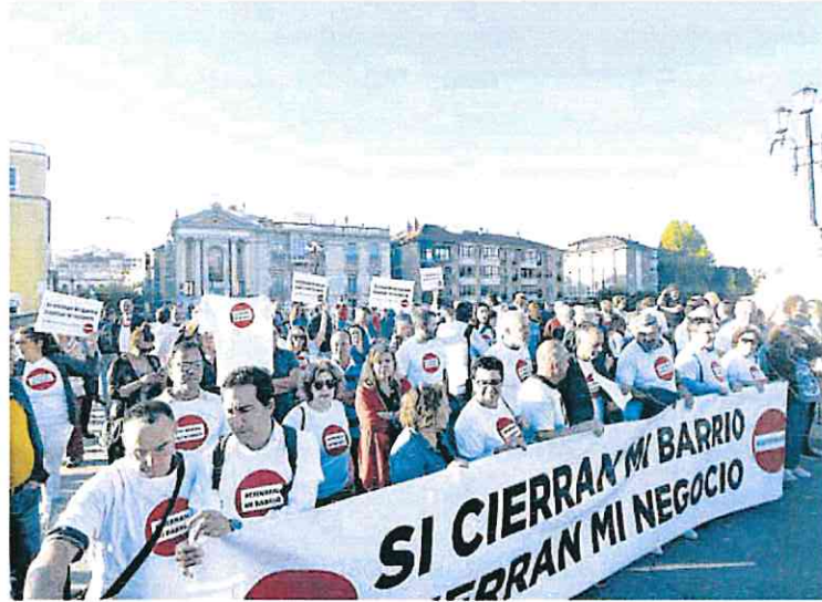
Una de las movilizaciones realizadas por vecinos del Carmen en el Puente Viejo

► La Asociación de Consumidores y Usuarios en Red, Consumur, mostró ayer su malestar por la pasividad con la que la Concejalía de Movilidad Sostenible está actuando para mejorarlos parquímetros del municipio. Esta organización lleva casi dos años reclamando «cuestiones básicas» como la instalación de monederos digitales. «Resulta inadmisible que se siga obligando al usuario a introducir el importe exacto, un sistema poco equitativo, además de obsoleto», señalan desde Consumur, que también lamenta la falta de información que ofrecen y que determinadas monedas, como las de uno y dos céntimos, «no sean admitidas».