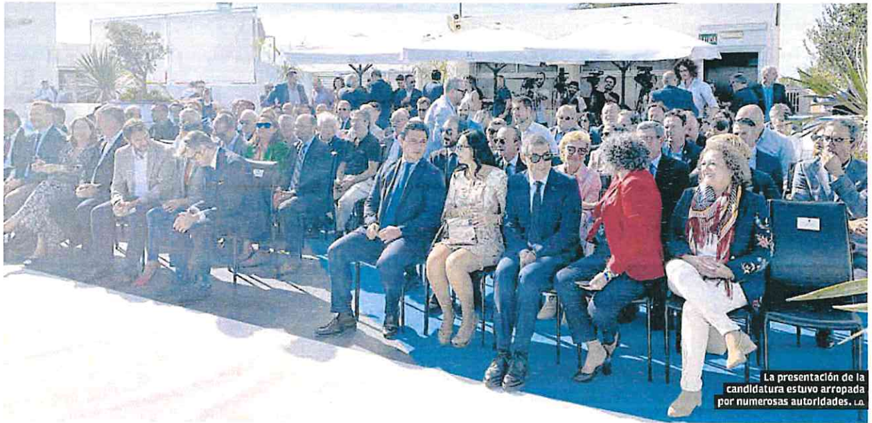
La presentación de la candidatura estuvo arropada por numerosas autoridades. I.F.C.