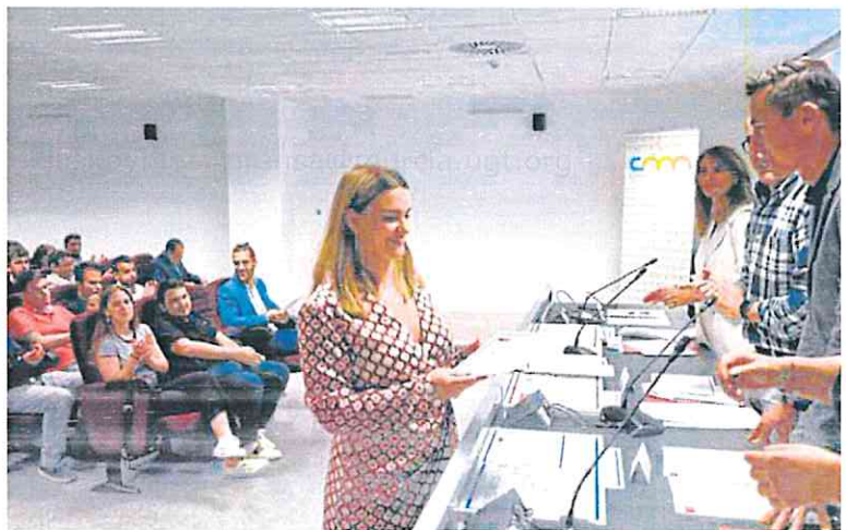
Una de las alumnas recoge su premio.