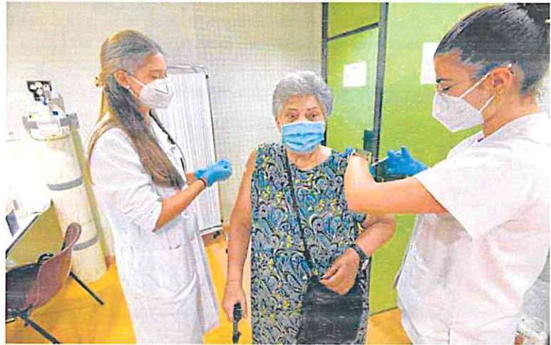
Dos enfermeras administran la vacuna de la gripe y de la Covid a una mujer en Murcia.