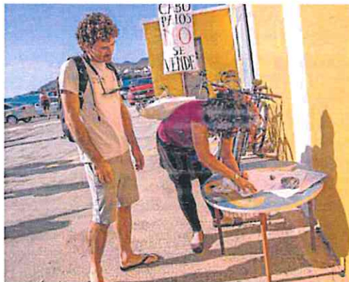
Una joven firma contra el establecimiento hostelero.

urbanística y un atropello. El pueblo no necesita más restaurantes, precisa de muchas otras cosas y, ojo, no estamos en contra