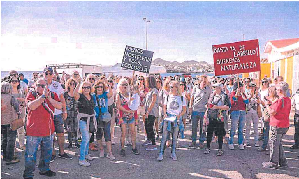
Vecinos con pancartas, ayer, durante la manifestación celebrada frente a la lonja de Cabo de Palos, donde se proyecta el restaurante.