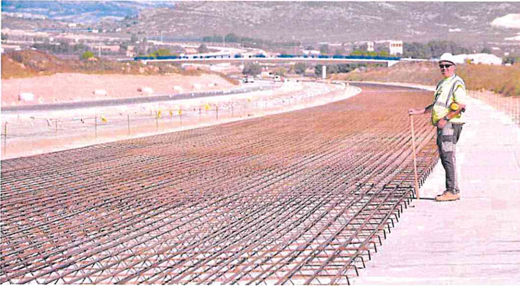
Obras en el último tramo de la autovía A-33, entre Yecla y Caudete.