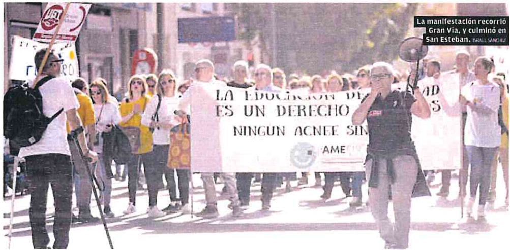
La manifestación recorrió Gran Vía, y culminó en San Esteban. FERRI SANCHEZ

Los manifestantes, formados por asociaciones de madres y padres de centros escolares, así como representantes sindicales y profesionales, pretenden que la Consejería de Educación contrate más personal de apoyo al alumnado con problemas de autonomía debido a discapacidades físicas, psíquicas o problemas orgánicos. Desde la plataforma denuncian la nula creación de plazas en la Relación de Puestos de Trabajo y el aumento de contratos precarios con programas de solo 10 meses, que «cada año tie-