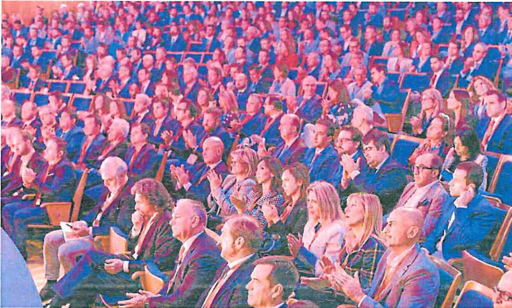
El Auditorio Víctor Villegas de Murcia se llenó ayer de directivos que asistieron a la Jornada CEO Congress organizada por Croem.