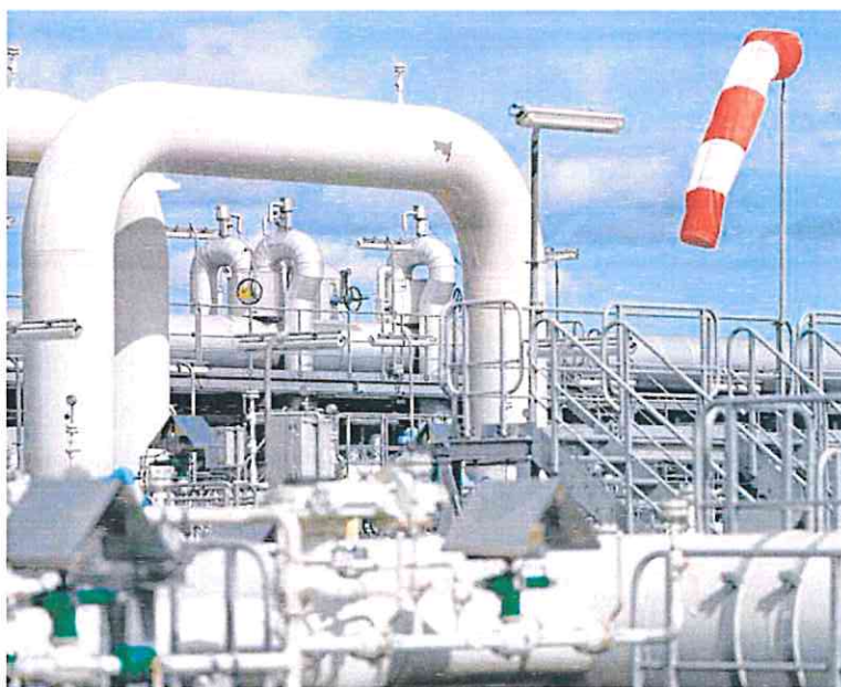
Infraestructura del gasoducto Nord Stream que une Rusia y Alemania.

La propuesta llega en medio de otra escalada de los precios del gas natural como la que se viene registrando en la última se-