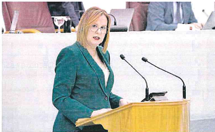
Isabel Franco, ayer en la Asamblea Regional.

En la tribuna de la Cámara murciana, la vicepresidenta lamentó que su Consejería no pudiera desarrollar el Plan de Contingencia que se anunció en abril para ayudar a los ucranianos desplazados en la Región y que fue avalado por el Ministerio. Sin embargo, desde el Gobierno de España anunciaron que estaban trabajando en otras iniciativas, obligándoles a paralizar su