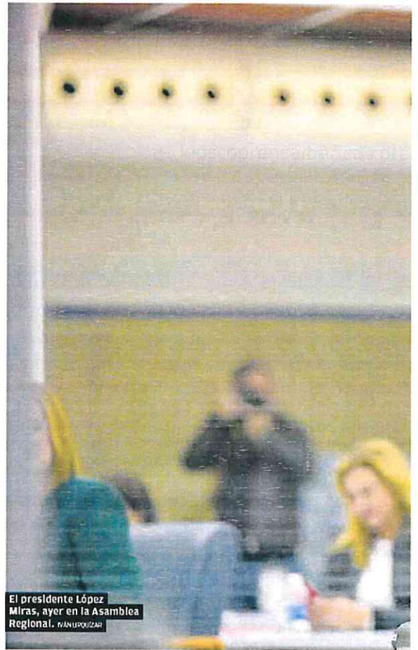
El presidente López Miras, ayer en la Asamblea Regional. | MANUELO VILLALBA

Añadió que en las cuentas para el próximo año irá la deflatación del tramo autonómico del IRPF para rentas de menos de 60.000 euros, «lo que ayudará a sostener el consumo». También mostró su intención de «seguir avanzando en la rebaja de los tipos de ese tramo autonómico del Impuesto de la Renta, conforme al calendario que fijamos en 2018».