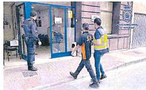
Uno de los detenidos por el apuñalamiento del portero.

Las gestiones realizadas por los agentes del grupo de investigación de la Policía Nacional, así como el visionado de los sistemas de videovigilancia fueron determinantes para poder determinar