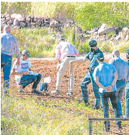
Recogida de muestras en terrenos agrícolas cercanos a la cantera Los Blancos, el pasado mayo.

En un informe fechado a principios de octubre, el Seprona alertó del «daño» que la dispersión de esos desechos peligrosos procedentes de la antigua cantera, convertida ahora en vertedero de residuos mineros, ha tenido en suelos agrícolas del entorno y del peligro