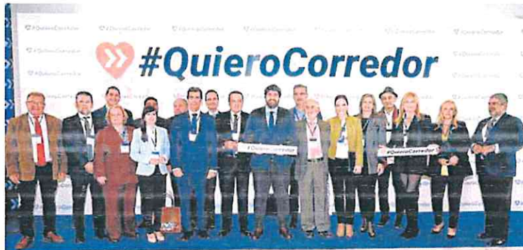
Integrantes de la delegación regional que asistieron a la cumbre empresarial de Barcelona.