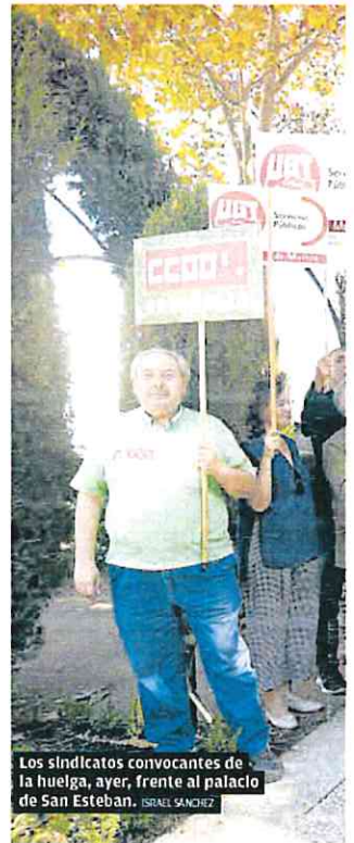
Los sindicatos convocantes de la huelga, ayer, frente al palacio de San Esteban. ISRAEL SANCHEZ

El currículo establece que la enseñanza de la lengua extranjera se impartirá desde el primer curso de Primaria, y que ésta será el Inglés, mientras que la segunda lengua extranjera será el Francés, en los cursos que la incluyan. Igualmente, se pone énfasis en que los centros docentes dedicarán un tiempo diario a la lectura comprensiva durante la jornada escolar, en todos los cursos de la etapa. De esta forma, la lectura será considerada como un elemento transversal del currículo.