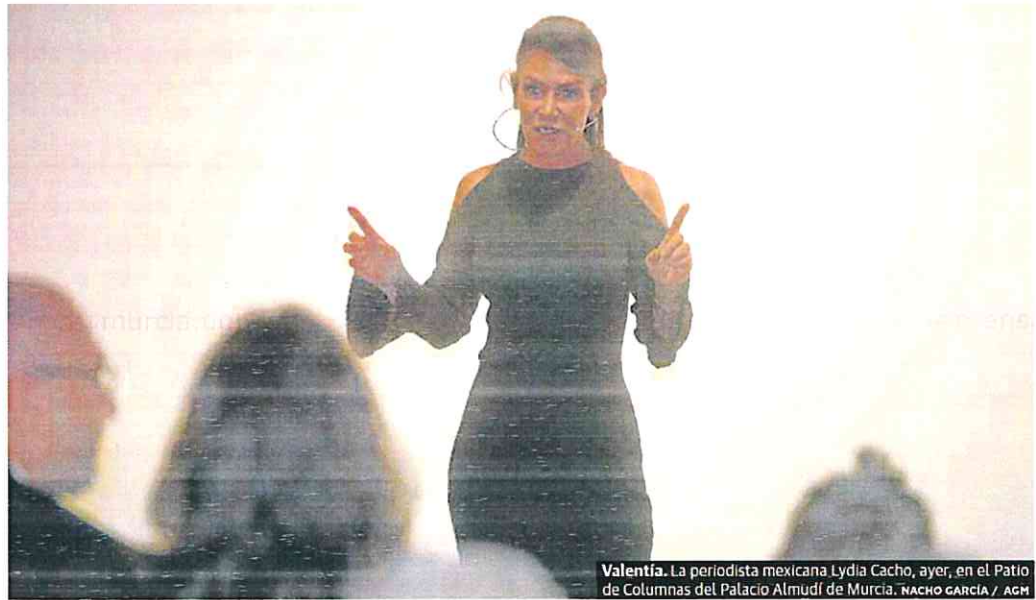
Valentía. La periodista mexicana Lydia Cacho, ayer, en el Patio de Columnas del Palacio Almuñí de Murcia.

-En las etiquetas que se le ponen a las personas. Creo que las etiquetas están muy bien para el pollo envasado, pero para las personas no me gustan. Les doy a todos una oportunidad de demostrarme que lo pueden hacer mejor de lo que dicen que lo pueden hacer. Confío en todos; estoy seguro de que cuando cada uno encuentre la generosidad para mirar a los demás como se mira a sí mismo, será capaz de cambiar y de mejorar el tiro para la siguiente vez.