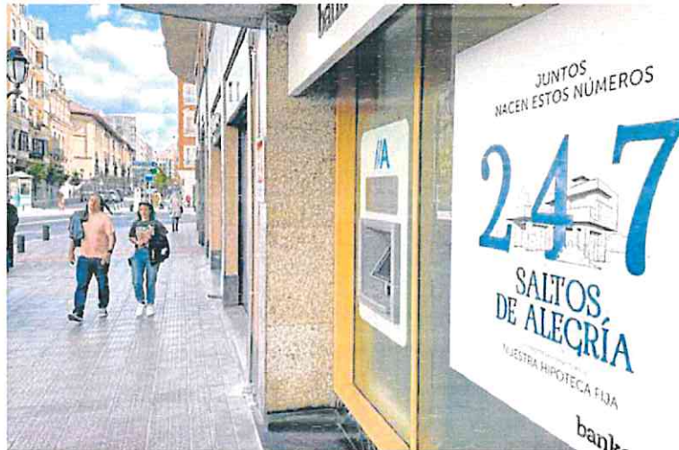
Publicidad hipotecaria en el escaparate de una entidad financiera. L. A. LÓPEZ

El Ejecutivo, asimismo, ha cedido ante Bildu al abrir la puerta a que este impuesto y el que se aplicará a la banca sean permanentes, además de permitir a las haciendas forales vascas y navarras gestionar los dos gravámenes.