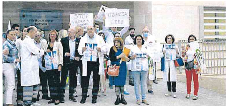
Concentración en el centro de salud de Fortuna contra las agresiones a los sanitarios, el mes pasado. PEPE VALERO

El progenitor cuenta que «cuando la atendieron me calmé; llegó la Policía y me registró a mí y a mi vehículo». La menor fue diagnosticada con un virus y su padre apunta que «se encuentra bien».