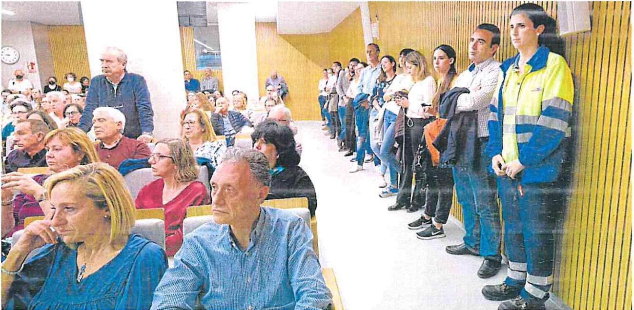
Médicos de Atención Primaria escuchan a los intervinientes en la asamblea, ayer en el Colegio de Médicos.