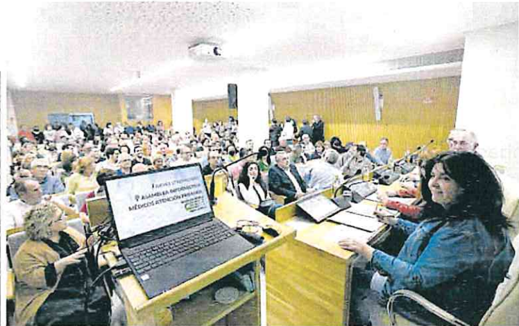
La asamblea tuvo lugar en la sede del Colegio de Médicos, en un abarrotado salón.

Desde la Sección de Urgencias Infantil de la Arrixaca recuerdan que las principales medidas preventivas para evitar el VRS es la correcta higiene de manos, evitar espacios cerrados y el contacto con otras personas con síntomas catarrales -para los recién nacidos o lactantes pequeños esto incluye evitar el contacto con sus hermanos mayores con síntomas respiratorios-.