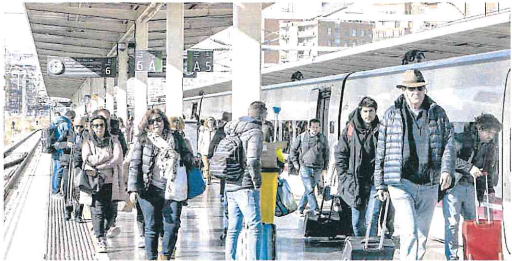
Llegada a Alicante de viajeros procedentes de Barcelona en un Euromed.

Con la llegada del AVE a Madrid a partir de diciembre Murcia tendrá por primer vez un trazado electrificado, pero será en ancho internacio-