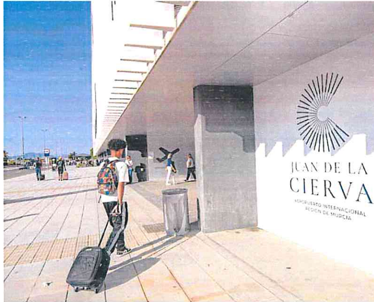
Un pasajero accede con su maleta al aeropuerto de Corvera.

Los billetes ya están a la venta para viajar a Madrid hasta el 14 de septiembre, en un recorrido donde la operadora ofrecerá dos trenes por sentido al día, con salida de Madrid-Chamartín a las 7.45 y a las 15.45 y llegada a Alicante a las 10.10 y a las 18.10, respectivamente; realizará una parada en Albacete. Las salidas serán a las 12.25 y a las 19.25, llegando a Madrid-Chamartín a las 14.50 y a las 21.52, respectivamente.