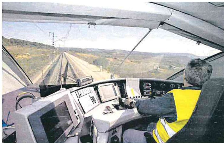
Trazado por el que discurrirán los trenes hasta 2025, desde un tren laboratorio de Adif.