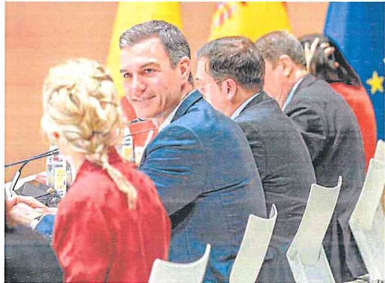
Pedro Sánchez charla con Yolanda Díaz, ayer, en la cumbre hispano-rumana de Castellón.