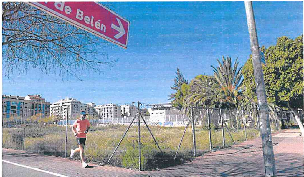
Solar donde Assido espera poder construir su nuevo centro social y residencia.

Esta cartografía marca como zona inundable el solar de Príncipe de Asturias que el Consistorio cedió a la asociación para levantar sus nuevas instalaciones. La declaración de alta inundabilidad del municipio, aprobada hace unos meses, autoriza la edificación en estas áreas de viviendas, con ciertas medidas de protección, pero no permite levantar la prohibición de construir equipamientos de cualquier tipo. Esta circunstancia