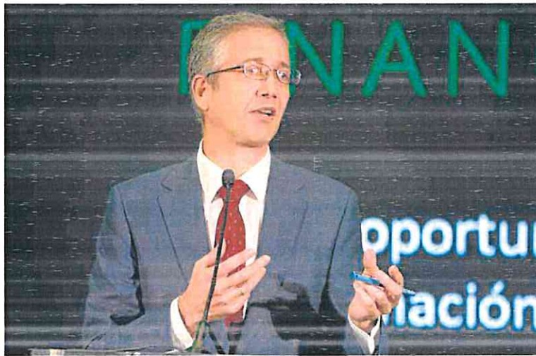
El gobernador del Banco de España, Pablo Hernández de Cos, en una intervención pública. JAIME GARCÍA

Para consolidar las cuentas públicas, España debería ajustar su gasto entre el 0,25 y 0,5 puntos del PIB el año que viene, es decir, entre 3.000 y 6.500 millones de euros aprovechando el impacto de los fondos europeos en el crecimiento económico. Y a partir de 2024 habría que recortar aún más los desembolsos, al menos hasta el 0,6% del PIB, lo que significaría unos 8.000 millones al año, con el objetivo de reducir deuda y déficit público.