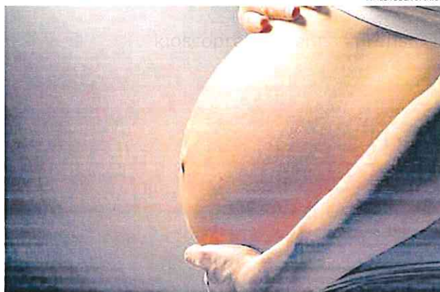
IMAGEN DE LA OPINIÓN

La violencia obstétrica es un asunto que requiere de mucha mayor atención. Ciertamente, faltan estudios, investigaciones y resultados estadísticos para analizarlo con más amplitud e intensidad, pero lo que sí podemos constatar es que las mujeres continuamos siendo maltratadas por el sistema de salud, y no estamos hablando de casos aislados, de malas prácticas, o de sanitarios sin escrúpulos, sino de un hecho estructural y endémico, tan normalizado y cotidiano que somos incapaces de apreciarlo en toda su crudeza a simple vista y, por supuesto, estas denuncias de violencia obstétrica no son resultado de mentes femeninas históricas, perturbadas por las hormonas del embarazo, como en muchas ocasiones, nos quieren hacer creer.