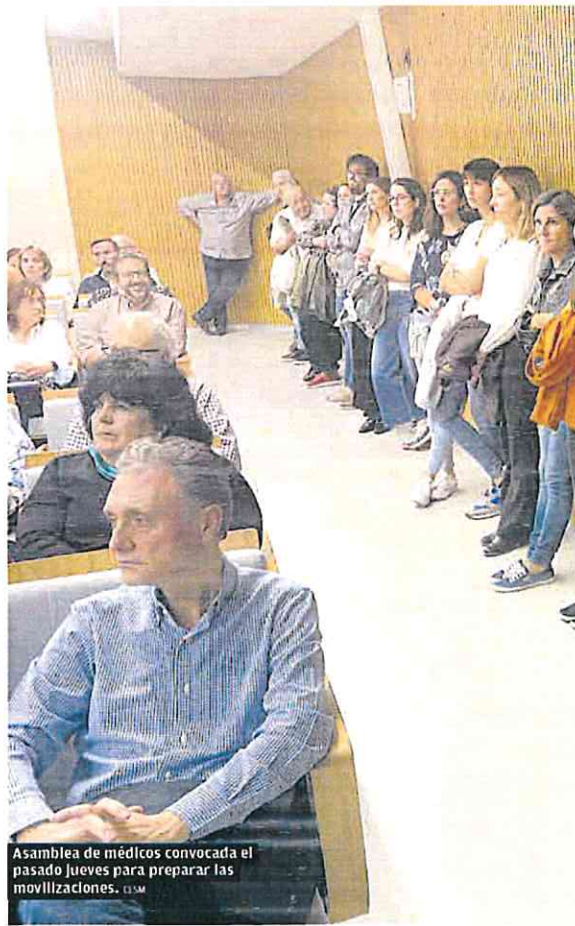
Asamblea de médicos convocada el pasado jueves para preparar las movilizaciones.