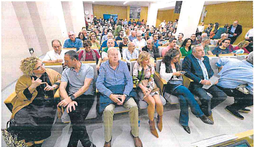
Asamblea de médicos de familia celebrada el pasado jueves en el Colegio de Médicos, en Murcia.

El Gobierno regional reconoce, en el borrador enviado a los sindicatos, que «los servicios sanitarios se han visto sometidos a una gran carga de trabajo para dar respuesta a las necesidades asistenciales de los usuarios en una crisis sin precedentes, tanto por el número de ciudadanos afectados [por la Covid] como por la enorme presión que han sufrido los cen-