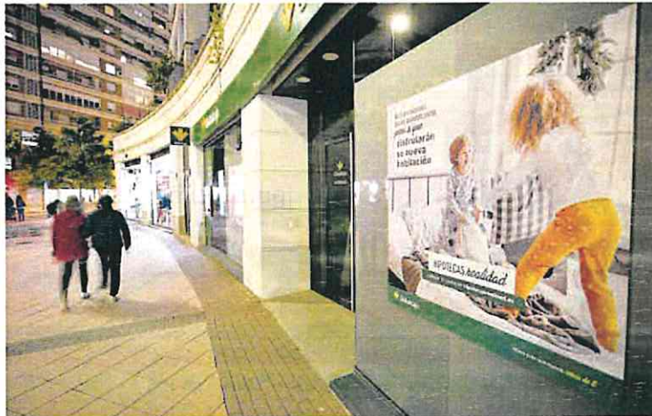
Publicidad de las hipotecas en una entidad financiera de Murcia.

Las nuevas ayudas incluidas en el Código de Buenas Prácticas aprobado en 2012, cuando la crisis financiera llegó a causar los mayores estragos, permitirán que los deudores vulnerables tengan la posibilidad de reestructurar el préstamo