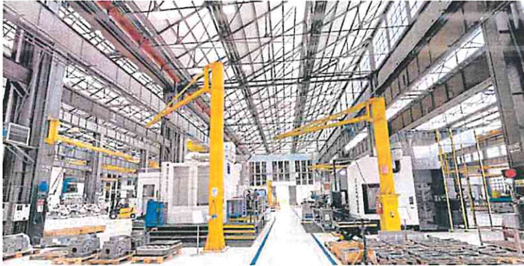
Panorámica del taller de Navantia Motores en la actualidad, una de las imágenes que se expondrán. NAVANTIA