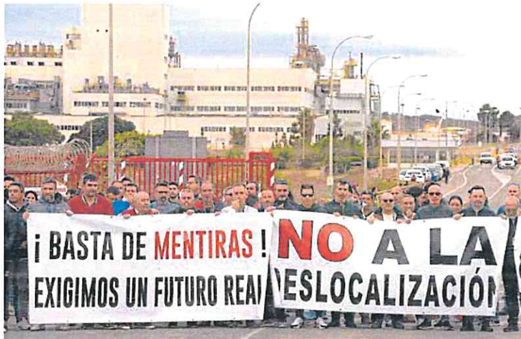
Trabajadores de Sabic, durante la concentración que protagonizaron el pasado martes en la factoría.

Se suman a esta protesta «ante las repercusiones que las inminentes decisiones de la compañía pudieran tener sobre el elevado número de trabajadores directos e indirectos afectados y sus res-