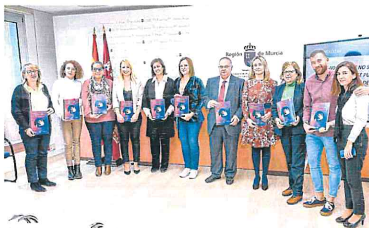
Representantes de las asociaciones de personas con discapacidad con la autora del Informe (5-I), ayer.

La lista negra de la barbarie machista ESPAÑA P30