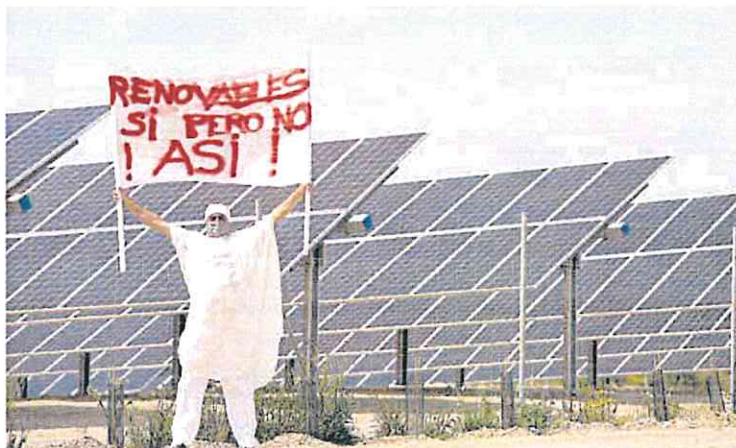
Protesta en La Aljorra (Cartagena) por la instalación de placas solares.

En caso como la Región de Murcia, los distintos proyectos que plantean sobre el terreno grandes instalaciones fotovoltaicas ha levantado las quejas de nu-