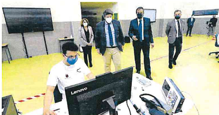
El centro politécnico de Murcia, el último en ponerse en marcha en la Región.

Además, reclama que «es urgente eliminar la tasa de reposición y adoptar una serie de medidas relacionadas con la jubilación del profesorado, a la vista de las nuevas exigencias y los profundos cambios que se están produciendo en la educación, que exigen unas buenas condiciones psicofísicas del profesorado».