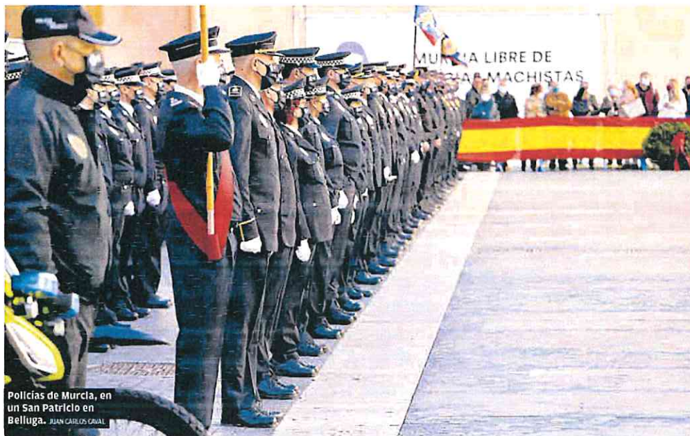
Policías de Murcia, en un San Patricio en Belluga.