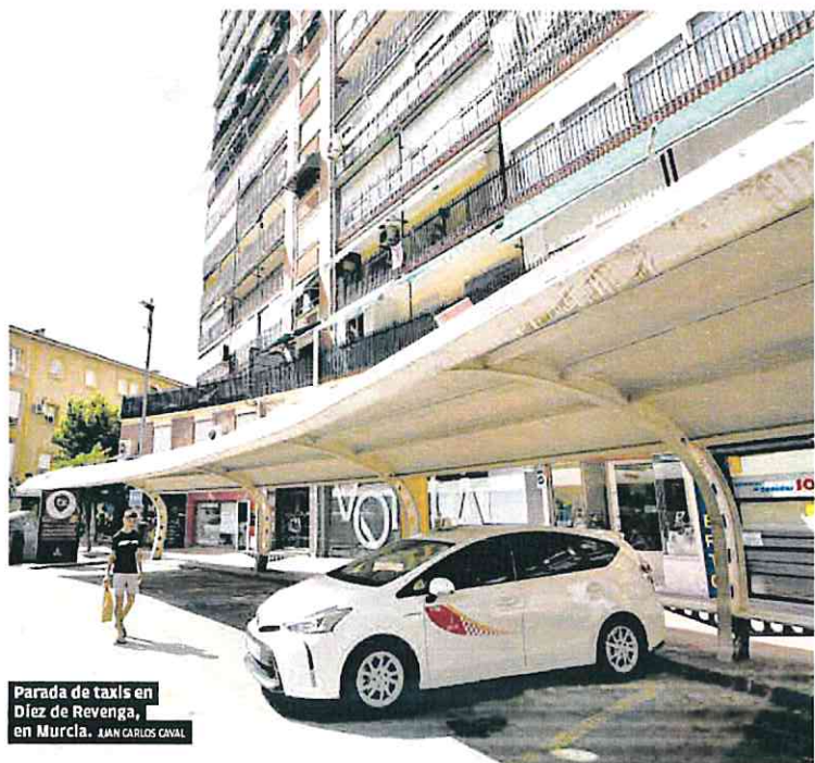
Parada de taxis en Díez de Revenga, en Murcia.