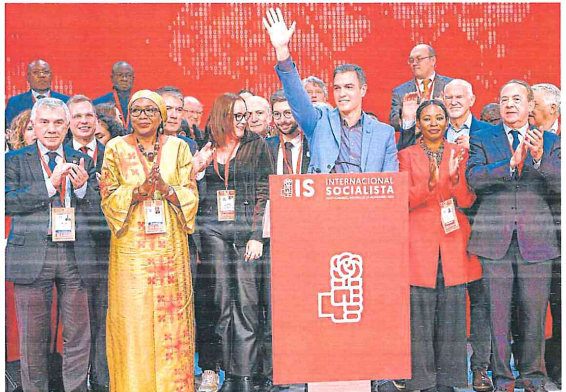
Pedro Sánchez saluda desde el atril tras la clausura del XXVI Congreso de la Internacional Socialista, celebrado en Madrid.

de 2018 se haya incrementado el Salario Mínimo Interprofesional hasta en cuatro ocasiones —más de un 30%— y a renglón seguido instó a la CEOE, en la que Antonio Garamendi estrena nuevo mandato, a negociar con los sindicatos «un acuerdo salarial que dé seguridad a los trabajadores». Abandonó también que las grandes empresas paguen más impuestos o recordó que en su Gobierno hay más presencia de mujeres que de hombres. Frente a todos estos lo-