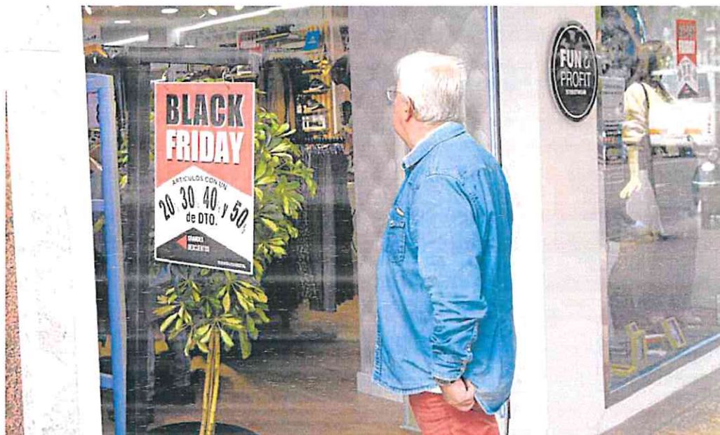
Un cliente, ante un comercio de Murcia que luce un cartel con descuentos por el 'Black Friday'.