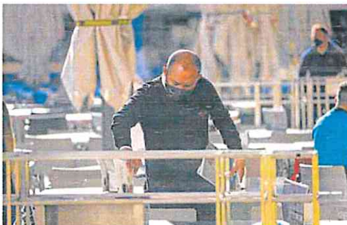
Los camareros son una de las profesiones con mayor tensión. O. CHAMORRO

la pandemia y el riesgo de mala salud mental alcanza a cerca del 61% de los encuestados en 2021, con una marcada desigualdad: las mujeres mostraron un 12% más de riesgo que los hombres y los jóvenes de 16 a 34 años se vieron un 15% más perjudicados que los mayores de 50 años.