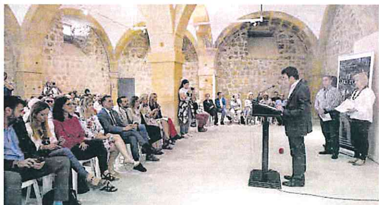
Acto del Día de las Personas Mayores en la Sala Caballerizas de Murcia.

«Como estamos en una crisis energética y alimentaria miles de trabajadores, de pensionistas y jubilados, tienen problemas para llegar a final de mes», recuerdan los sindicatos.