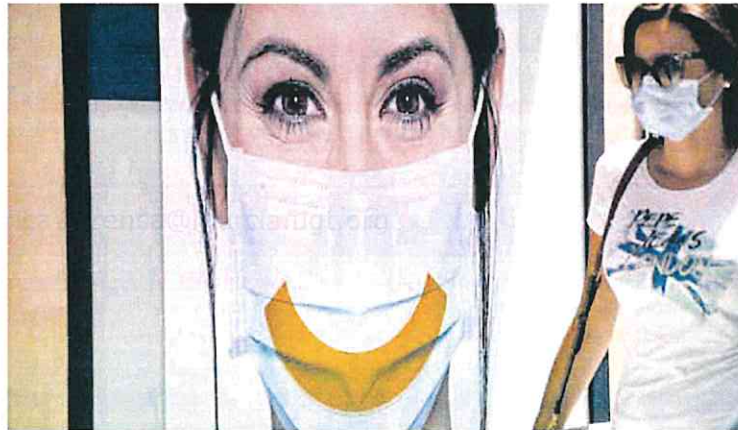
Una mujer con una mascarilla quirúrgica, en 2020.

Se trata de la quinta fiscalización específica sobre contratación de emergencia de las siete programadas por el Tribunal de Cuentas que, además, realizará un Informe Global cuya aprobación se prevé en 2023, que pretenda exponer de manera agregada los principales resul-