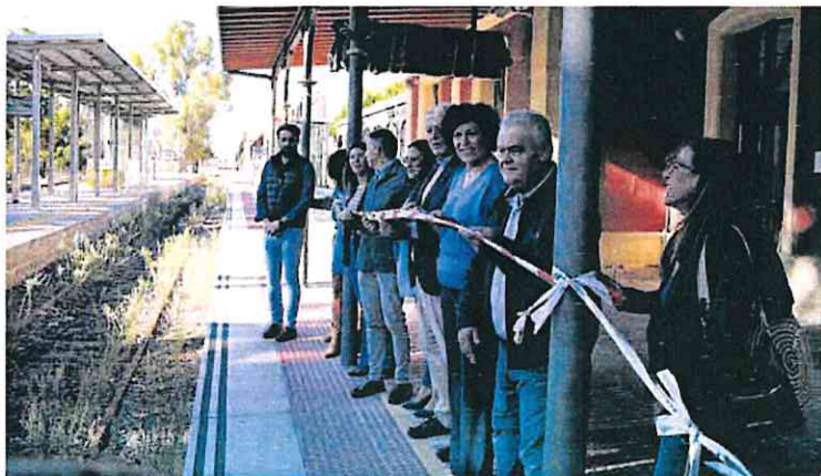
Dirigentes del Partido Popular de los municipios del Guadalentín en el andén de Sutullena.