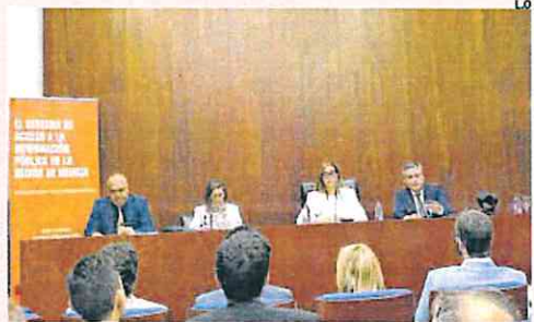
El libro del CTRM se presentó ayer en la UMM.