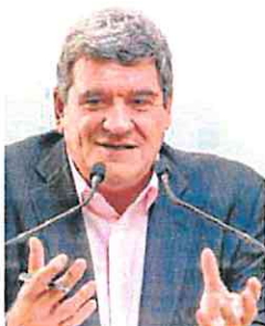
José Luis Escrivá. EFE

El euríbor sigue anticipando la política de tipos del Banco Central Europeo (BCE). La actual evolución de precios posiblemente obligue a la institución a subir de nuevo los tipos en su próxima reunión hasta el entorno probable del 2%.