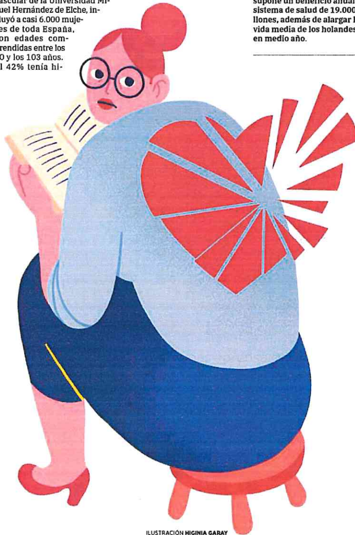
ILUSTRACIÓN HIGINIA GARAY

mueres al año ha logrado evitar la costumbre de usar como medio de transporte la bicicleta en Holanda. Se estima que supone un beneficio anual al sistema de salud de 19.000 millones, además de alargar la vida media de los holandeses en medio año.