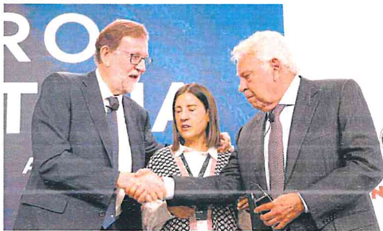
Los expresidentes del Gobierno Mariano Rajoy y Felipe González, ayer en el Foro de La Toja.