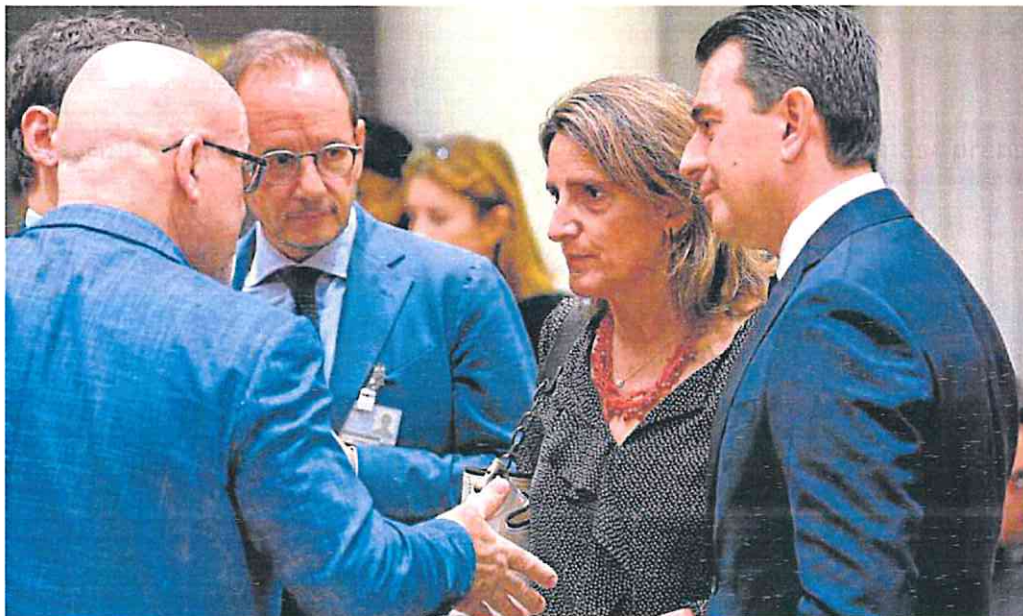
La ministra para la Transición Ecológica, Teresa Ribera, ayer junto a sus homólogos europeos en Bruselas.

Pero también son muchos los países que se oponen a una medida de este tipo, debido a los riesgos que supone para la seguridad energética del continente. Y es que imponer un tope al gas na-