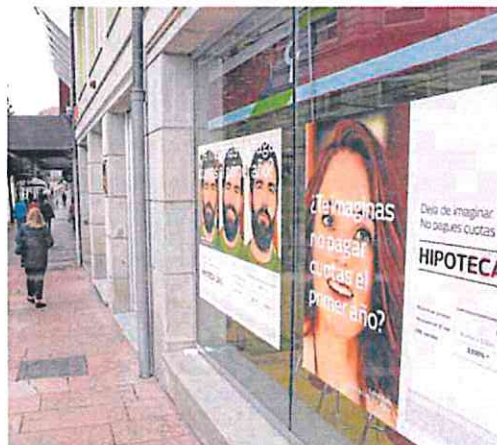
Oferta de hipotecas en una entidad bancaria.

A pesar de esos cálculos generales, las entidades financieras recuerdan que no todas las familias se ven afectadas de la misma forma por esta subida del euríbor. En primer lugar, porque buena parte de los créditos a interés variable fueron contratados hace más de una década, cuando los diferenciales eran inferiores a los actuales, llegando incluso a ofertas de apenas 0,25 puntos más el euríbor. Además, insisten en que buena parte de esos hogares con cré-