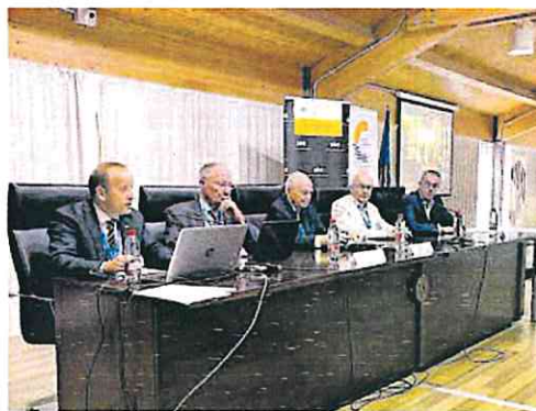
Un momento del Congreso de Transparencia.

Las agencias antifraude exigen «mayores garantías de independencia del canal interno»