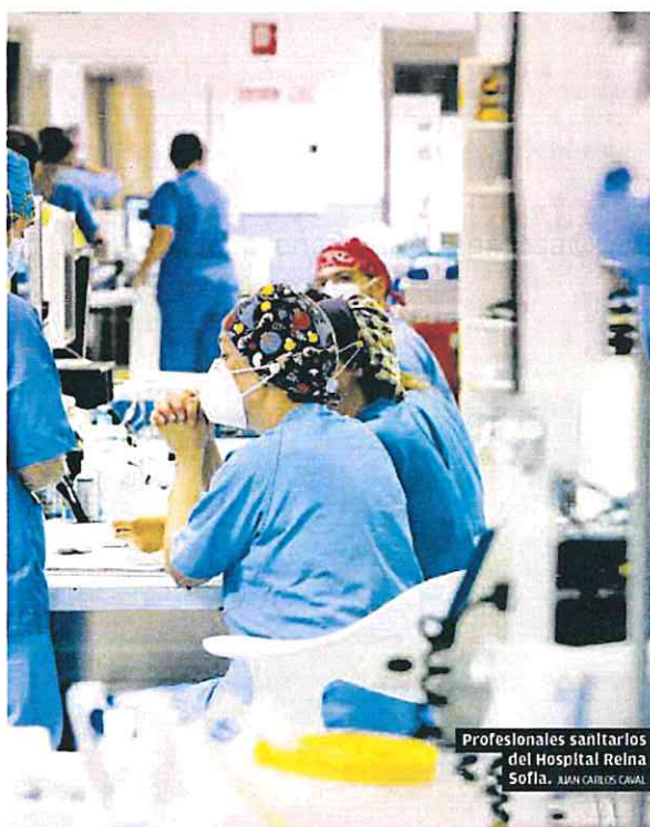
Profesionales sanitarios del Hospital Reina Sofía. JUAN CARLOS CAVAL

Murcia es la cuarta comunidad que más debe en proporción al PIB y suma 11.587 millones en créditos