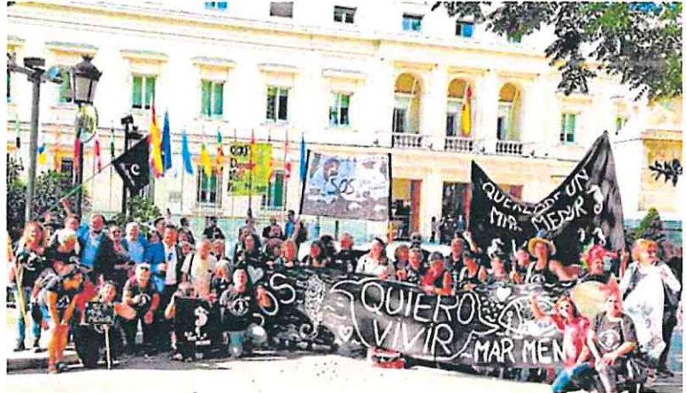
Promotores y simpatizantes de la ILP celebran su aprobación en el exterior del Senado. IEP

En términos absolutos, la Región contaba con una deuda de 8.951 millones con el Estado en ese ejercicio, la quinta mayor cantidad por comunidades, solo inferior a las de Cataluña (63.615 millones), Comunidad Valenciana (41.931 millones de euros), Andalucía (25.794 millones) y Castilla-La Mancha (11.238 millones). Así, a nivel nacional, la Comunidad Valenciana y Cataluña fueron las dos comunidades autónomas con una mayor deuda con el Estado en el año 2020, tanto per cápita como en términos absolutos.