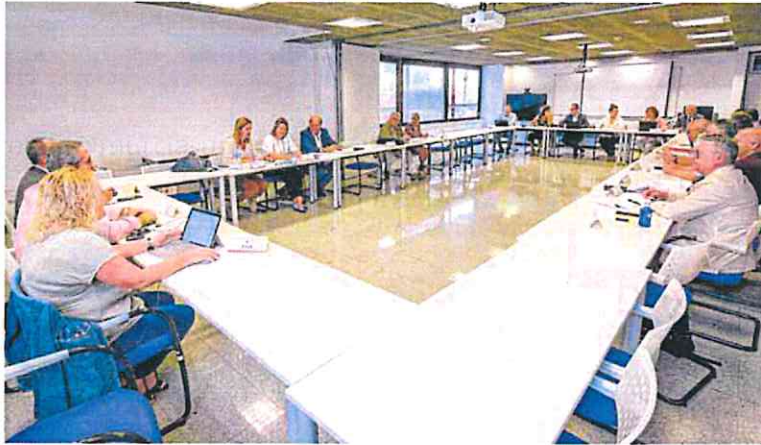
Integrantes de la Mesa General de Negociación de la Comunidad, en la reunión de ayer.

El segundo e importante capítulo del nuevo decreto ley comprende una serie de modificacio-