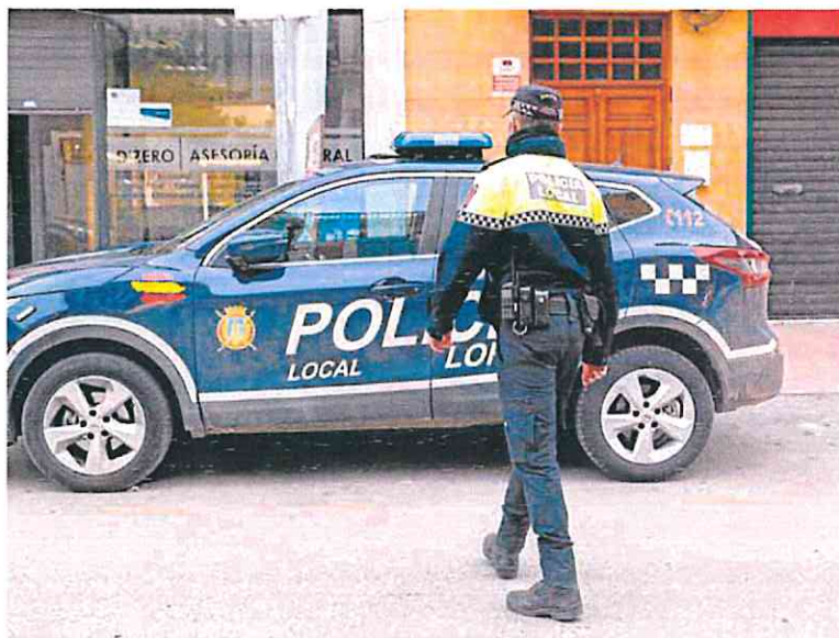
Un agente de la Policía Local de Lorca se dirige al coche patrulla.