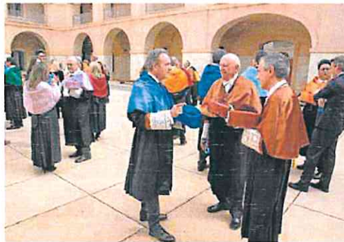
Doctores Integrantes del cortejo, antes del acto.