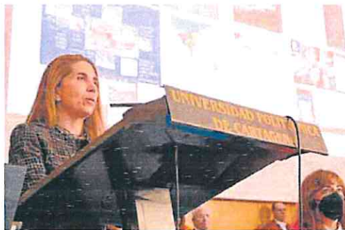
La investigadora Nuria Oliver dictando su lección magistral.