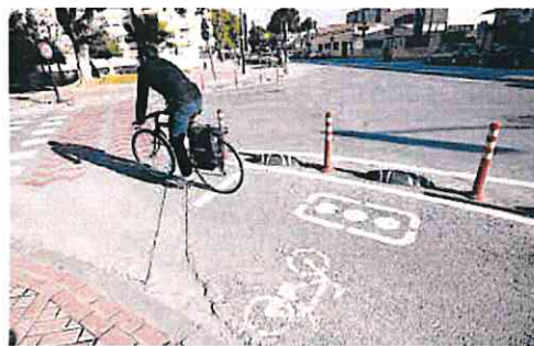
La red de carriles bici sigue creciendo en el municipio.

La inversión de estos lotes asciende a 25.543.991 euros que serán cofinanciados por la Unión Europea mediante el Plan de Recuperación, Transformación y Resiliencia-Fondo Next Generation EU, según han informado fuentes municipales en un comunicado.