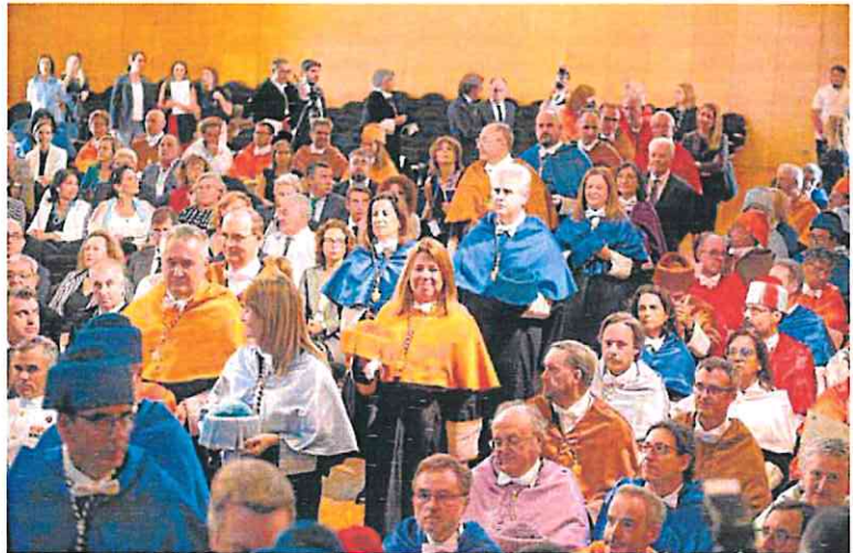
El cortejo de doctores entra al Paraninfo de la Politécnica de Cartagena.

El acuerdo es urgente, insistieron los rectores, porque el plan plurianual incluye la financiación para 2023, que debe cerrarse cuanto antes. Ese presupuesto, el del próximo año, reclaman los dos rectores, debe contemplar un incremento superior al 12% con respecto a este año. El presidente de la Comunidad no quiso concretar cifras ni porcentajes de subidas. Por lo pronto, las dos universidades se dan por satisfechas con concretar el presupuesto de 2023, que debe tener en cuenta que los remanentes de las dos instituciones están a