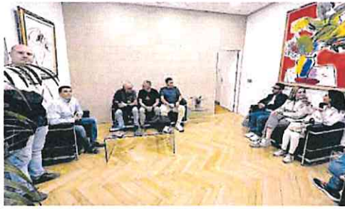
Representantes del SIME ayer en Alcaldía.