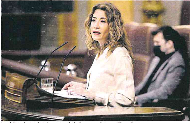
La ministra de Agenda Urbana, Raquel Sánchez, en una intervención en el Congreso.

Lo cierto es que hace ya casi dos años cuando los morados vincularon la creación de una ley que sirviera para regular los alquileres a la aprobación de los Presupuestos Generales de 2021. Fue a última hora del 26 de octubre de 2020 cuando Pedro Sánchez y Pablo Iglesias, entonces vicepresidente segundo y líder de Unidas Podemos, cerraron un acuerdo que recogía la redacción de una norma cuyo objetivo fuera establecer «mecanismos de contención, o eventualmente bajada de los precios, tanto de los nuevos contra-