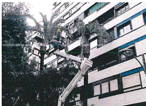
Un operario revisaba ayer palmeras en el centro.

A través de sus redes sociales han dado a conocer este trabajo con imágenes de la revisión del arbolado de gran porte que están llevando a cabo desde hace unos días, una labor que se ha puesto en marcha tras los primeros trabajos de emergencia para recuperar la normalidad y restituir los jardines del núcleo urbano y las pedanías que se vieron más dañados por la tormenta y los arrastres de barro, un trabajo que también se lleva a cabo de forma periódica, señalan.