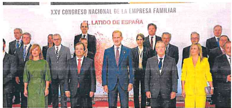
Felipe VI junto a varias autoridades en el XXV Congreso de la Empresa Familiar, ayer en Cáceres.

El Ejecutivo comunitario se alinea de este modo con las directrices del BCE, que en julio y septiembre elevó los tipos un 1,25%. «Nuestra respuesta debe asegurar que se cumple el objetivo del banco europeo de contener la inflación por debajo del 2%», destacó Dombrovskis.